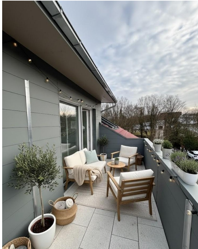
Balkon mit Einrichtungsbsp