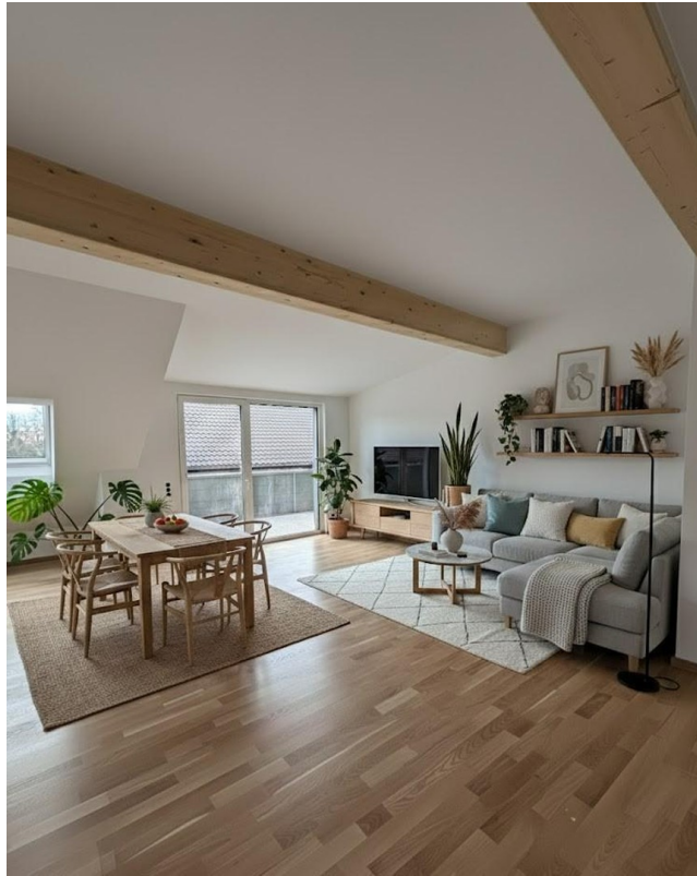
Wohn-Esszi mit Einrichtungsbsp