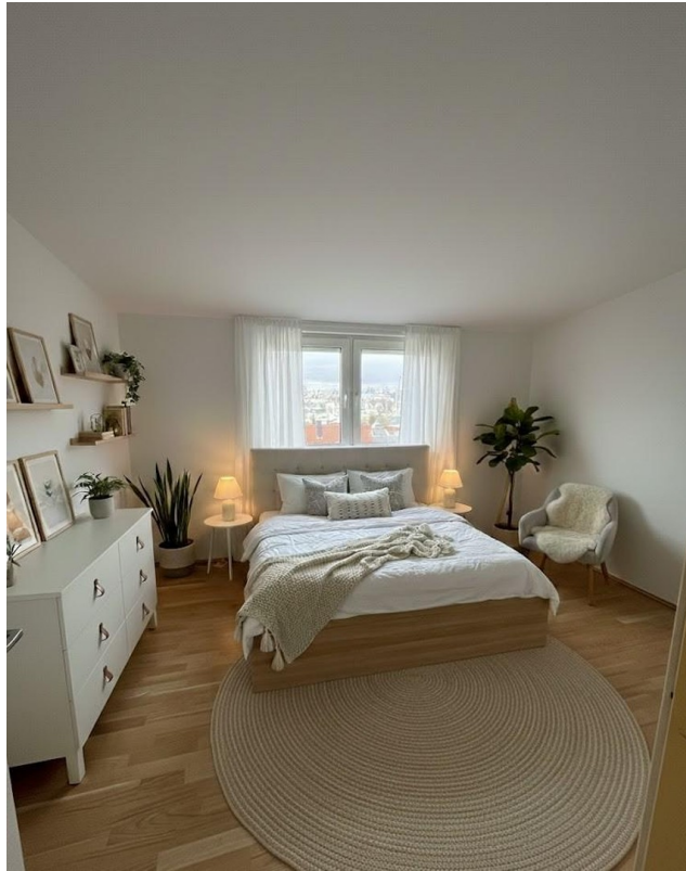
Schlafzimmer mit Einrichtungs-