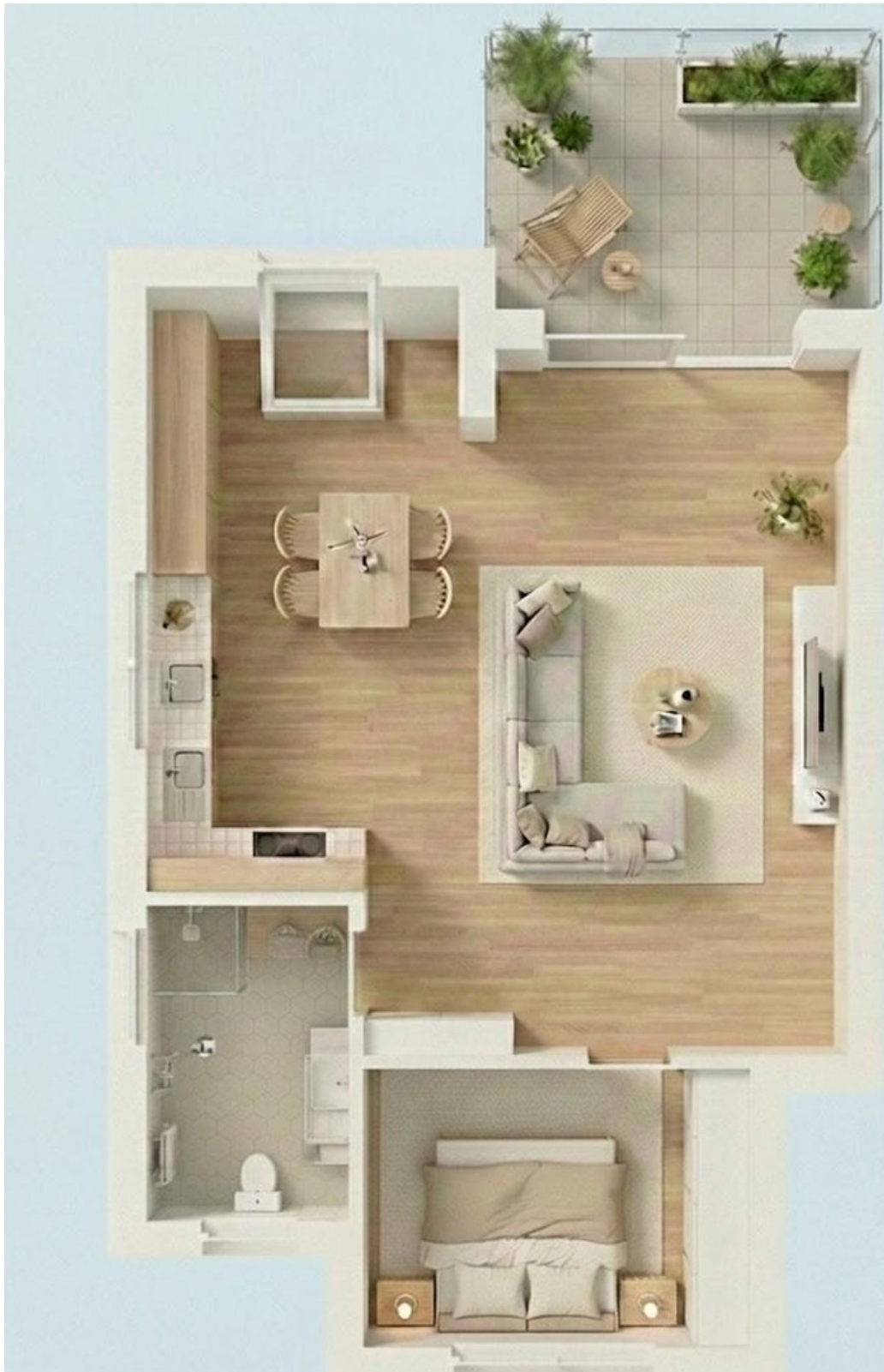
Grundriss mit Einrichtungsbsp