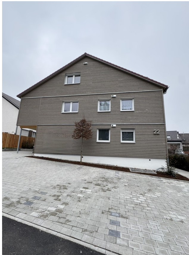
Südseite / Parkplatz