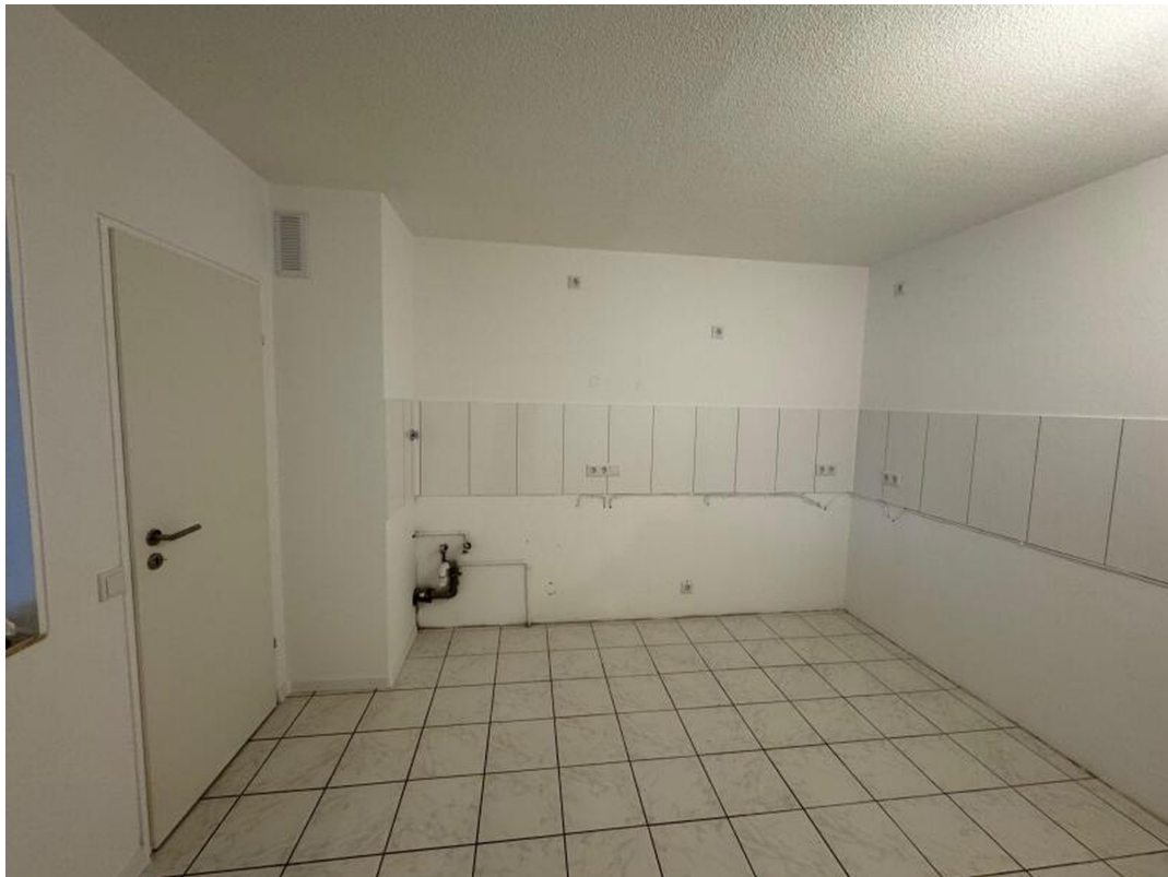
Küche mit Anschlüssen