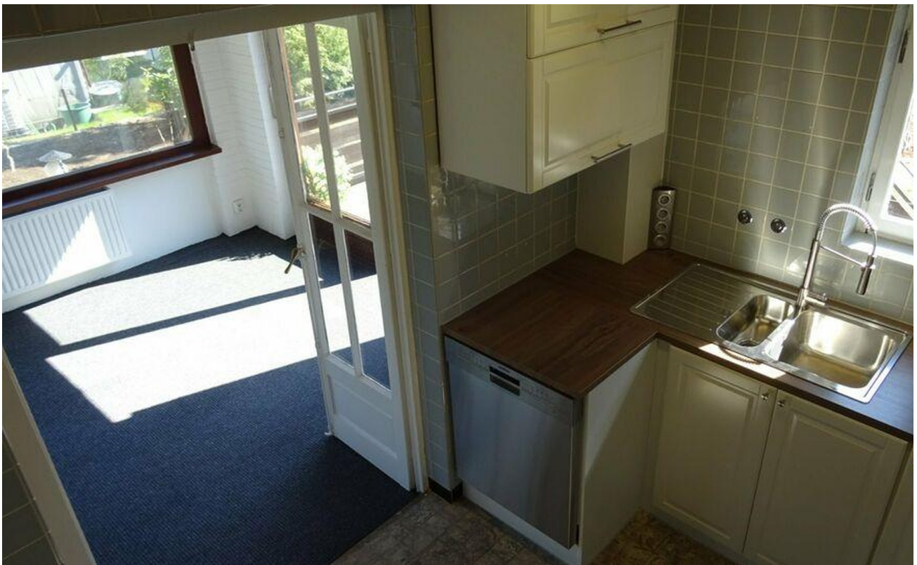
Küche mit Esszimmer