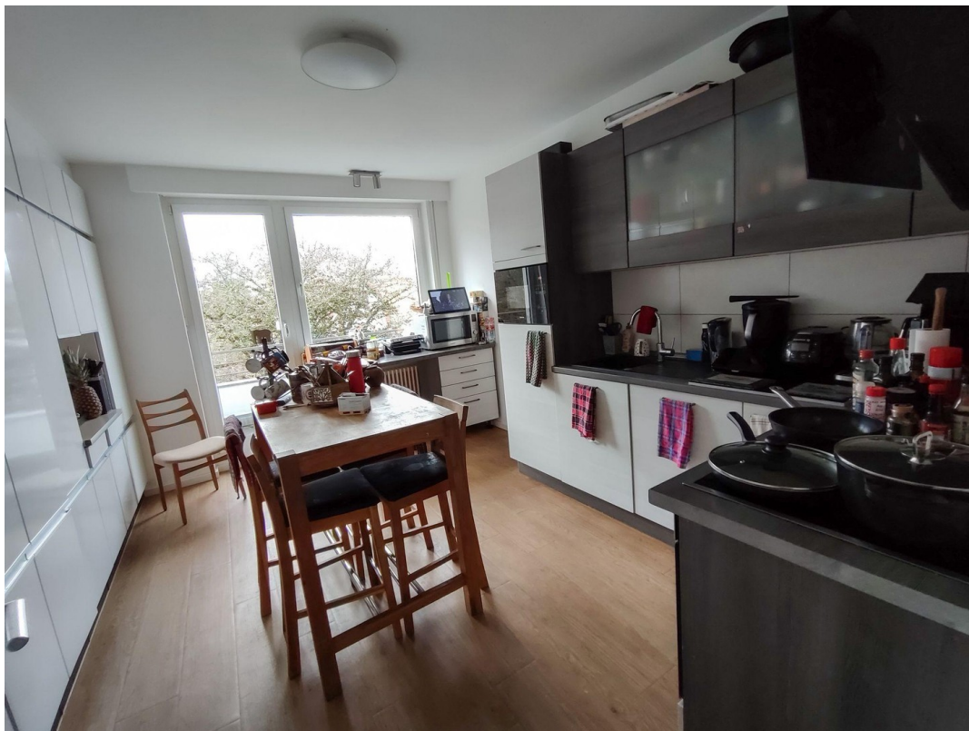
Küche mit Balkon