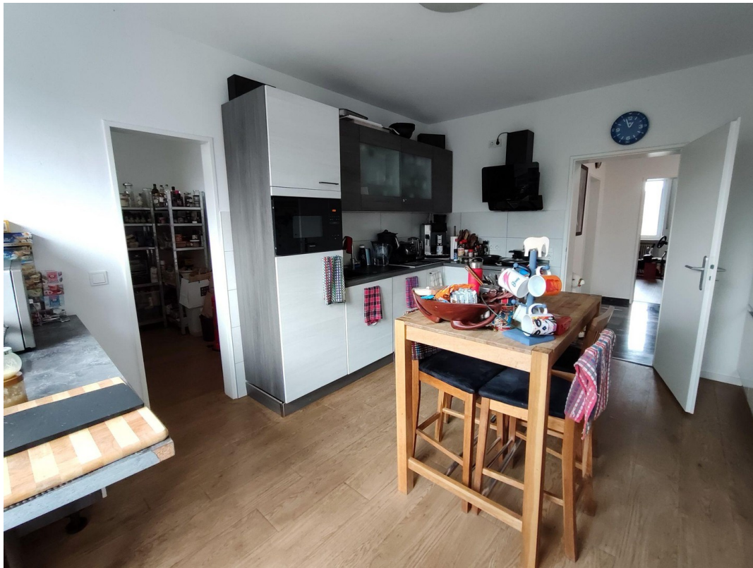
Küche u. Speisekammer