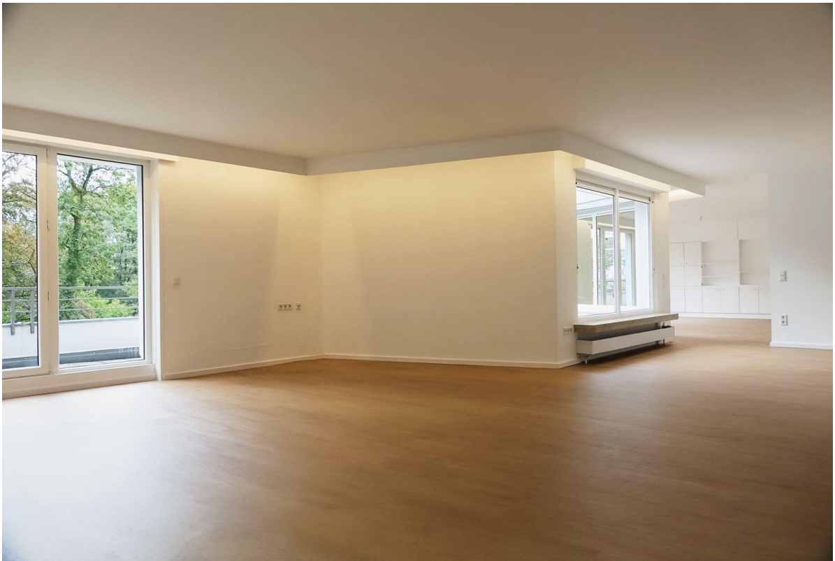
Wohnzimmer Blick aufs Esszimmer