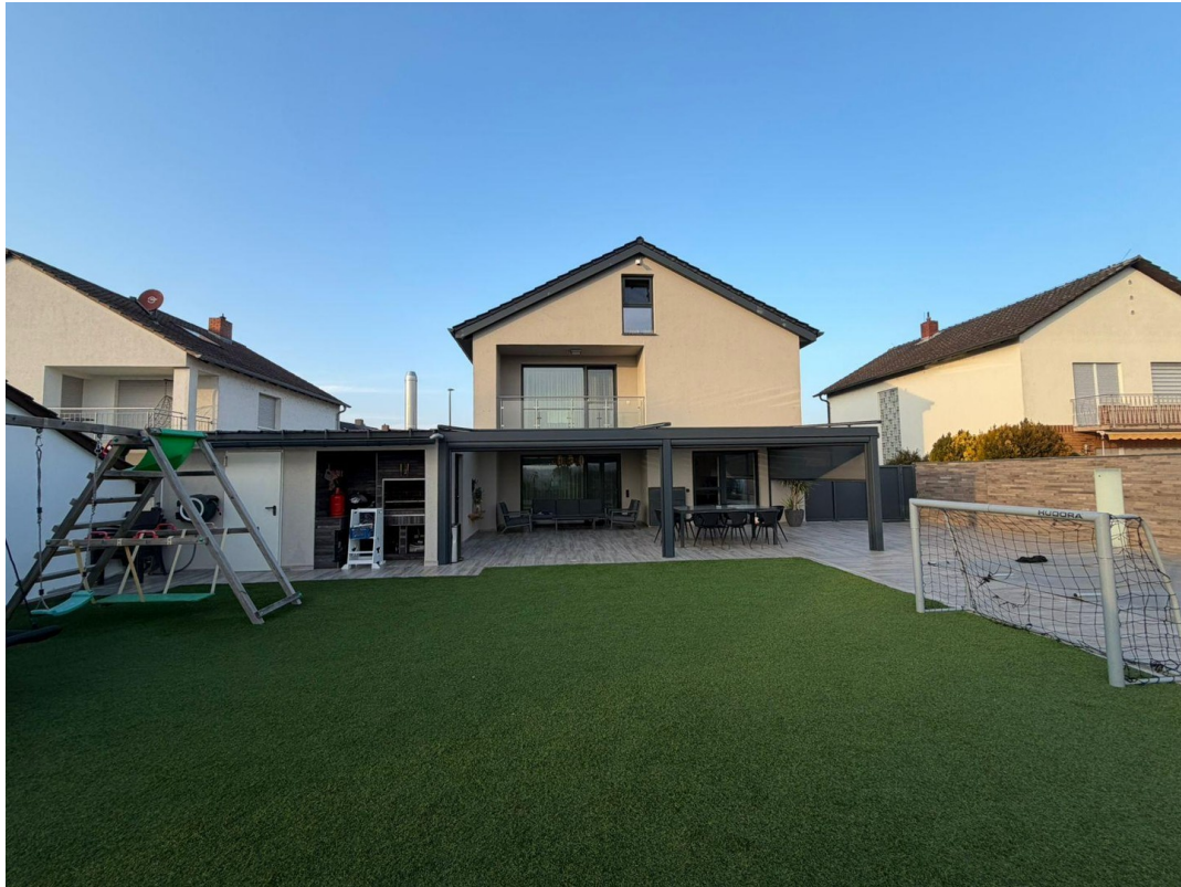
Hausansicht bei Tageslicht