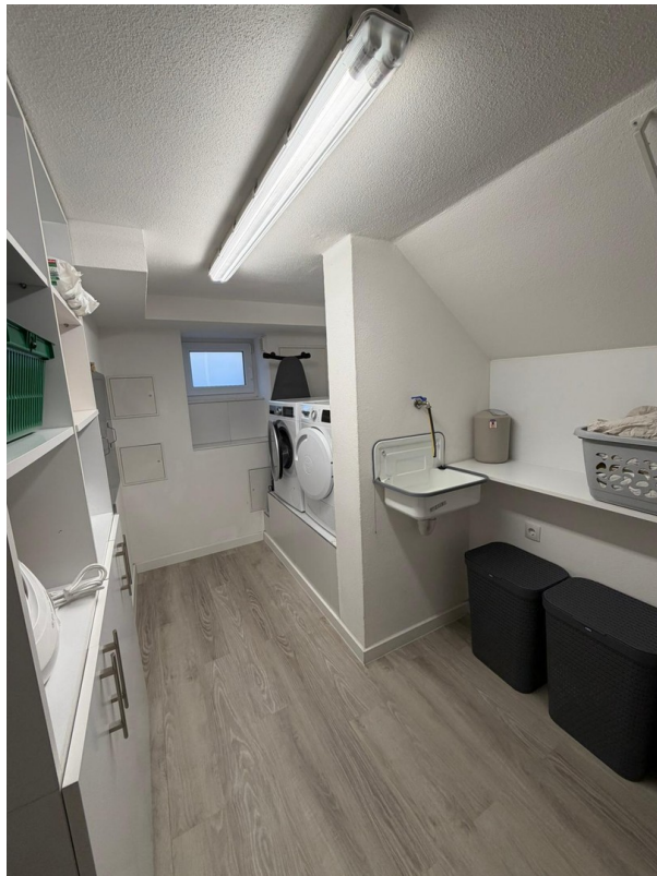
Moderne Hauswirtschaft mit vie