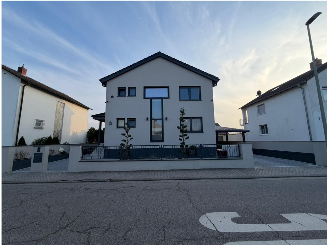
Straßenansicht der Immobilie