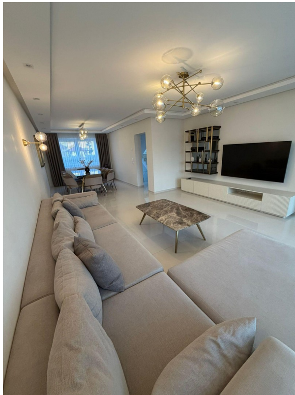
Wohnzimmer mit viel Tageslicht