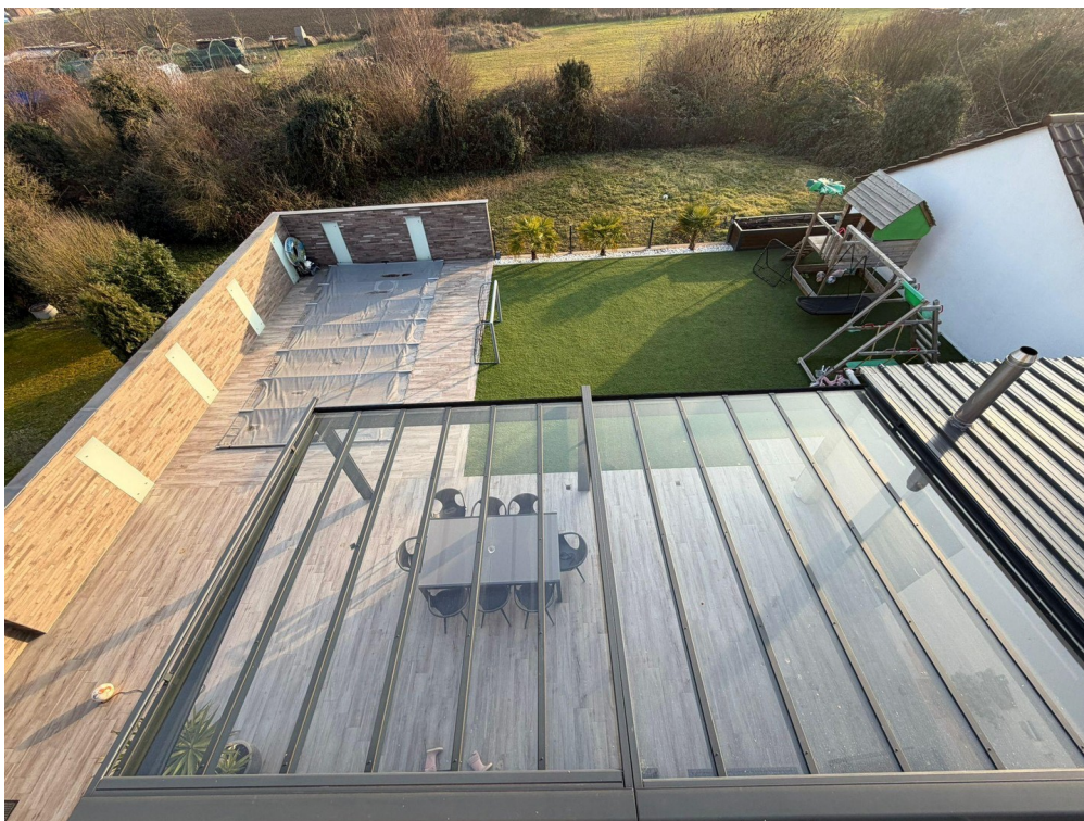
Balkon mit Ausblick