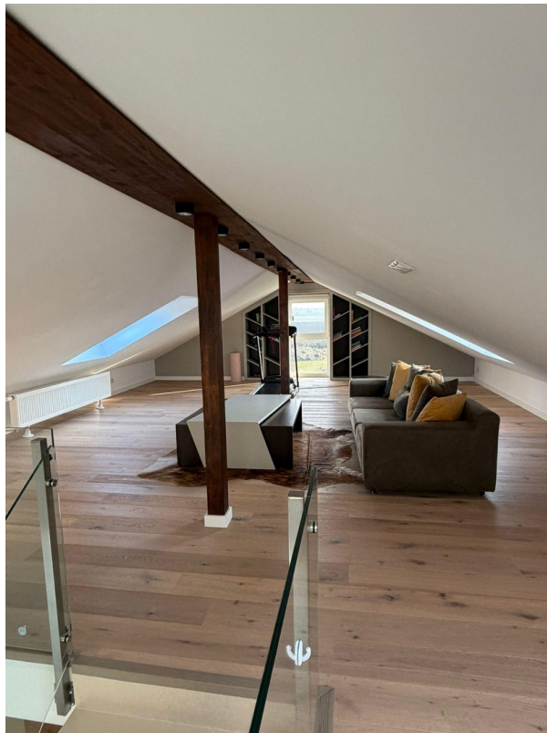
Dachgeschossraum mit gemütlich