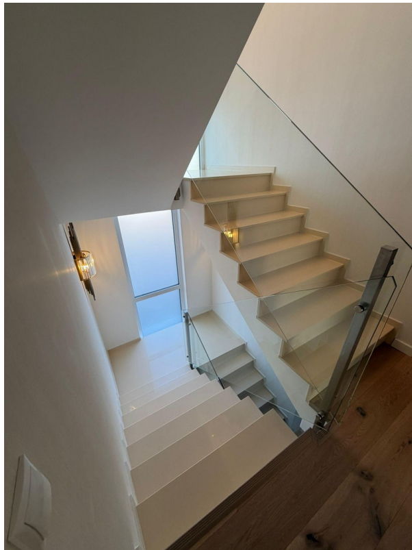
Helle Treppe mit offenem Desig