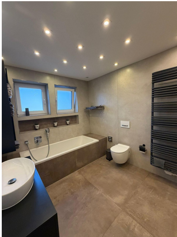
Badezimmer mit Dusche/Badewann