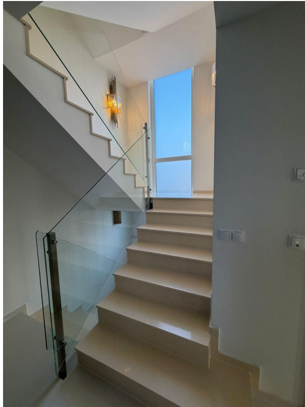
Helle Treppe mit offenem Desig