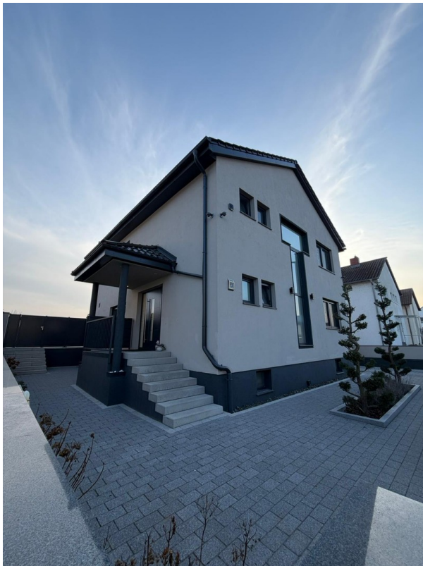
Straßenansicht der Immobilie