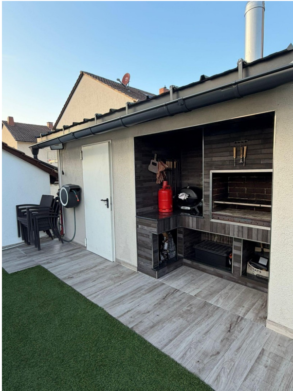
Grillplatz im Garten