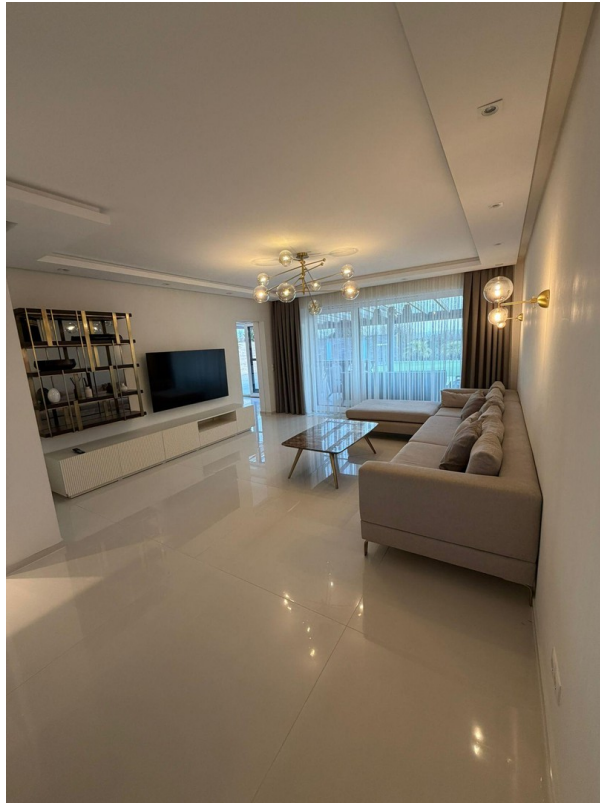
Wohnzimmer mit viel Tageslicht