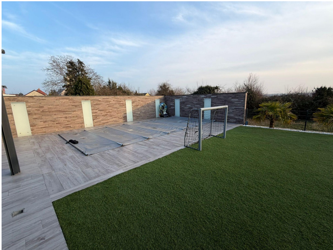
Exklusiver Garten- und Poolber