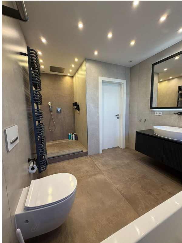
Badezimmer mit Dusche/Badewann