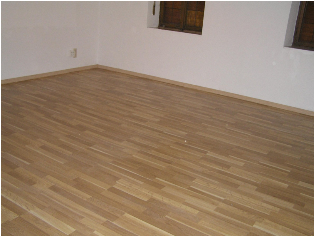
1.OG großes Zimmer