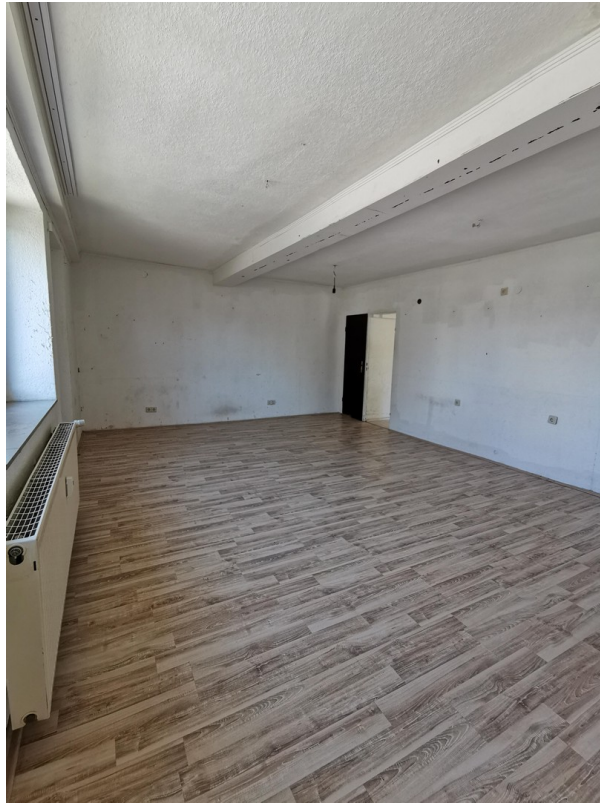
EG großes Zimmer