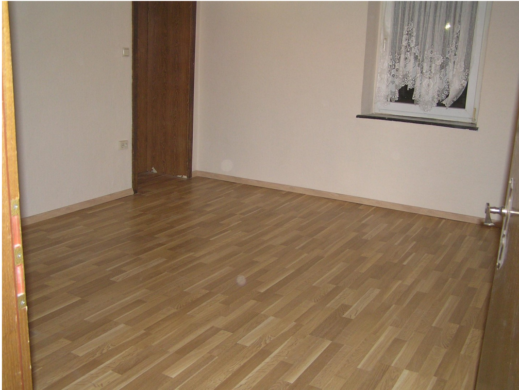
1.OG kleineres Zimmer