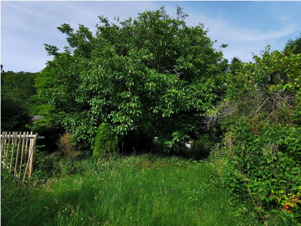
Nussbaum im Garten