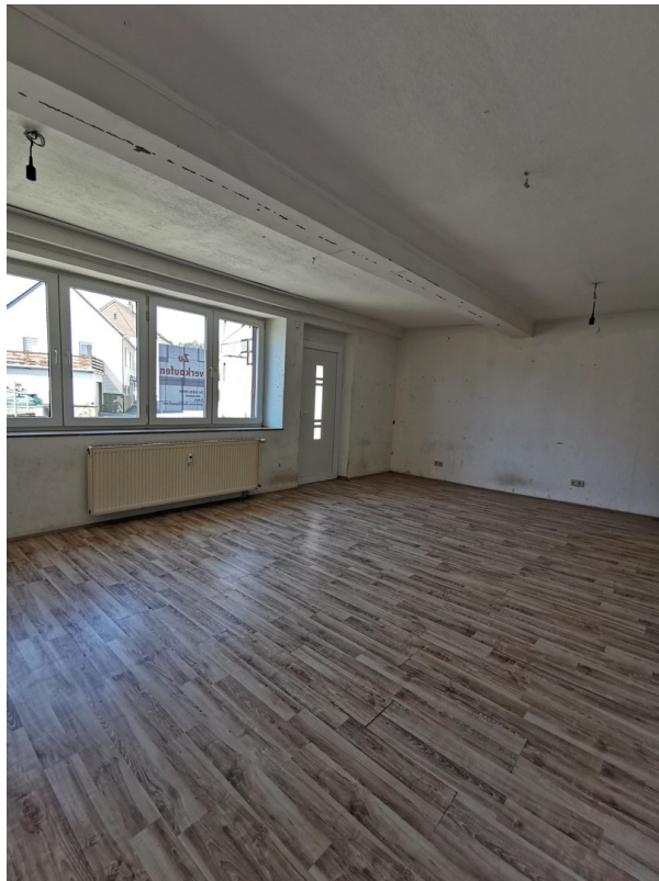
EG großes Zimmer