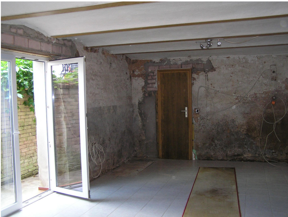
großer Raum in Scheune