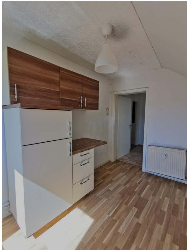
2. OG Küche