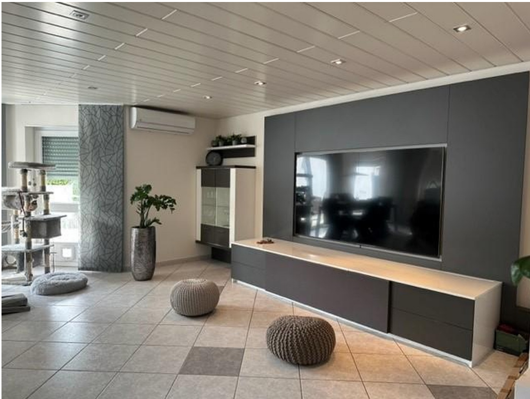
Wohn-/Esszimmer (jetzt leer)