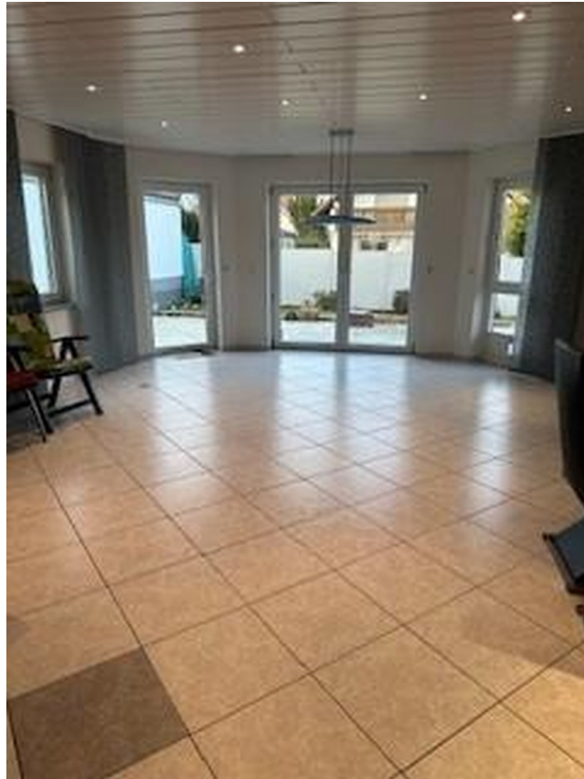
Wohn-/Esszimmer (Erker) 42 qm