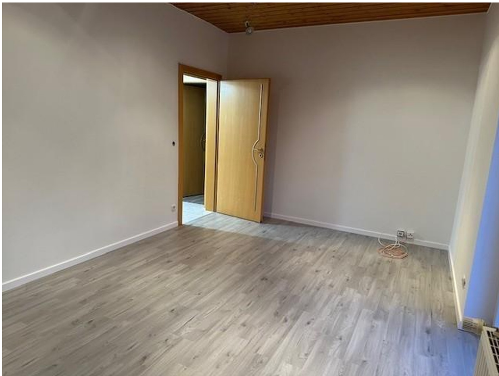
3. Schlafzimmer OG