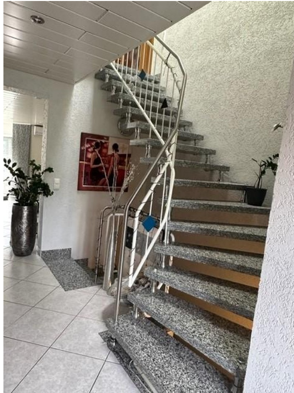
Granittreppe in OG