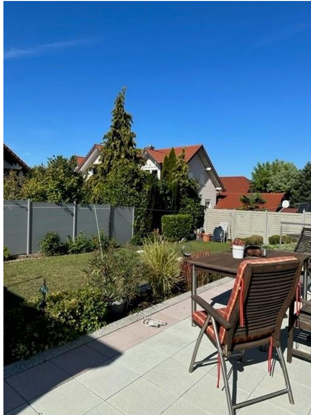
Terrasse / Ansicht Garten