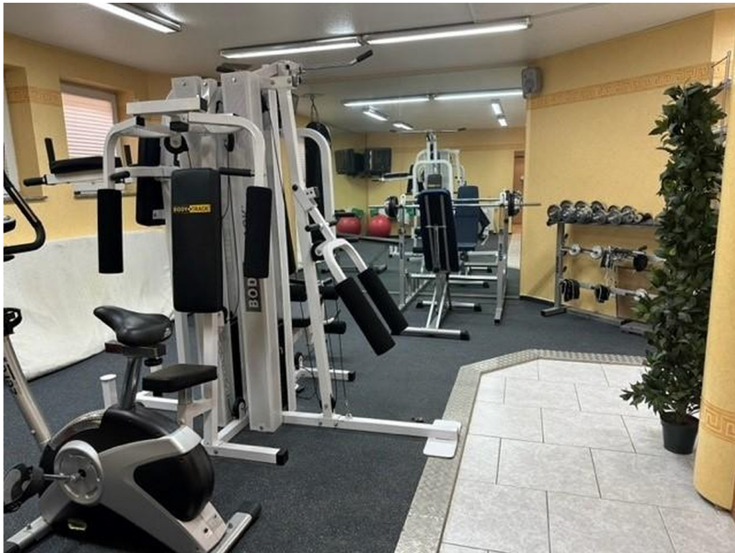
Ruhe-/Lagerraum (ohne Geräte)