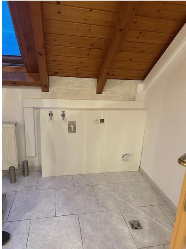
Hauswirt. Raum Anschlüsse