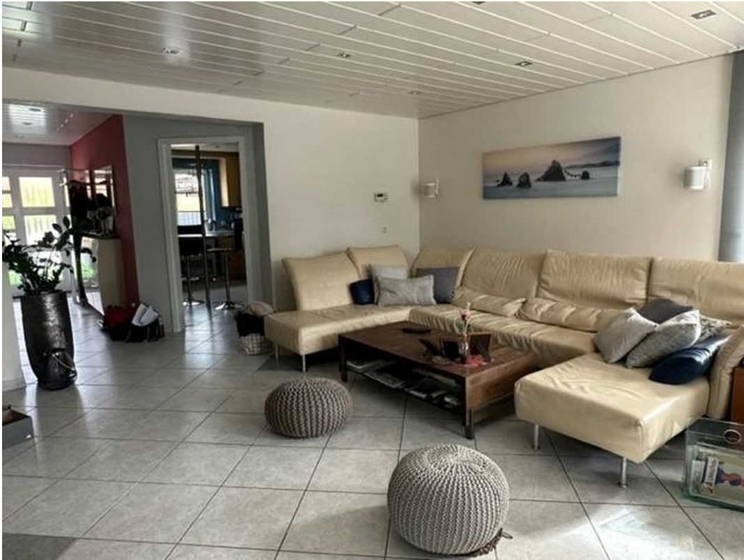
Wohn-/Esszimmer (jetzt leer)