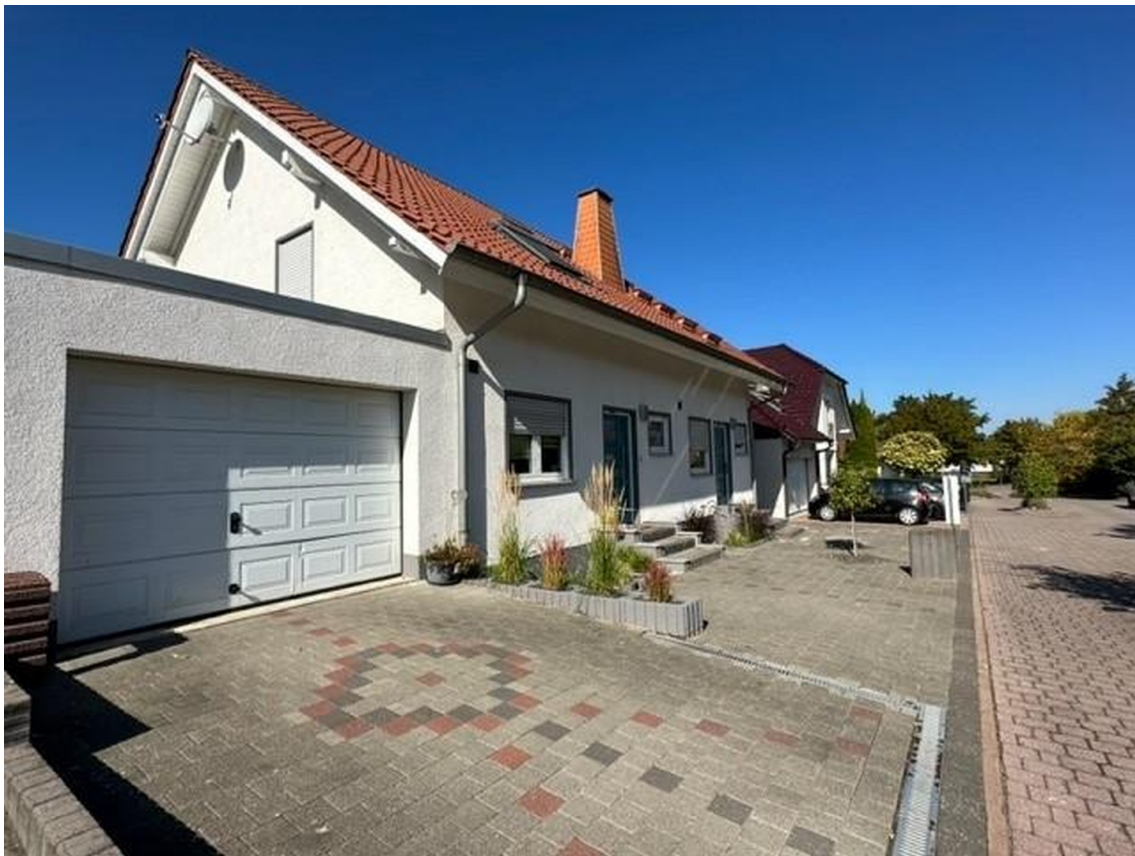
Garage / Sicht Haus links