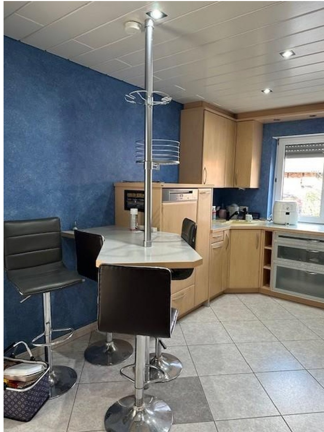
Küche linkss. mit Theke