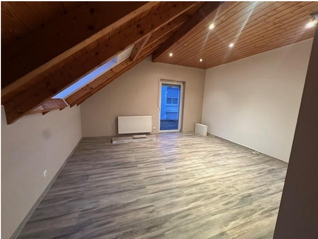
1. Schlafzimmer OG