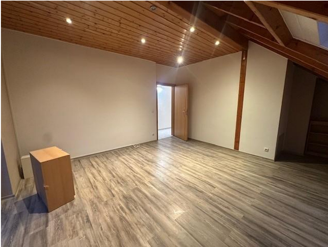
1. Schlafzimmer OG