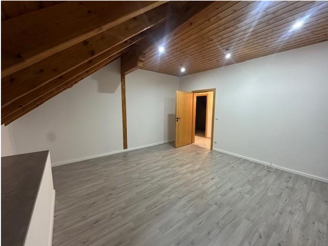
2. Schlafzimmer OG