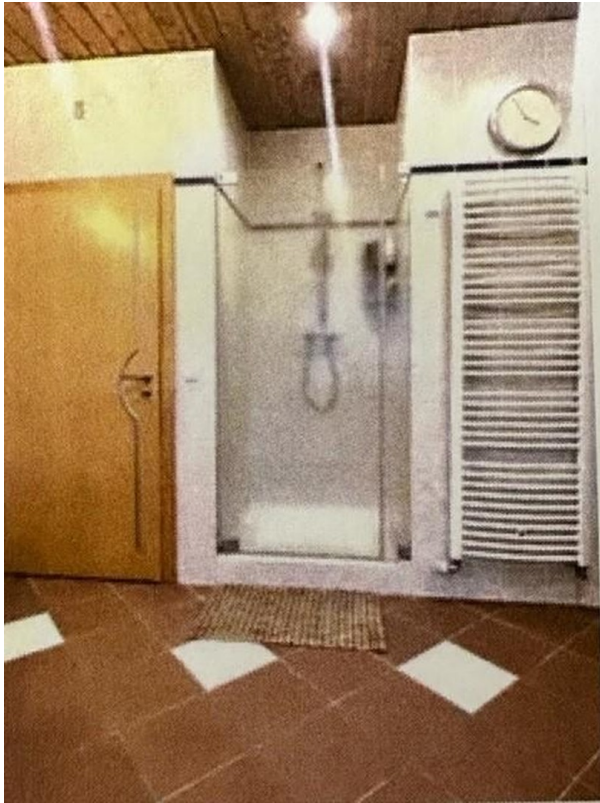
Dusche mit Glastür