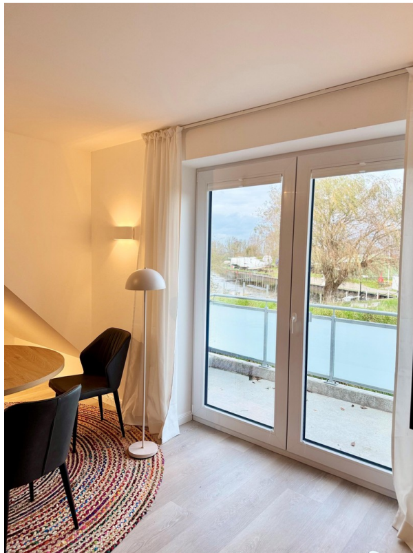
Ausblick 1. OG