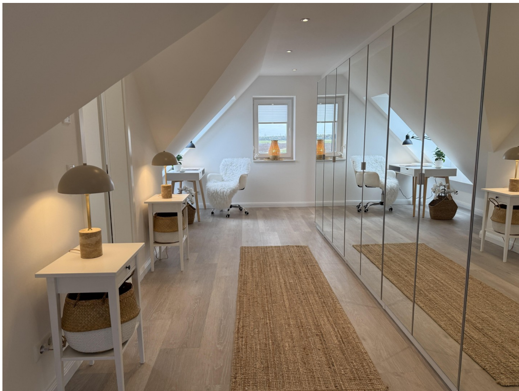
großer Flur DG