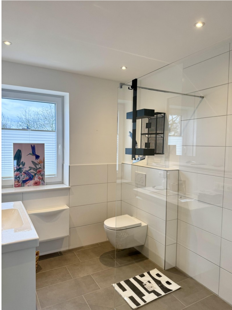
Badezimmer 1. OG