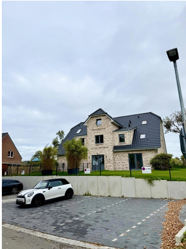
Außenbereich + Parkplatz