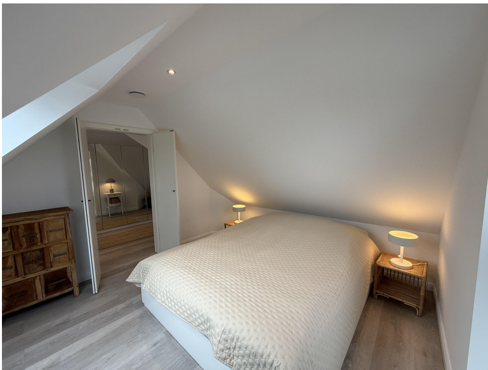
Schlafzimmer Doppelbett DG