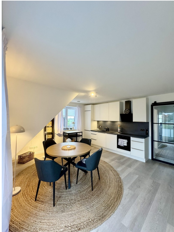
Küche 1. OG