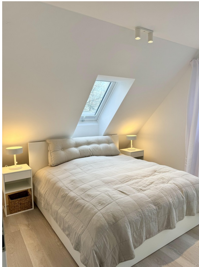
Schlafzimmer 1. OG