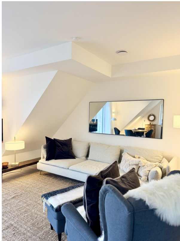
Wohnzimmer 1. OG