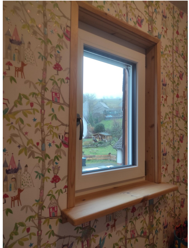
Holzlaibungen Kind 2