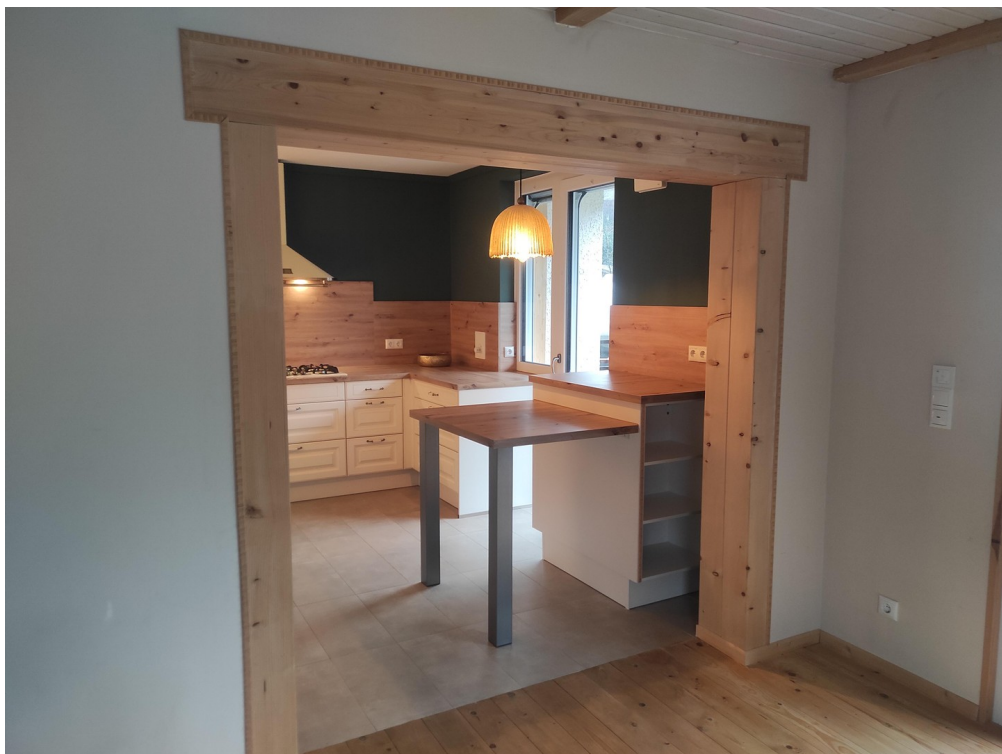
Durchgang Esszimmer Küche