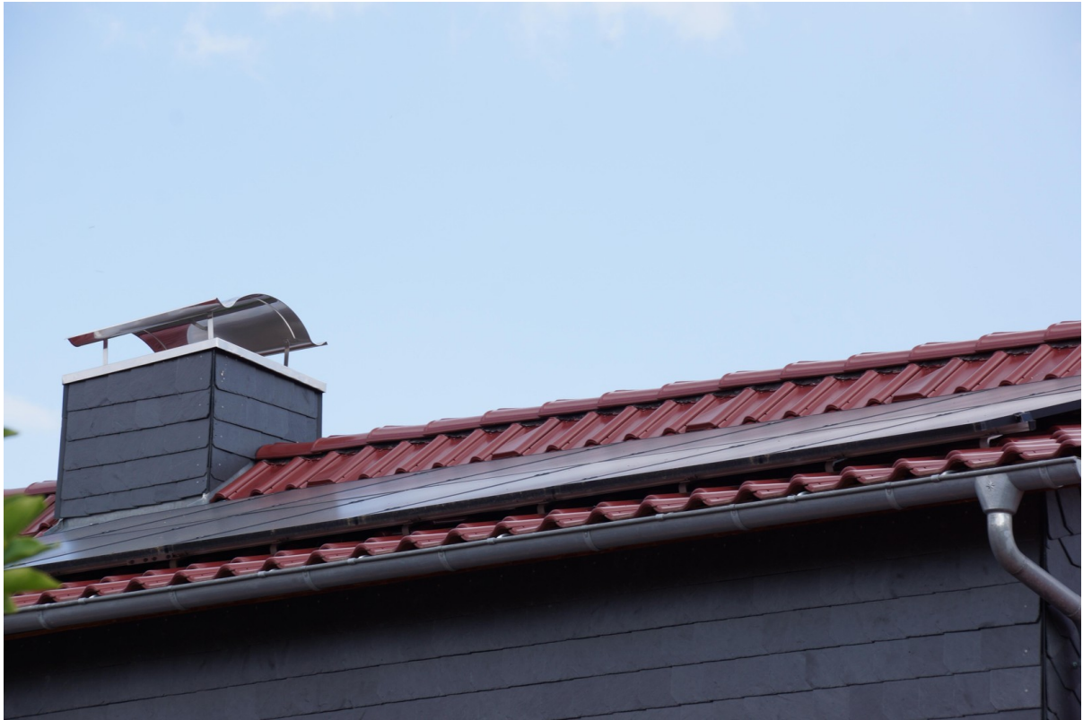
Dach mit Photovoltaik