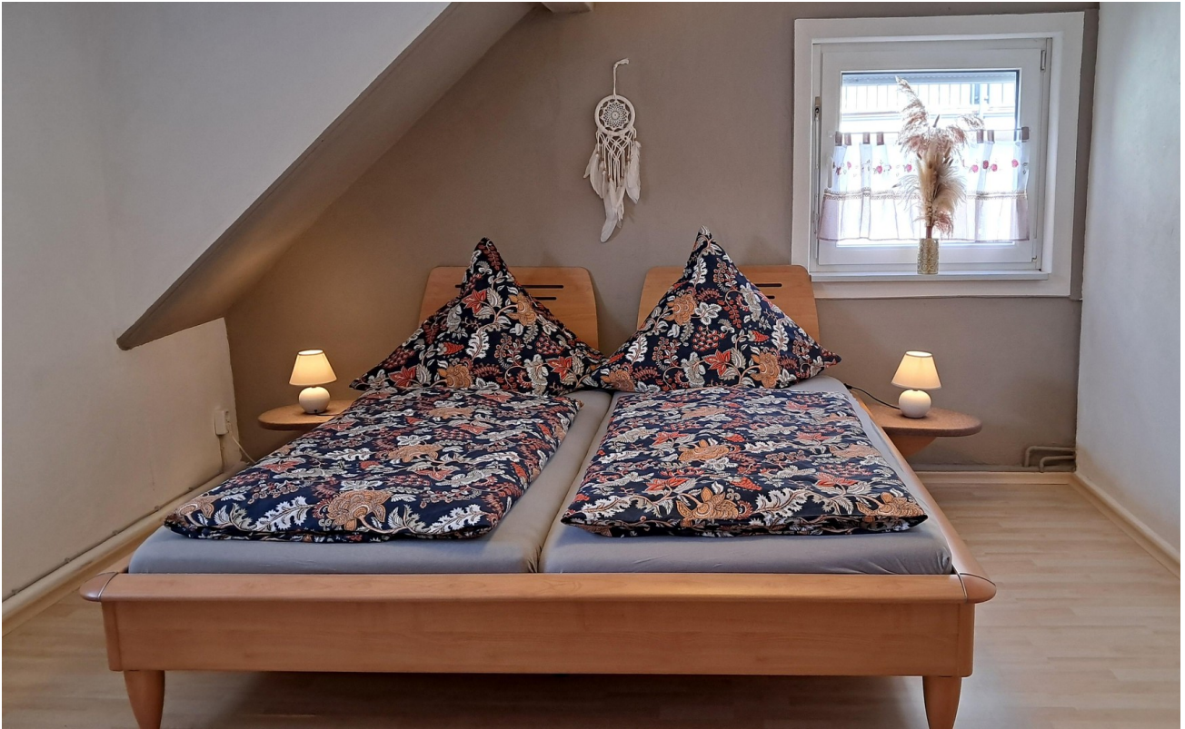
Schlafzimmer OG hinten