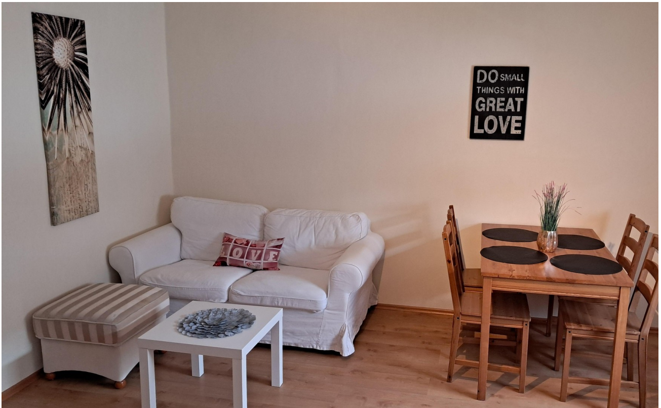
Küche EG hinten