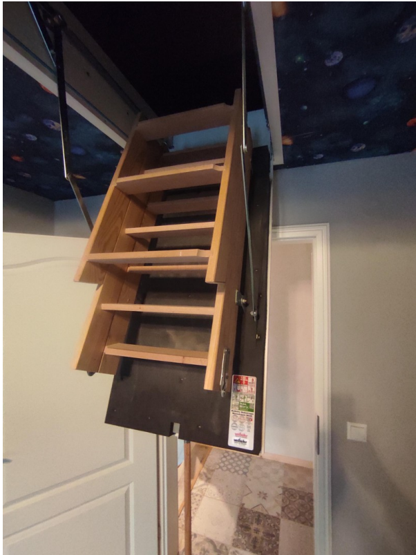
Aufgang zum Dachboden