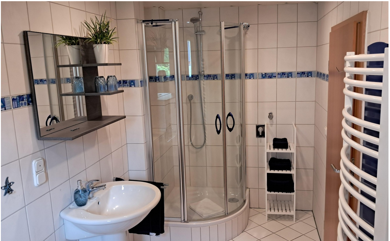
Bad EG hinten