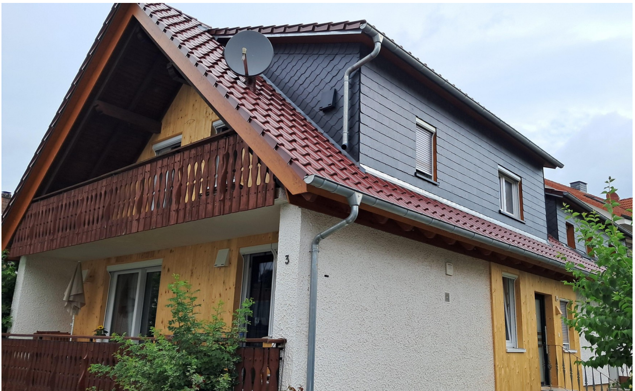
Gaube vorne und hinten