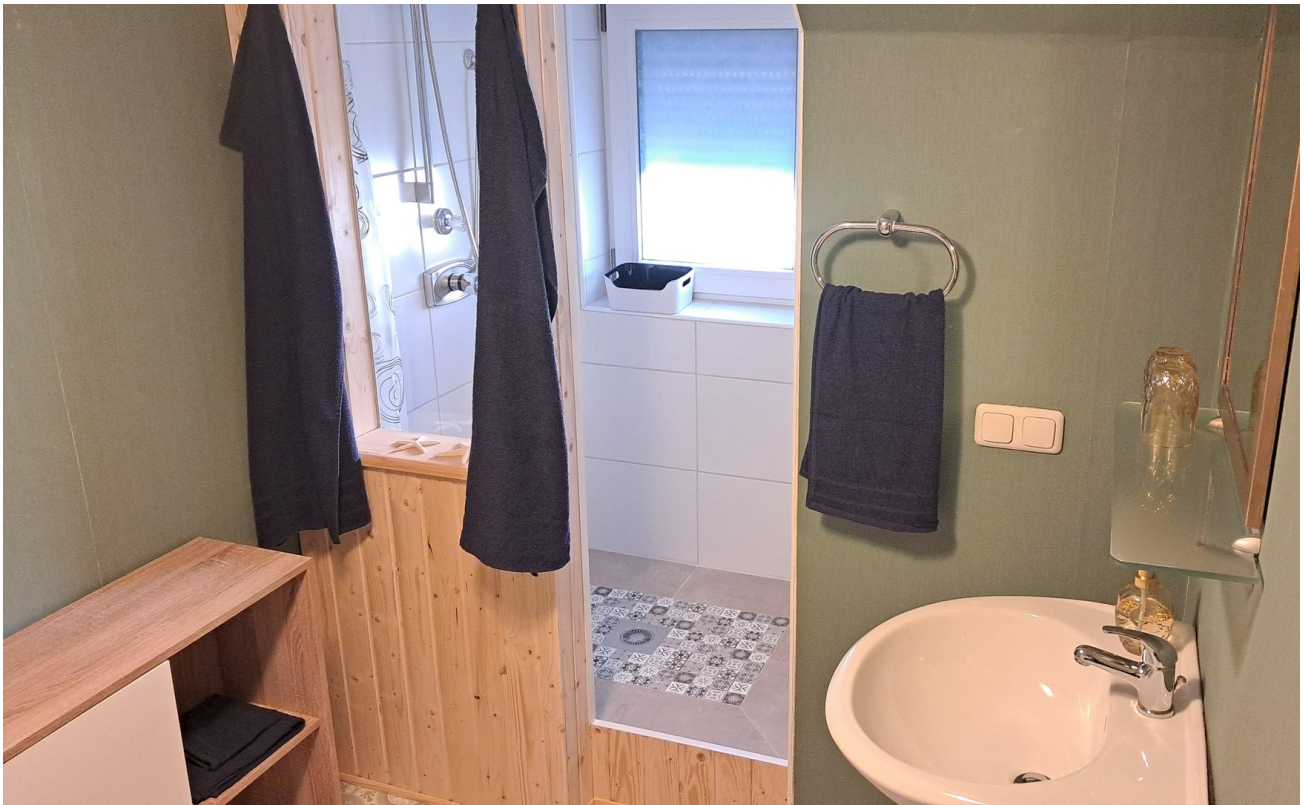
Bad OG hinten