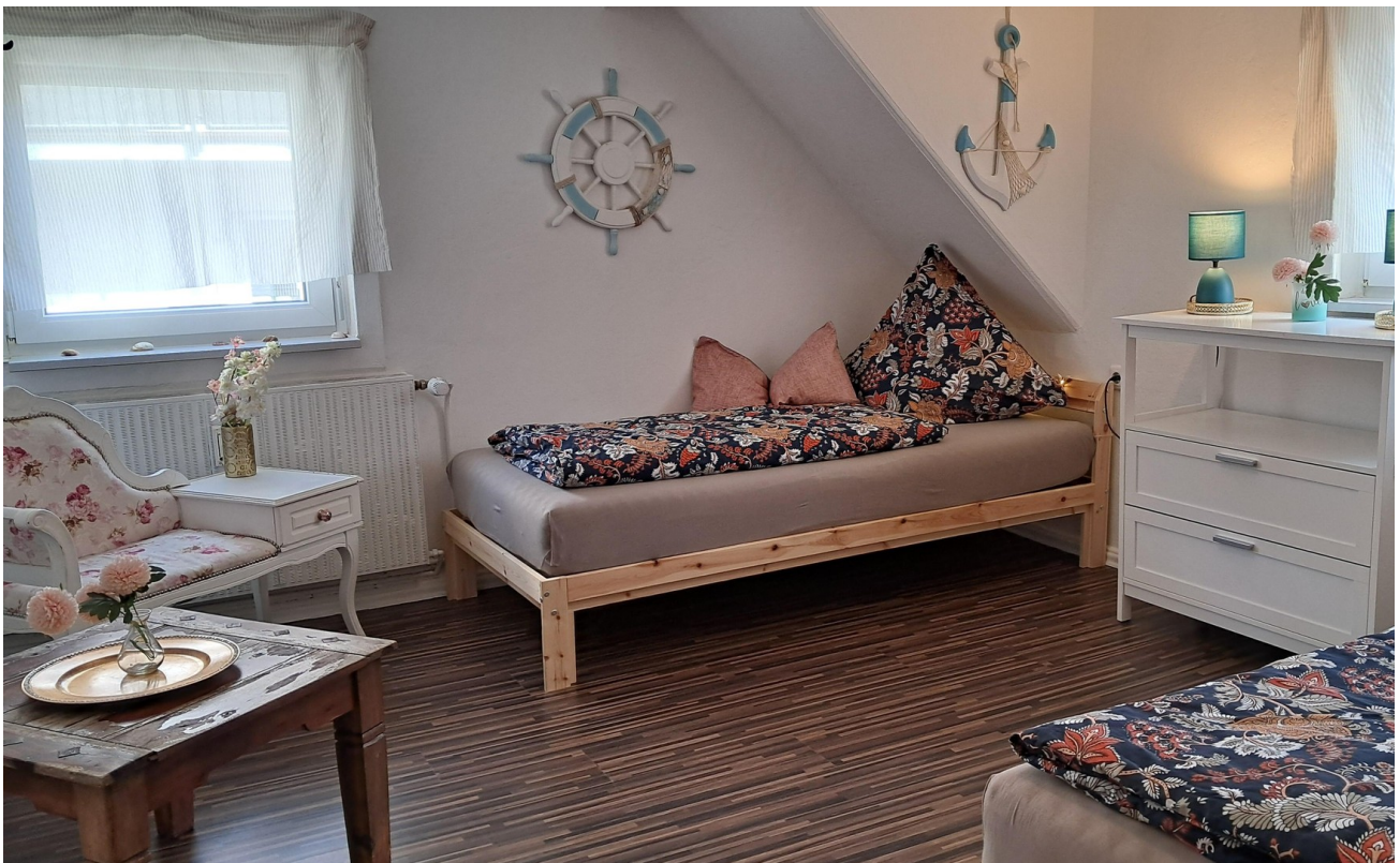
Hinterzimmer OG hinten