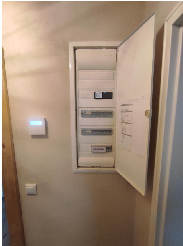
Flur neue Verteilung