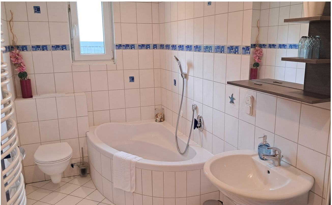
Bad EG hinten