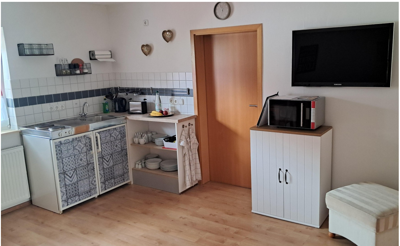
Küche EG hinten