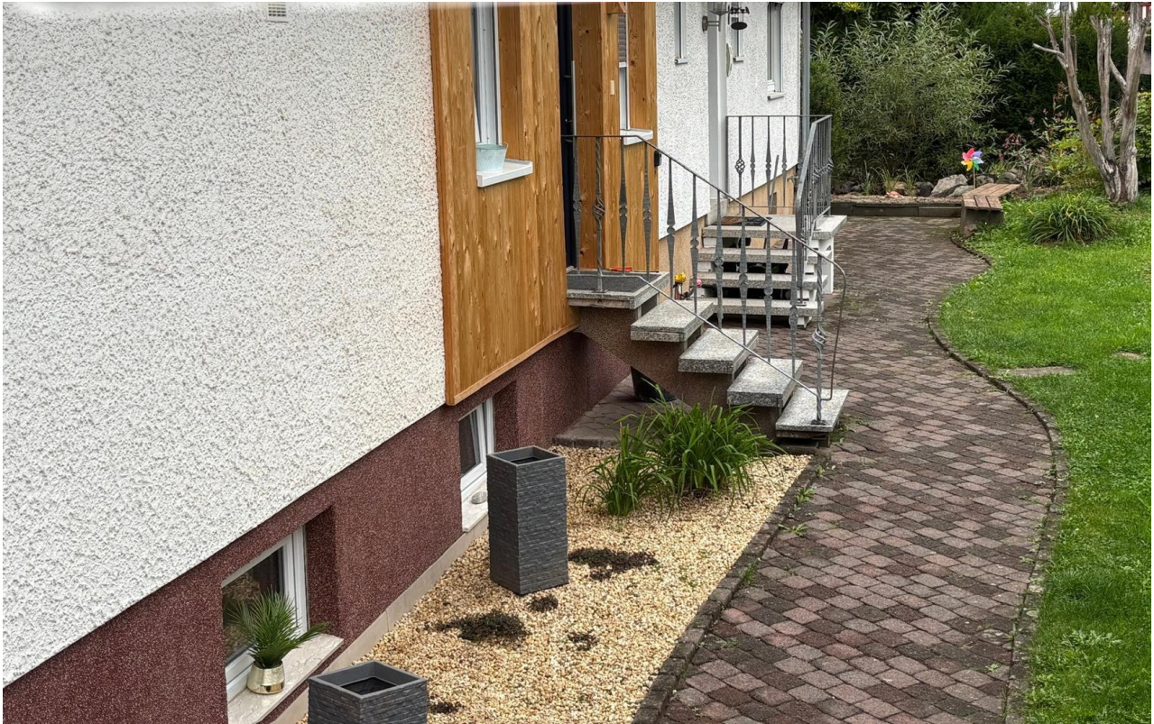
Weg zu den Eingängen