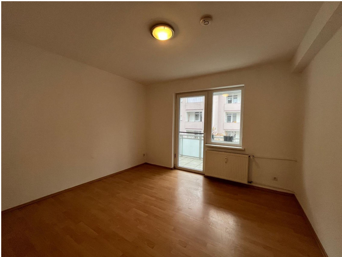
Zimmer 2 mit Zugang zum Balkon