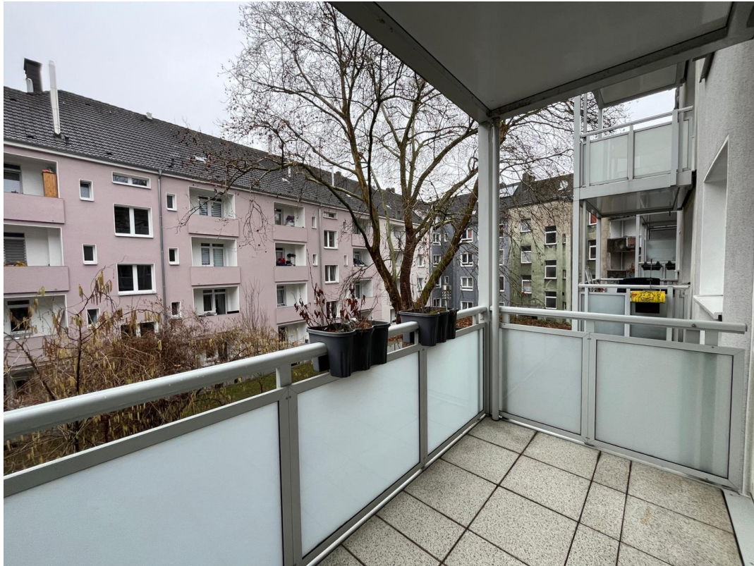
Balkon zum Hinterhof