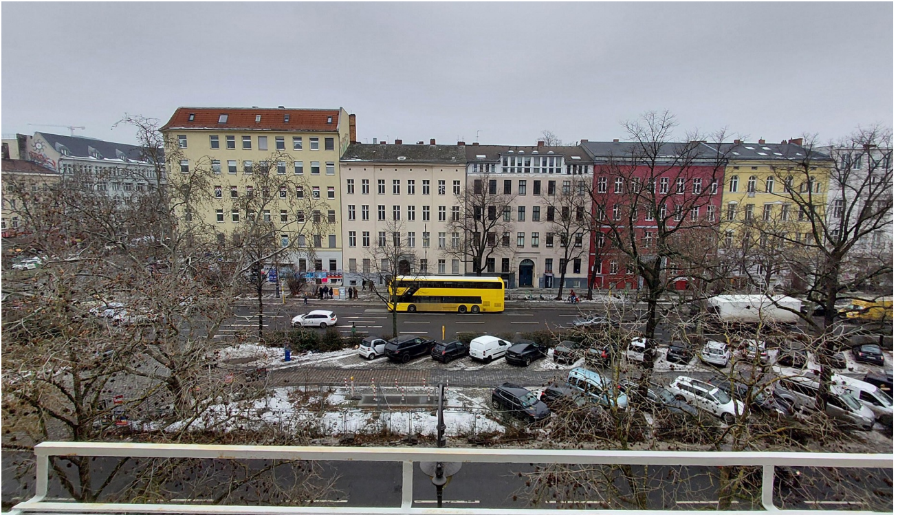
Balkon mit Straßenblick