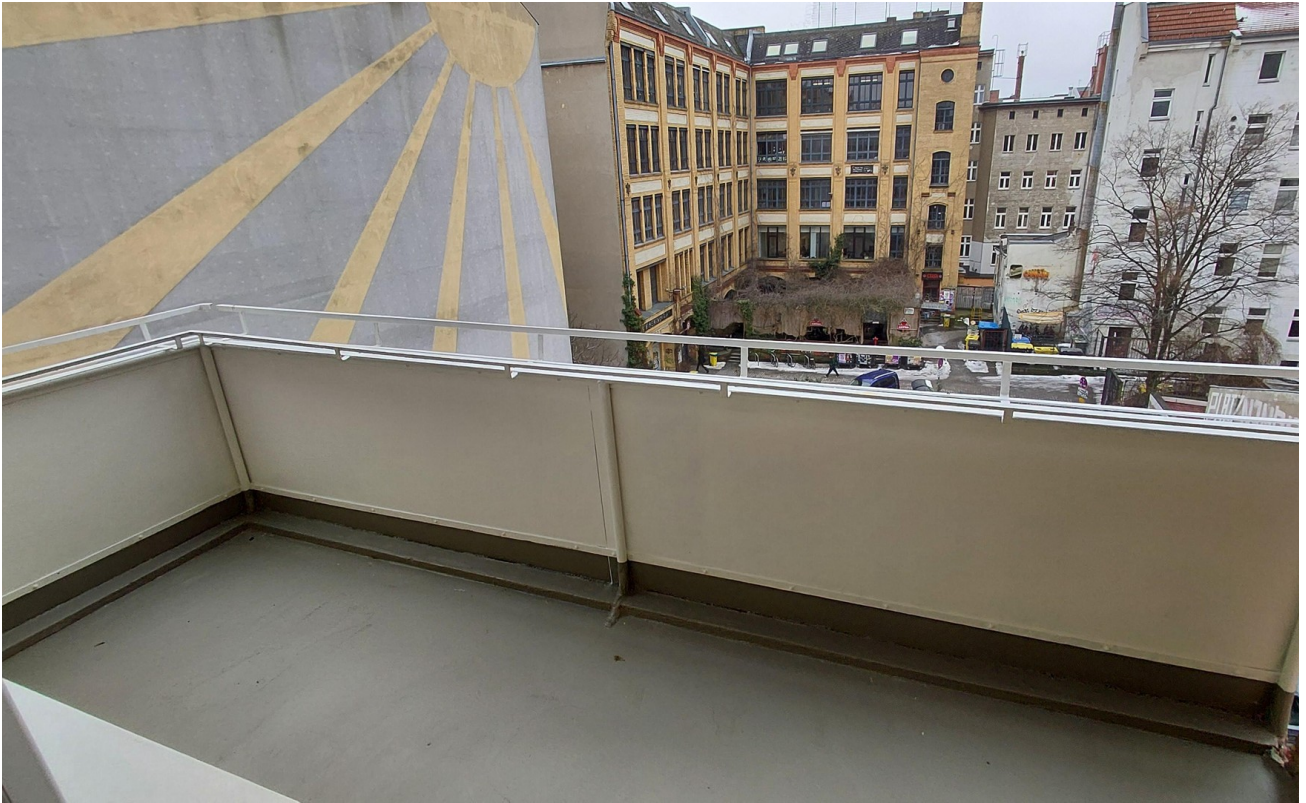
Großer Balkon Rückseite