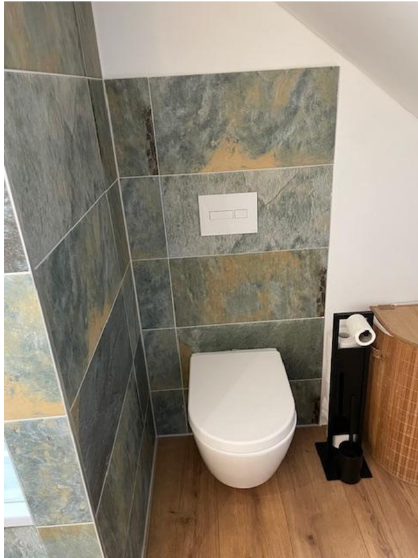
WC Bad DG