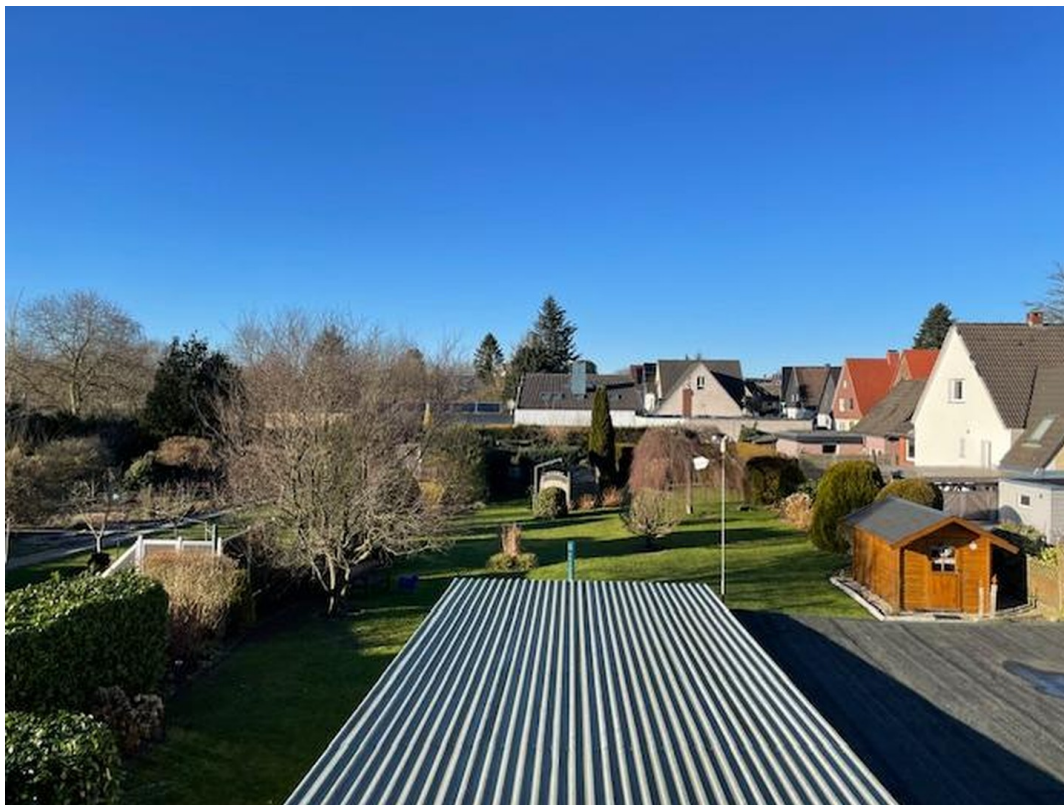
Gartenblick von oben