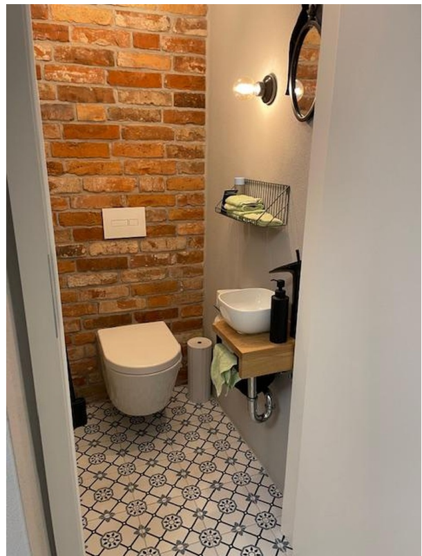
Gäste WC EG