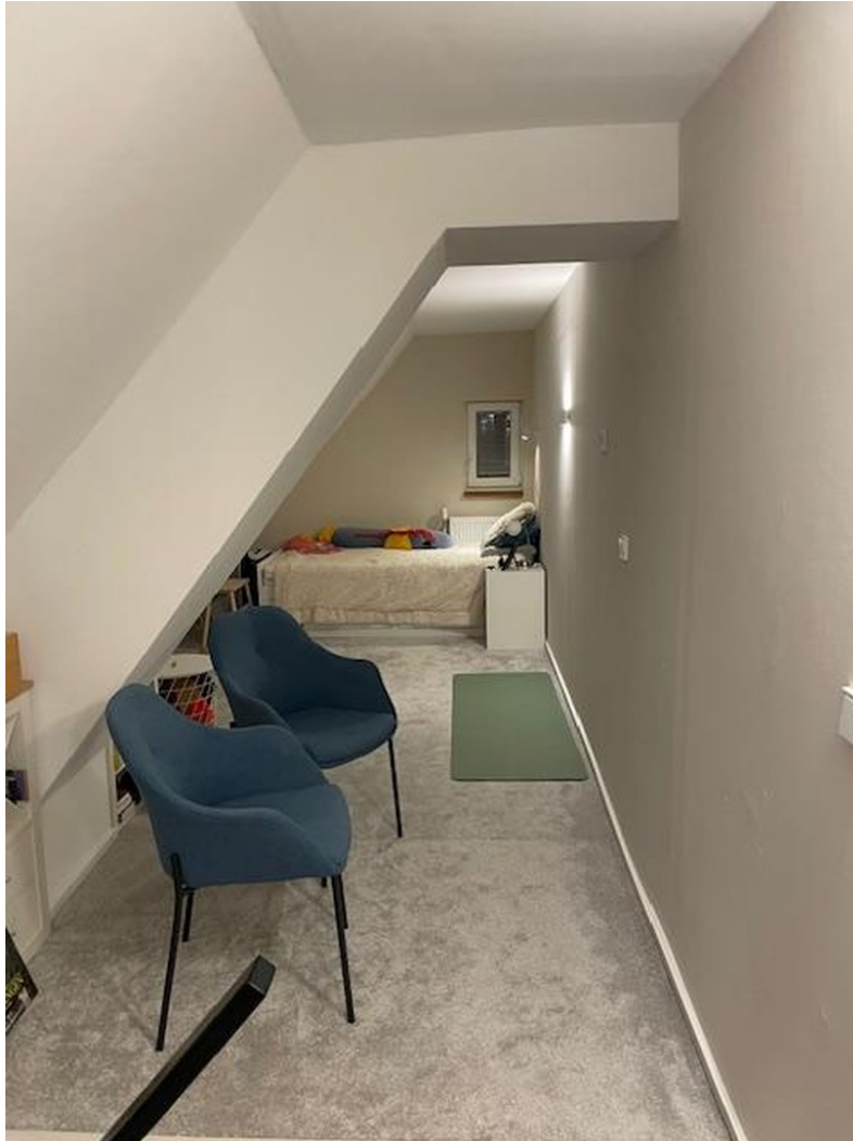
DG 2 Studio