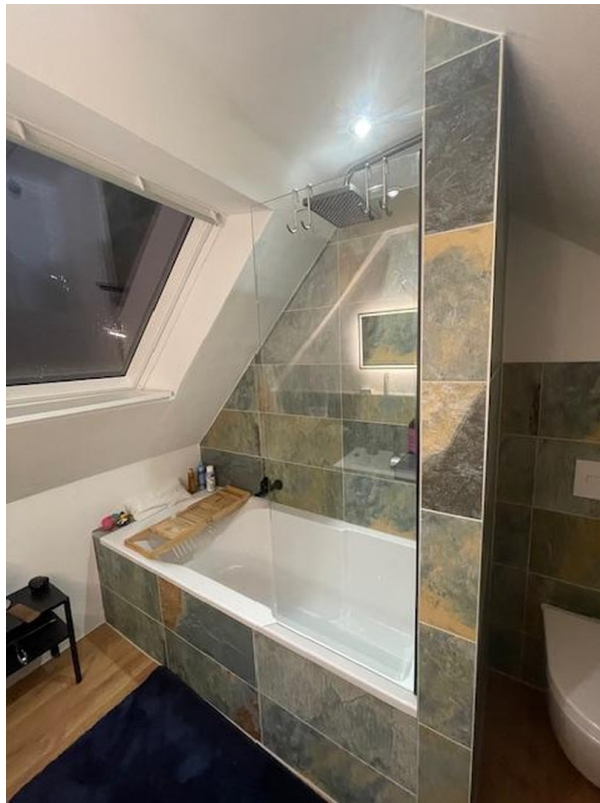
Bad DG mit Badewanne