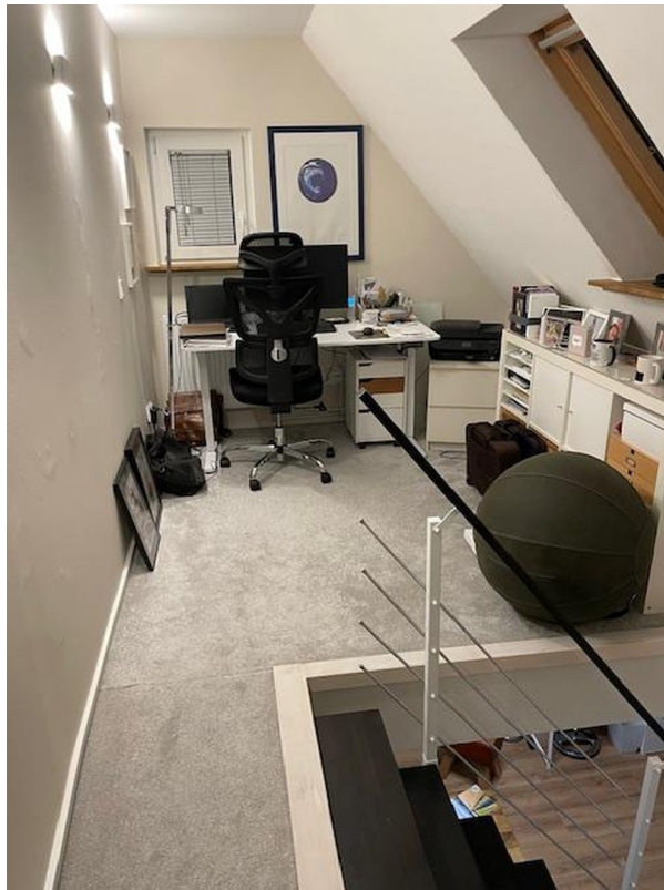
DG 2 Arbeiten