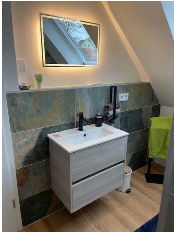
Waschtisch Bad DG