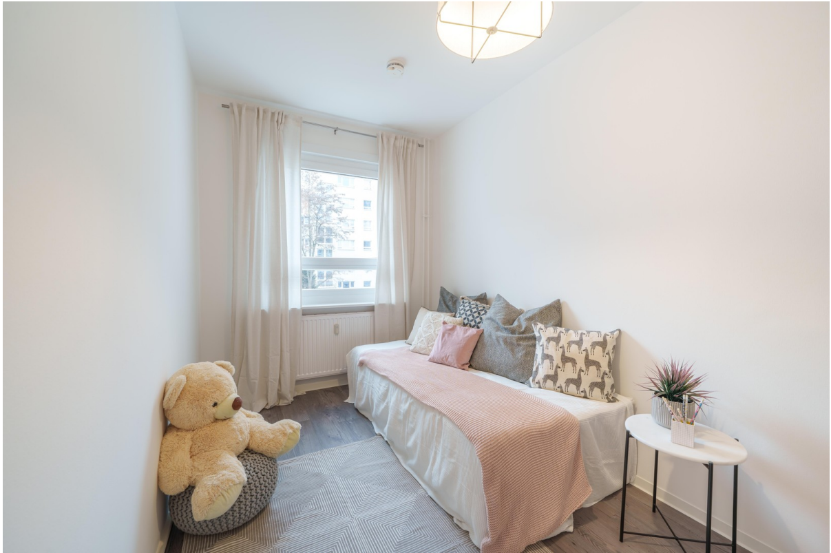
Kinderzimmer oder Büro