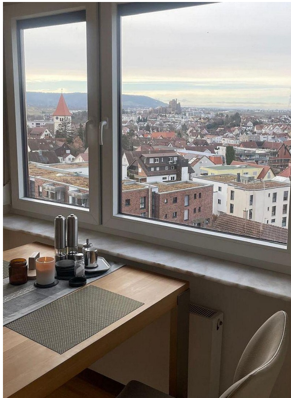
Essplatz - Ausblick Kappelberg