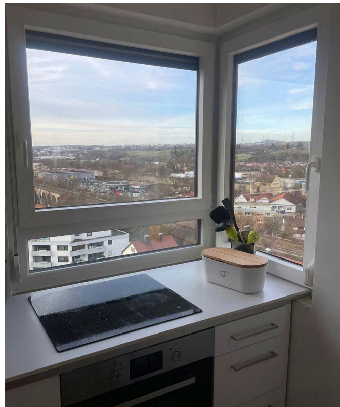
Küche - Ausblick Waiblingen