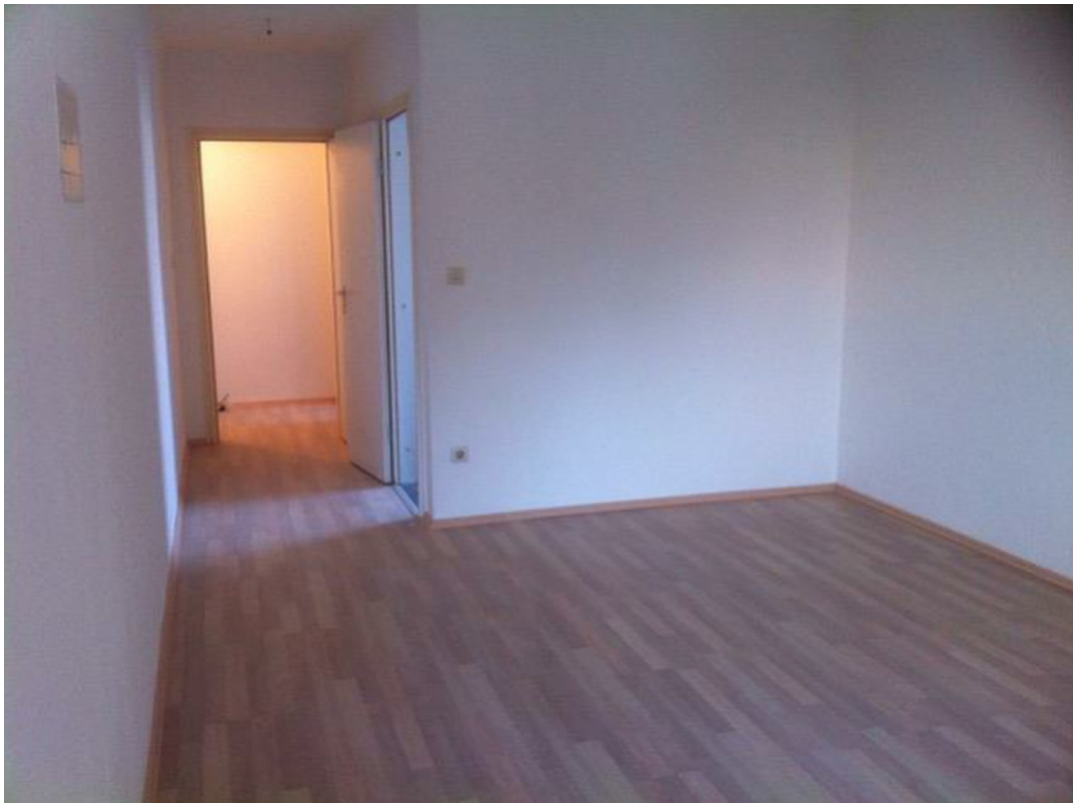
Blick vom Wohnzimmer in den Flu