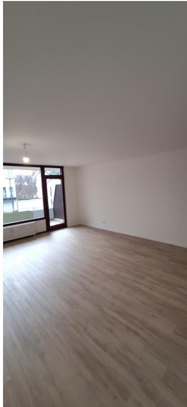
Wohn- und Essbereich 3