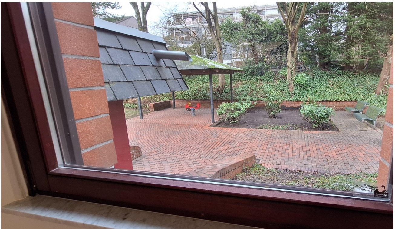
Blick aus der Küche