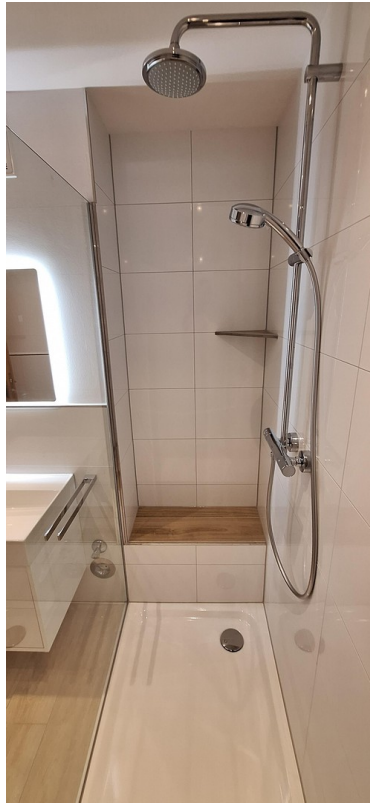
Badezimmer Sitz und Ablage