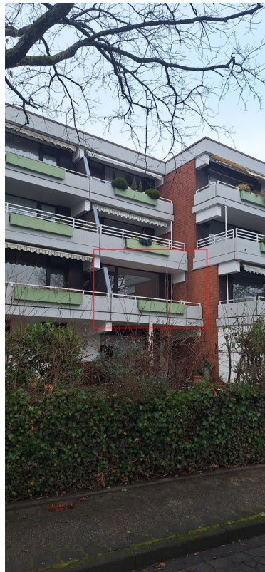
Gebäude außen WHG-Blick