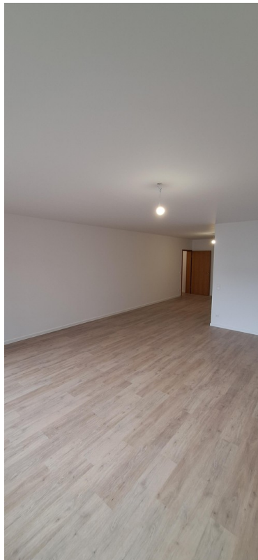
Wohn- und Essbereich 2