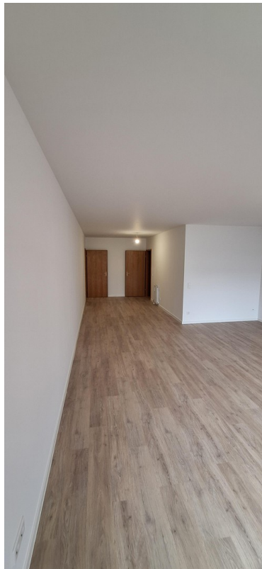
Wohn- und Essbereich 4