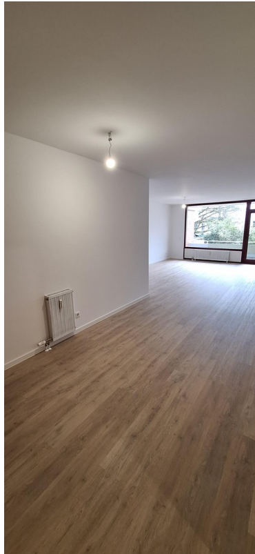
Wohn und Essbereich