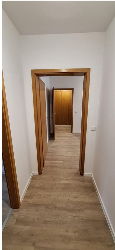
Blick aus dem Eingangsbereich