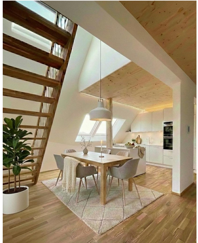
Kochen - Essen