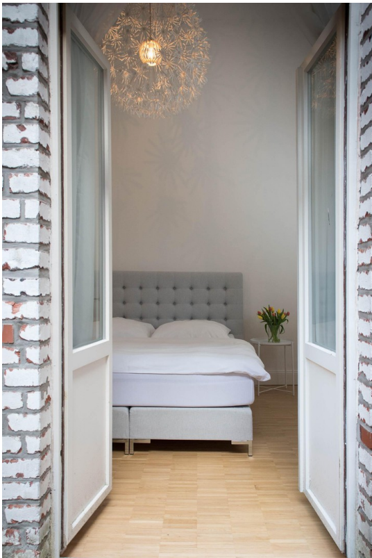
Blick ins Schlafzimmer