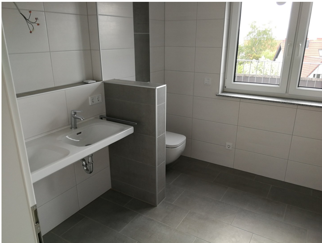
Bad 2. OG