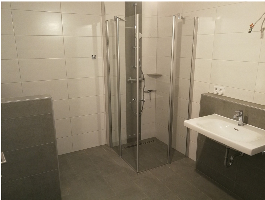
Bad 2. OG