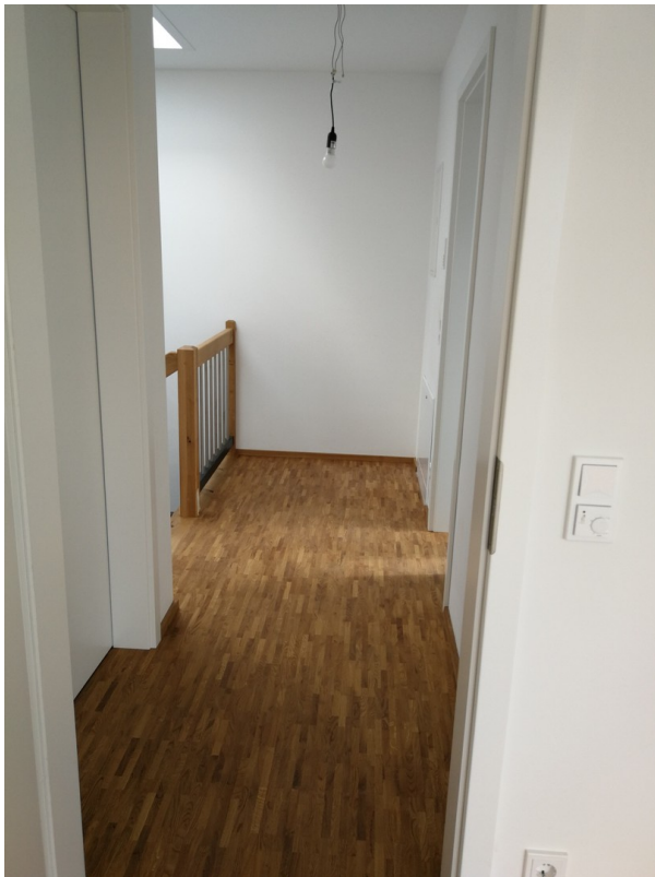
Flur 2. OG