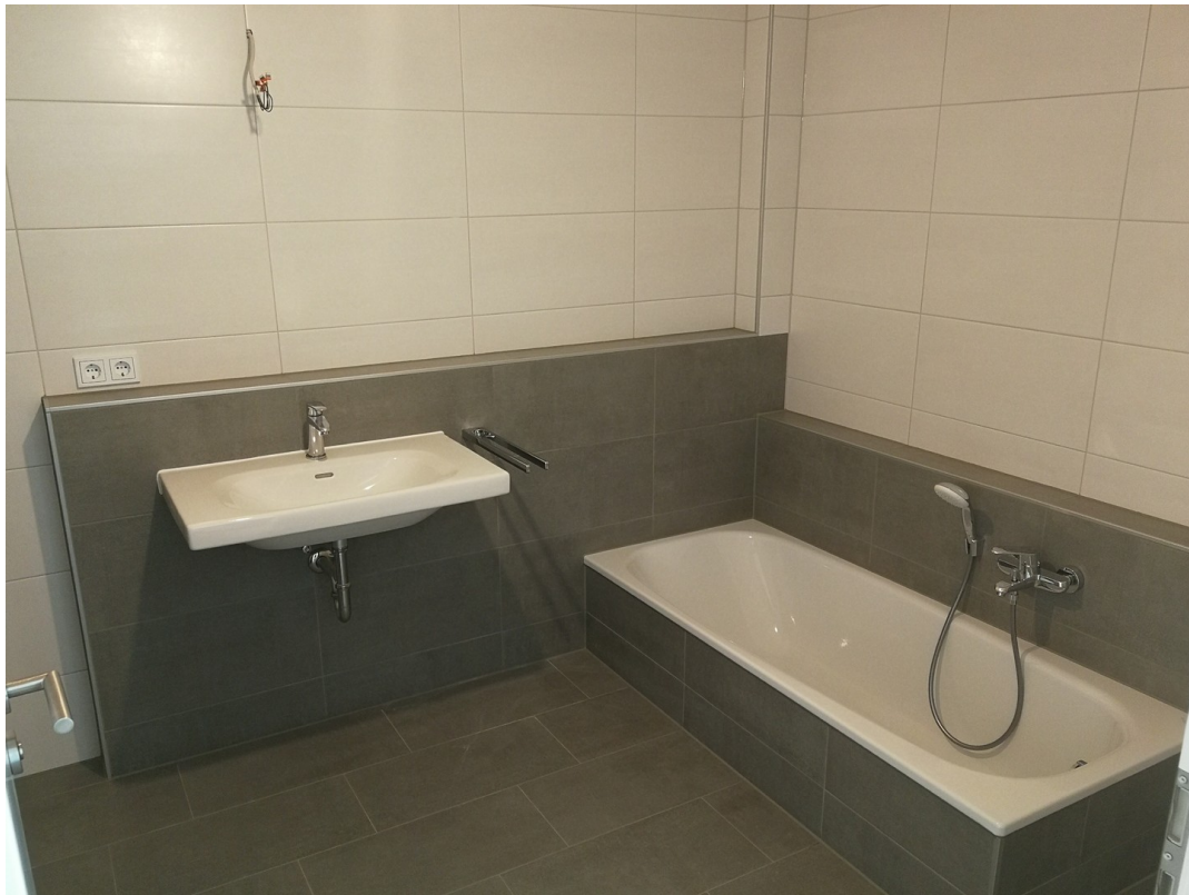
Bad 1. OG