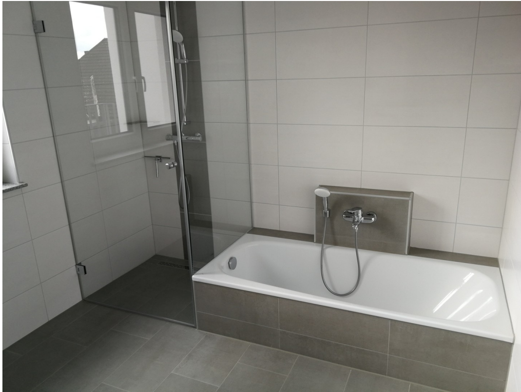
Bad 2. OG