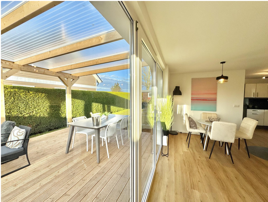
Terrasse und Essbereich