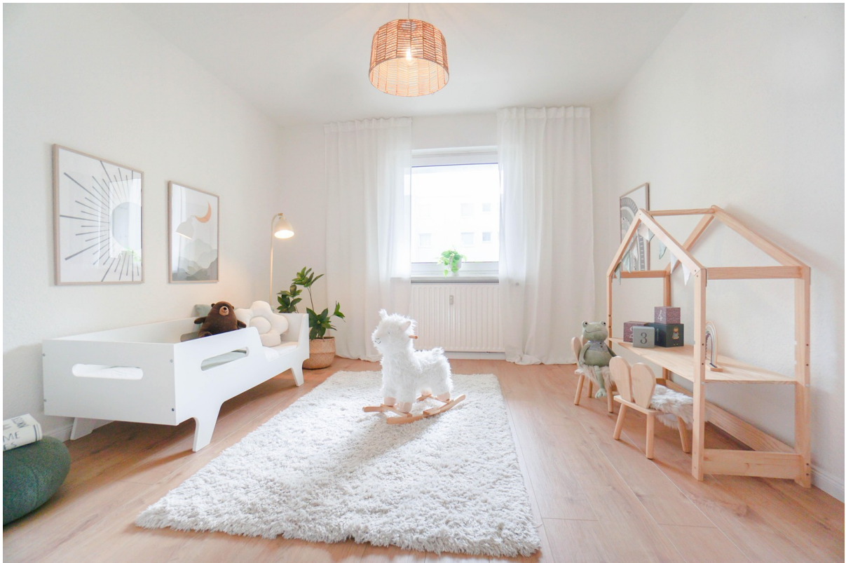
Kind / Gäste / Büro