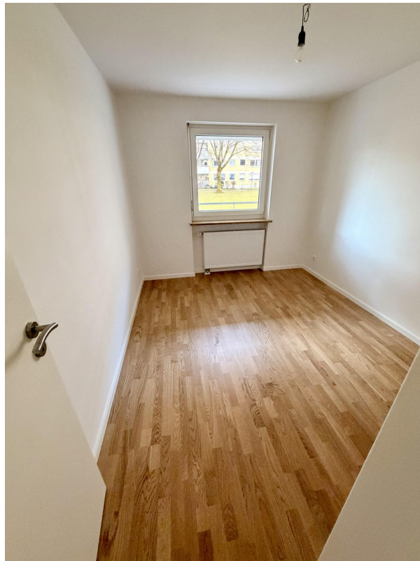
Arbeitszimmer / Kinderzimmer