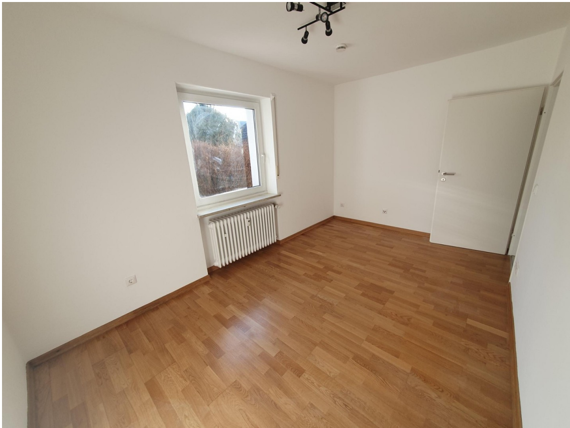
Kinderzimmer / Home Office