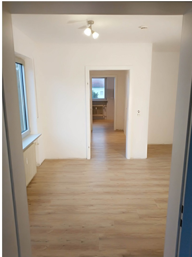
Aus dem Schlafzimmer