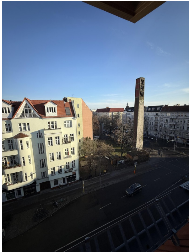
Ausblick auf die Blissestr.