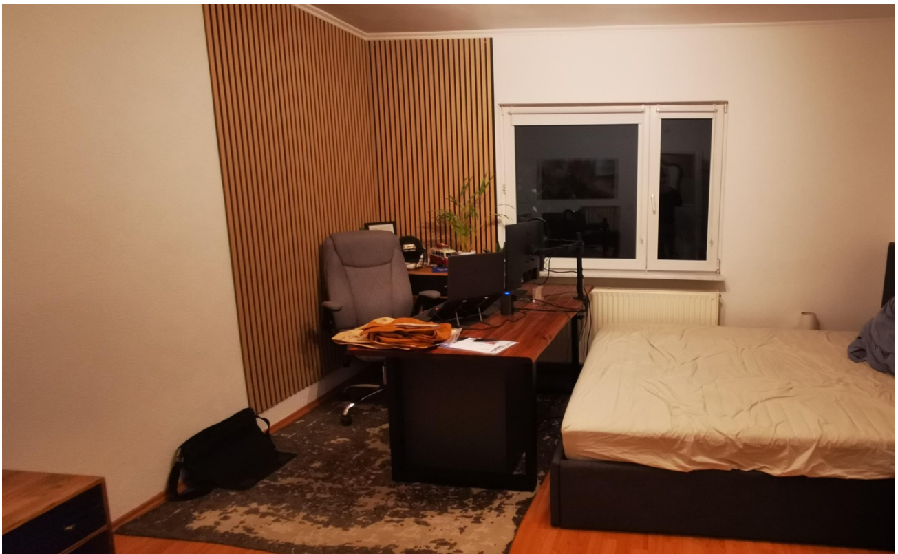
1. Büro EG