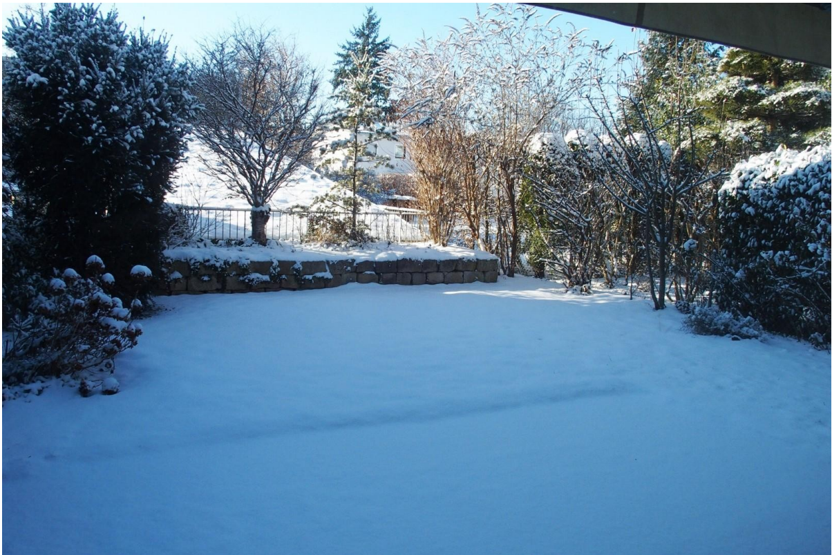
Garten - Blick von Wohnzimmer