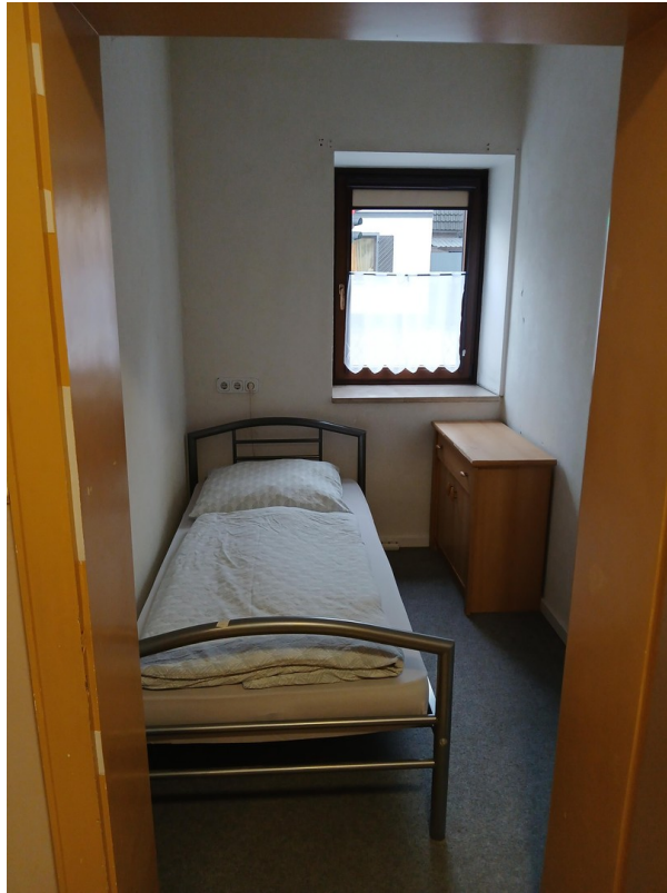
kleines Reservezimmer -Gast