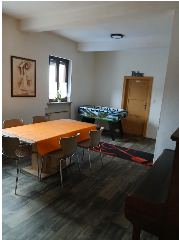
Wohnzimmer / Aufenthaltszimmer