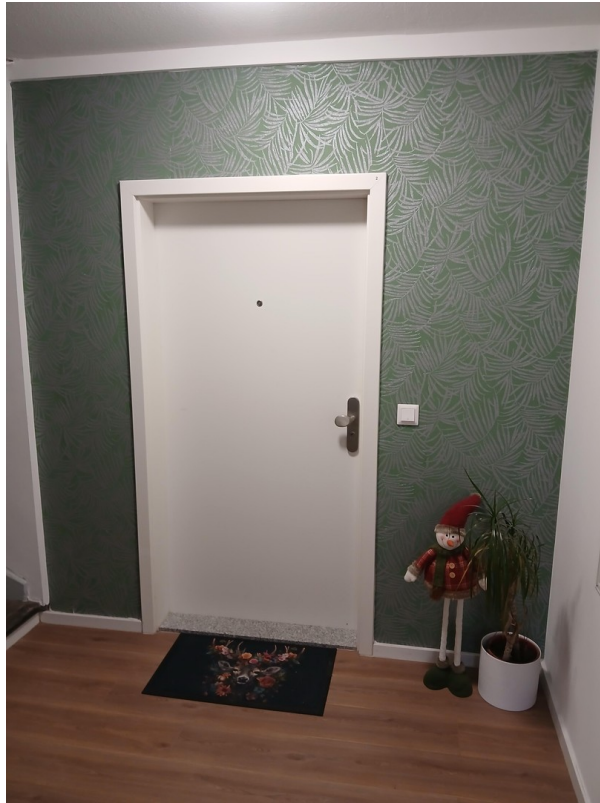
Eingang WE 2