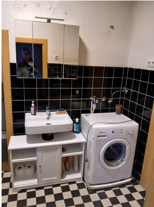
Badezimmer inkl. Waschmaschine