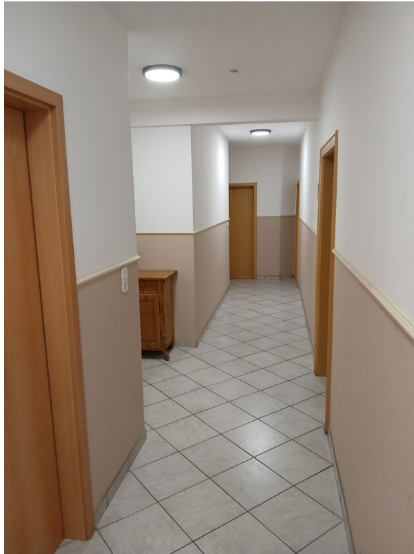
Flur jedes Zimmer sep. Zugang