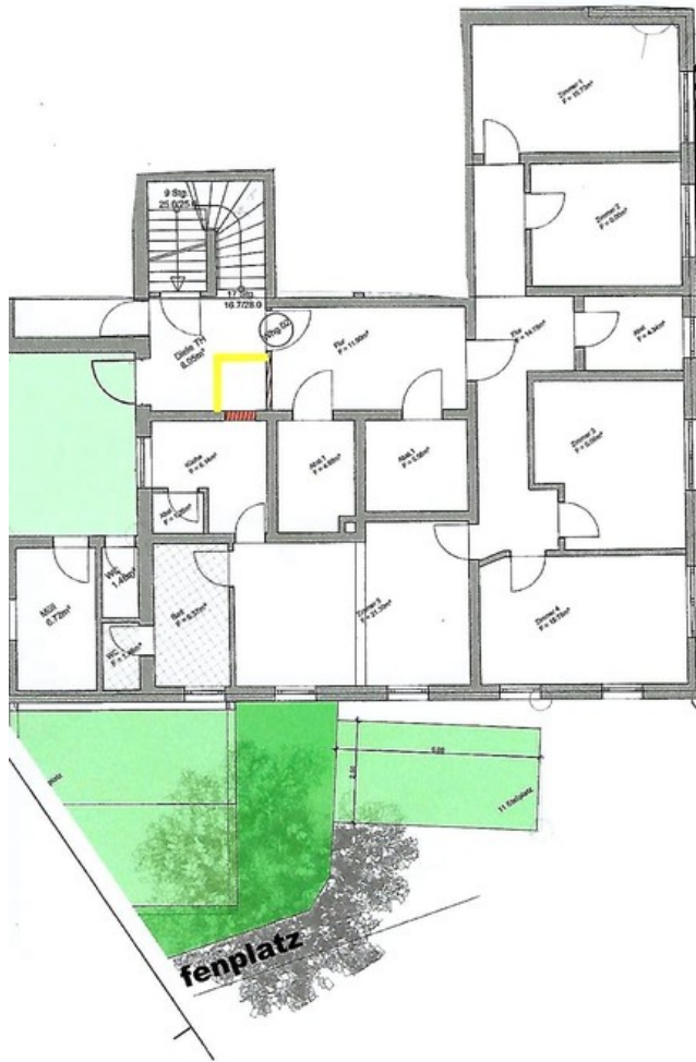
Grundriss Wohnung № 2