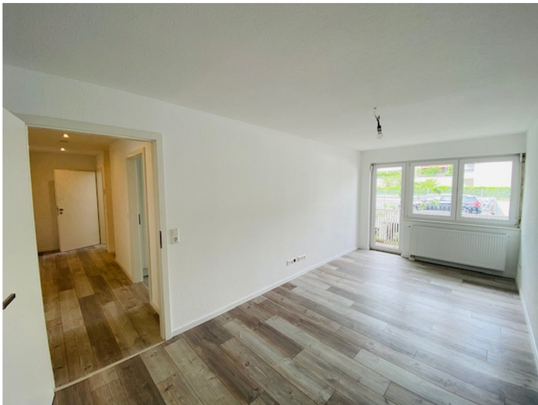
Wohnzimmer mit Balkon