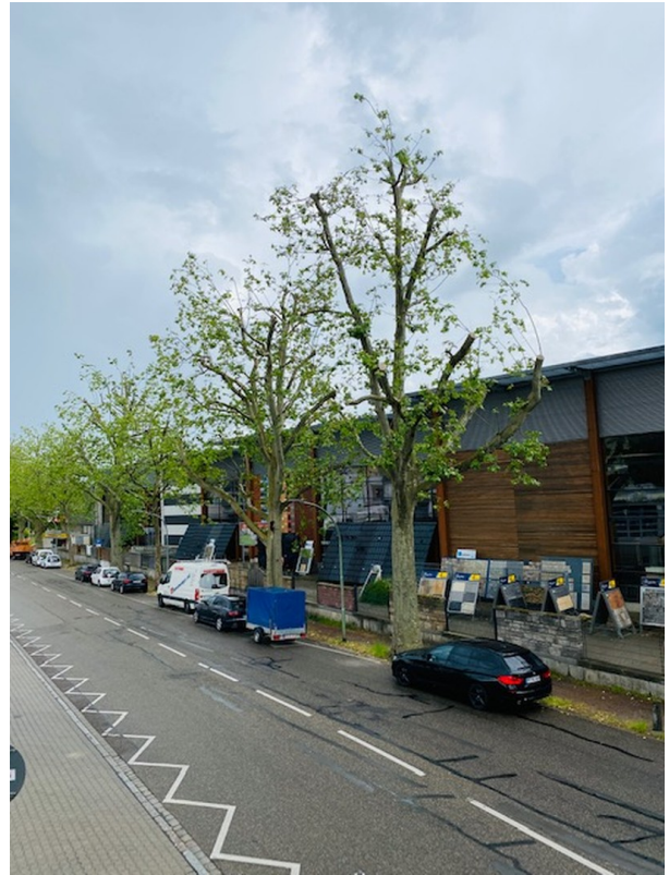
Ausblick zur Straße