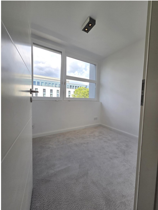
Home-Office / Gästezimmer