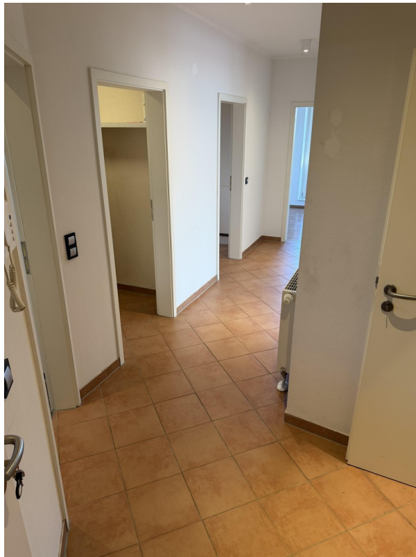
Flur / Eingang