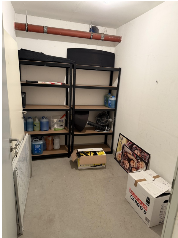
Kellerraum mit Regalen