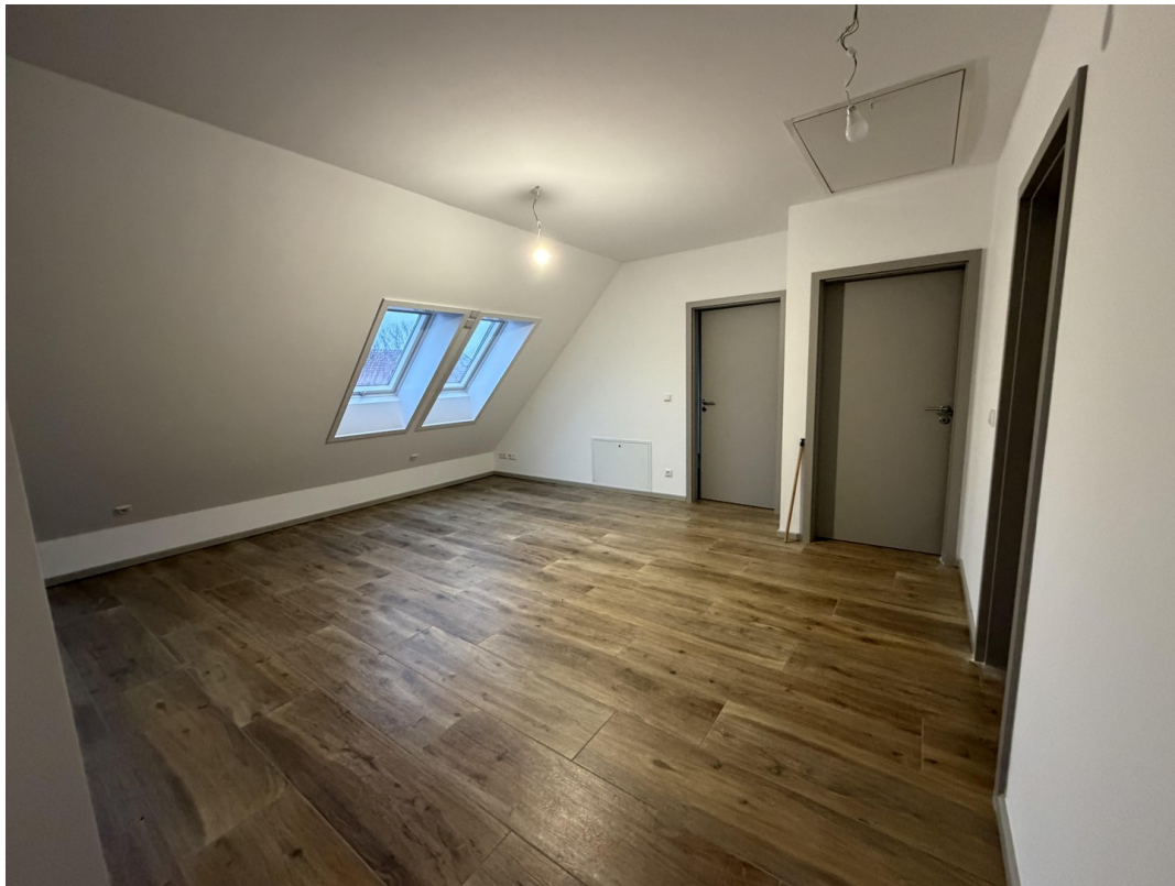
Blick vom Flur in Wohnbereich