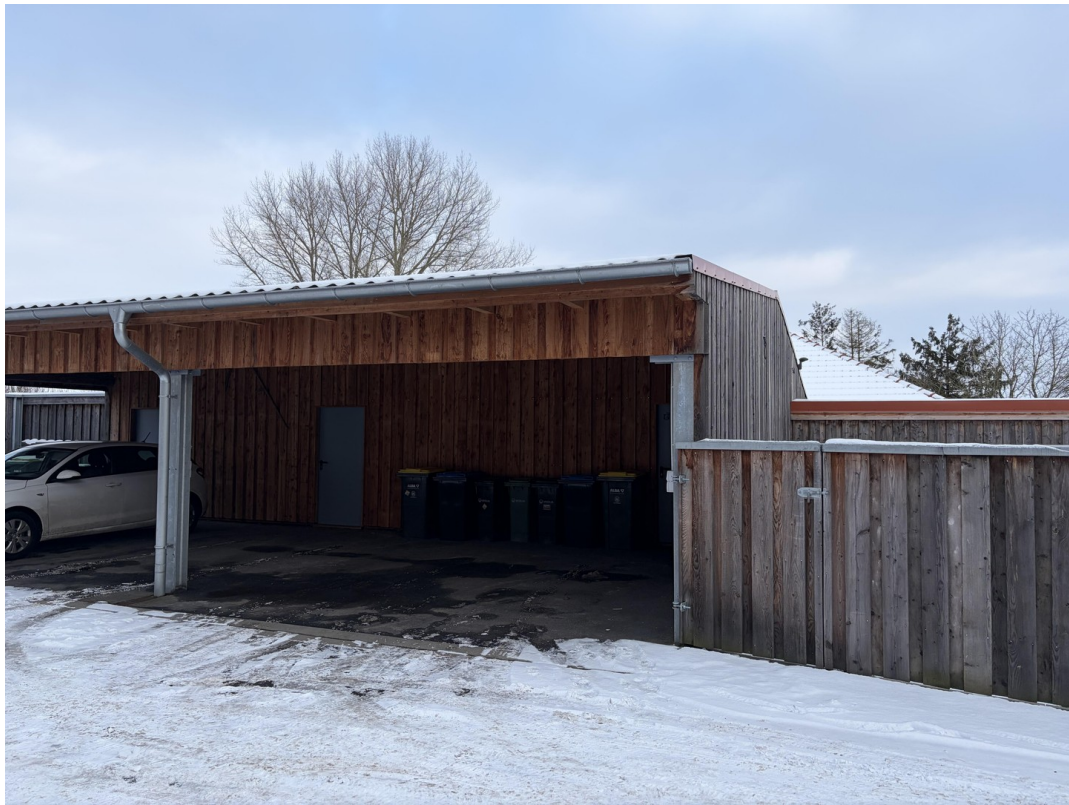
Carport mit Schuppen