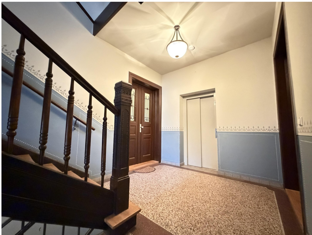
Treppenhaus mit Terrazzoboden