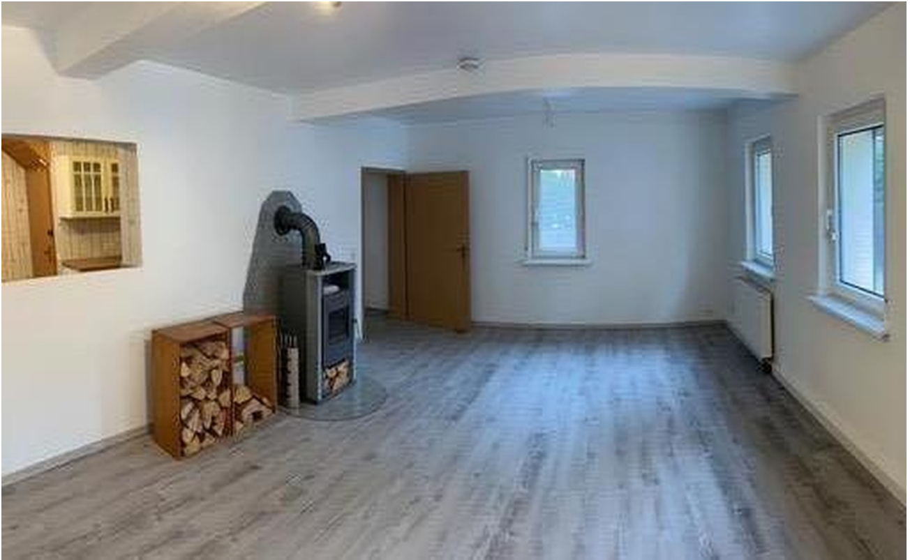
Wohnzimmer im EG