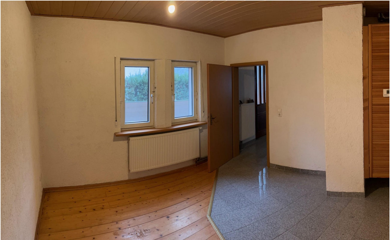
Büro im EG