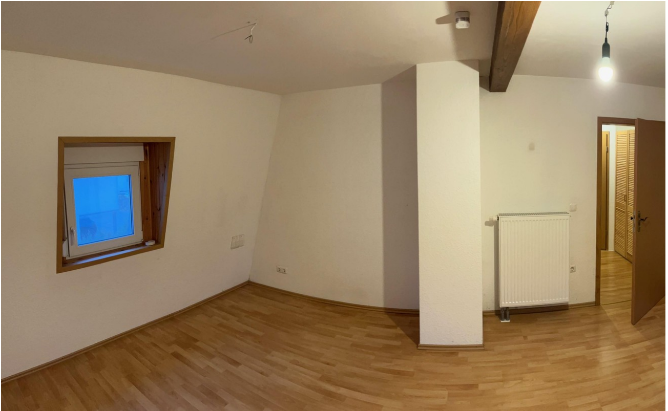
Schlafzimmer II im OG