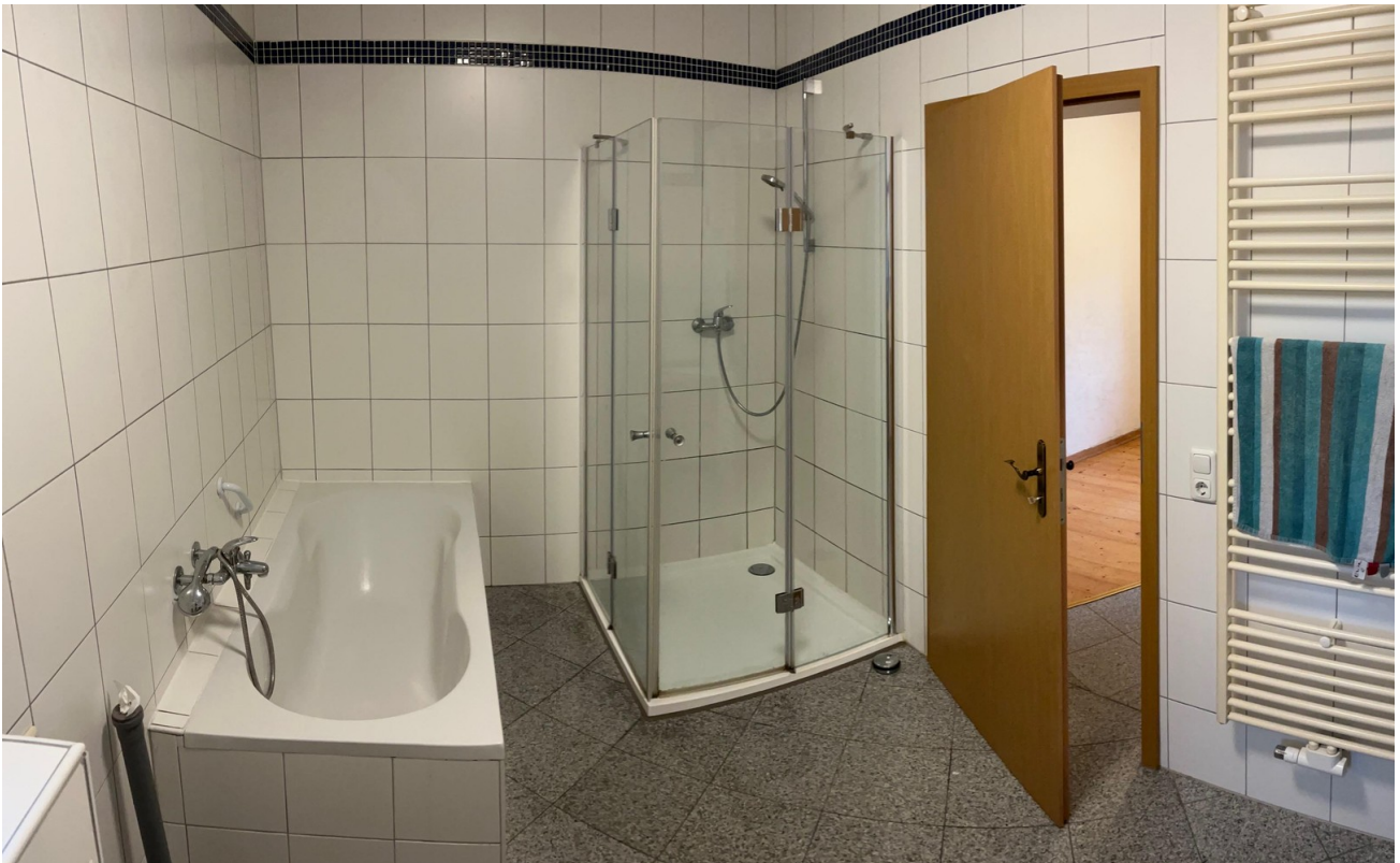
Bad im EG