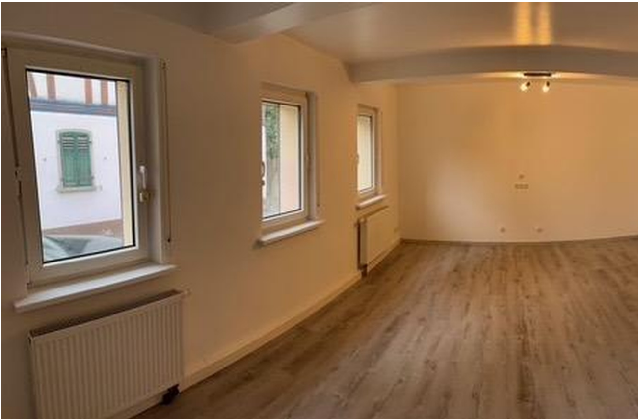
Wohnzimmer im EG