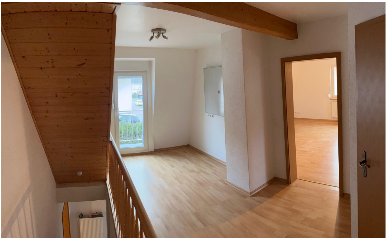
Flur im OG