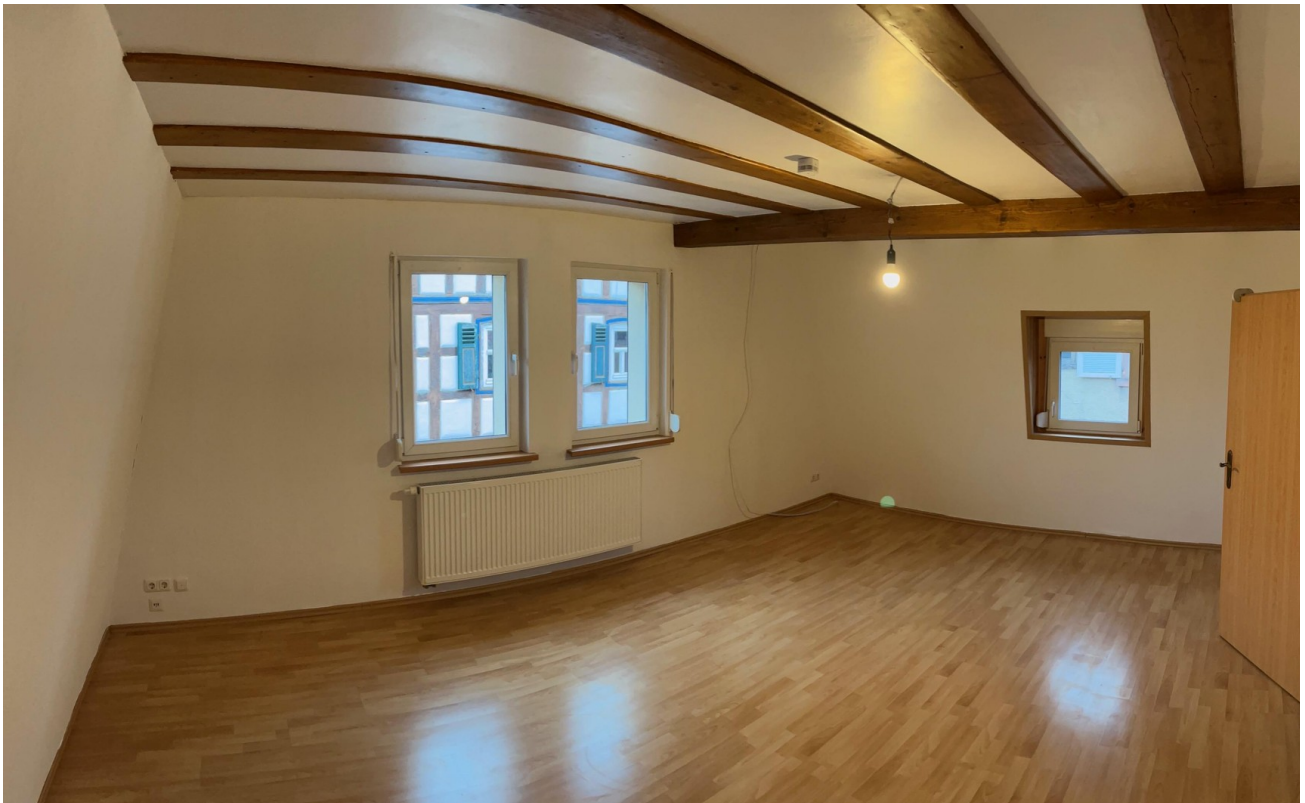
Schlafzimmer im OG