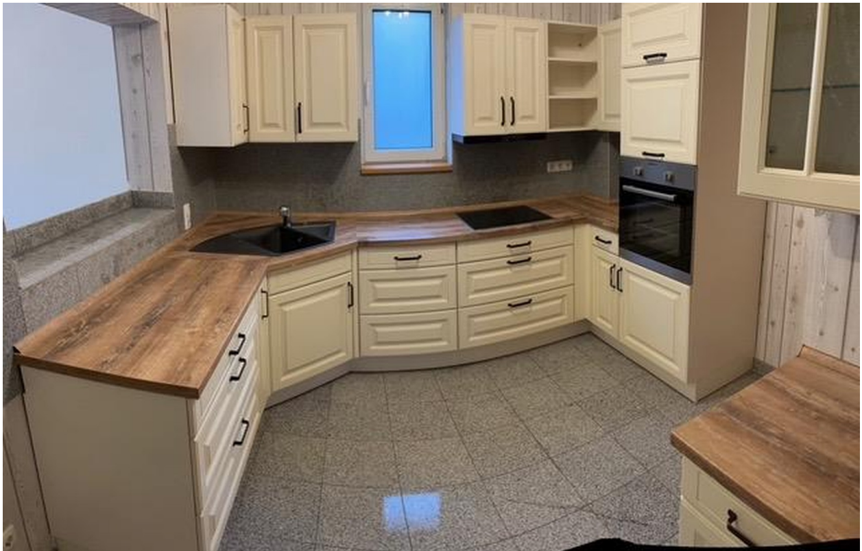
Küche im EG