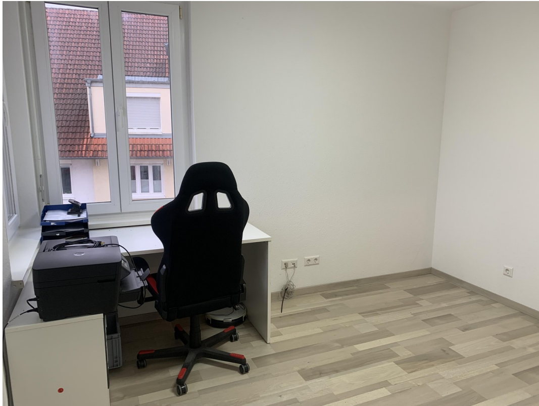
Kinderzimmer / Büro