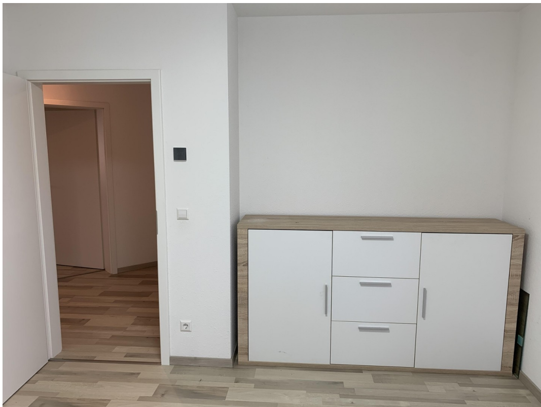
Kinderzimmer / Büro