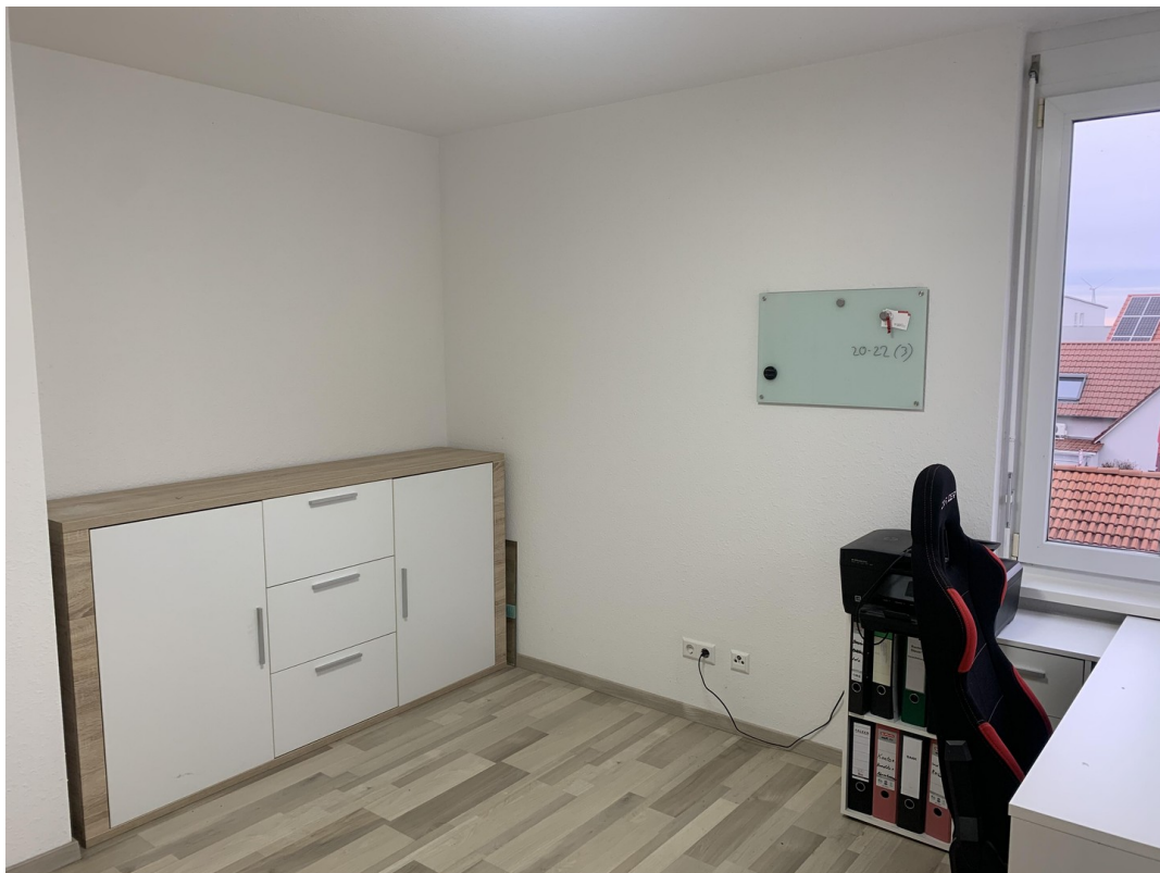
Kinderzimmer / Büro