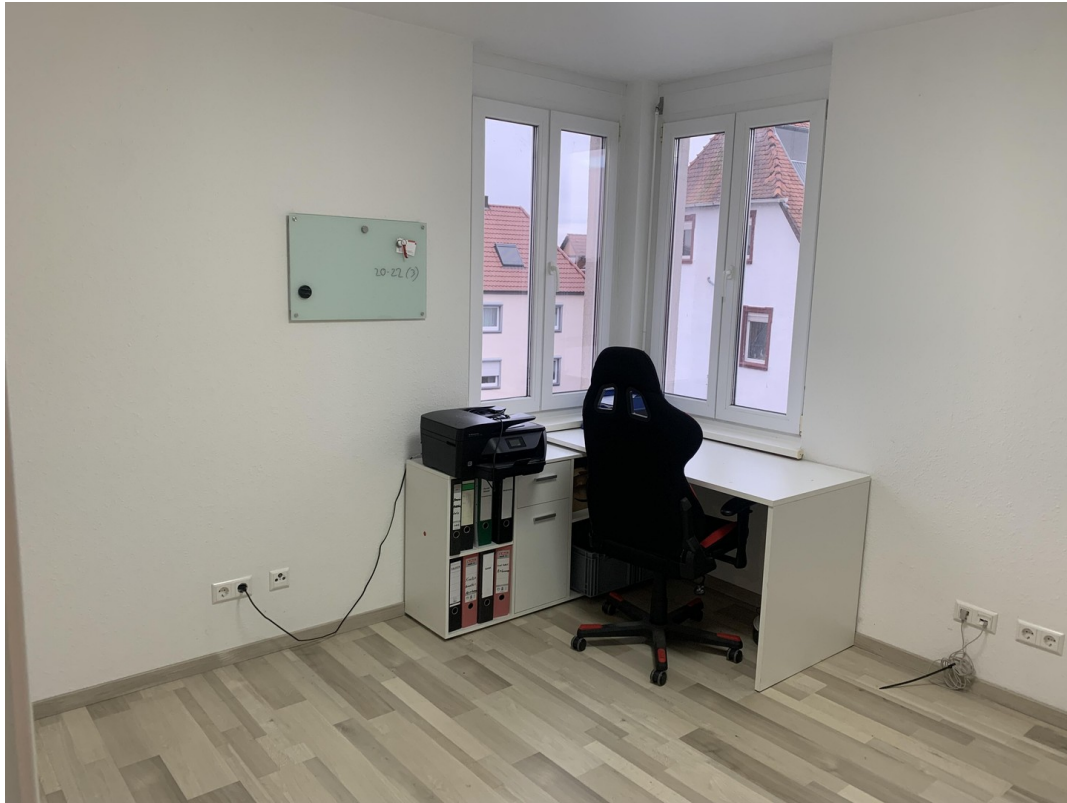
Kinderzimmer / Büro