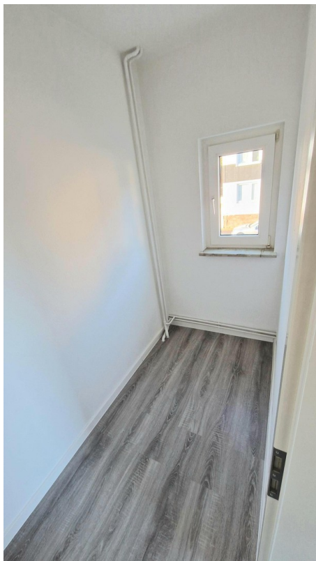
Abstellraum neben der Küche