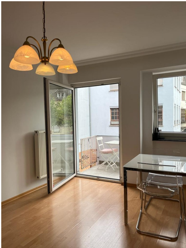
Ausgang zum Balkon