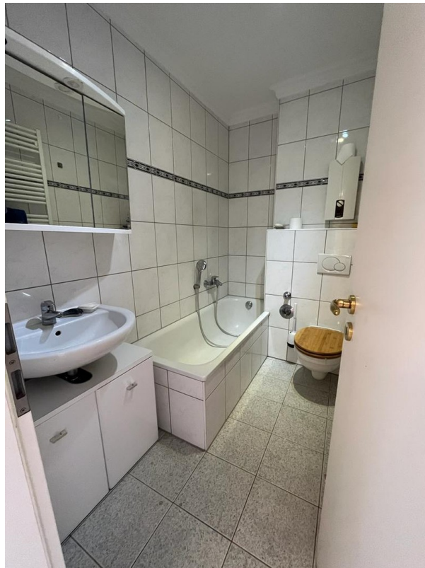
Badezimmer mit Badewanne