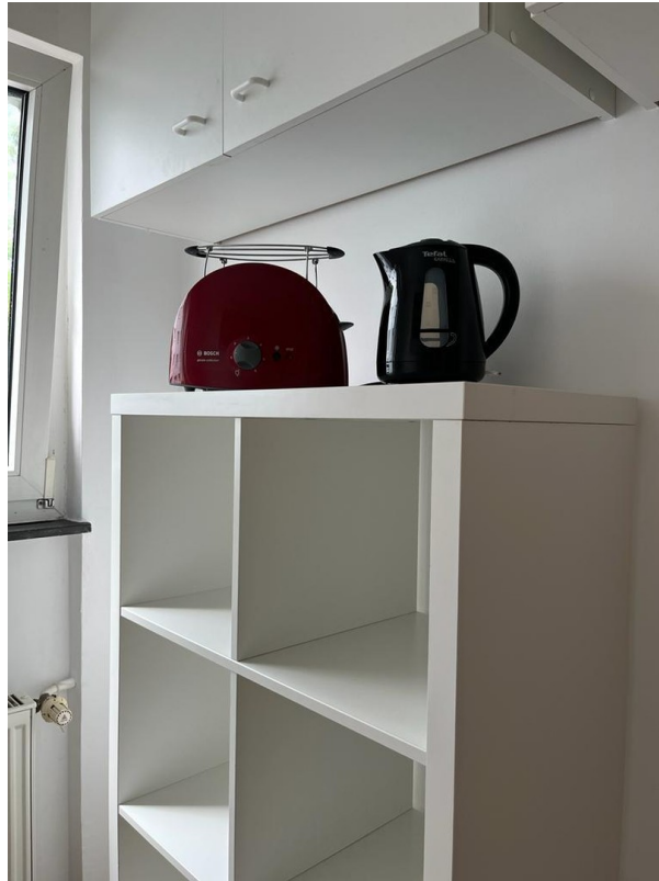
Küche mit Elektrogeräten