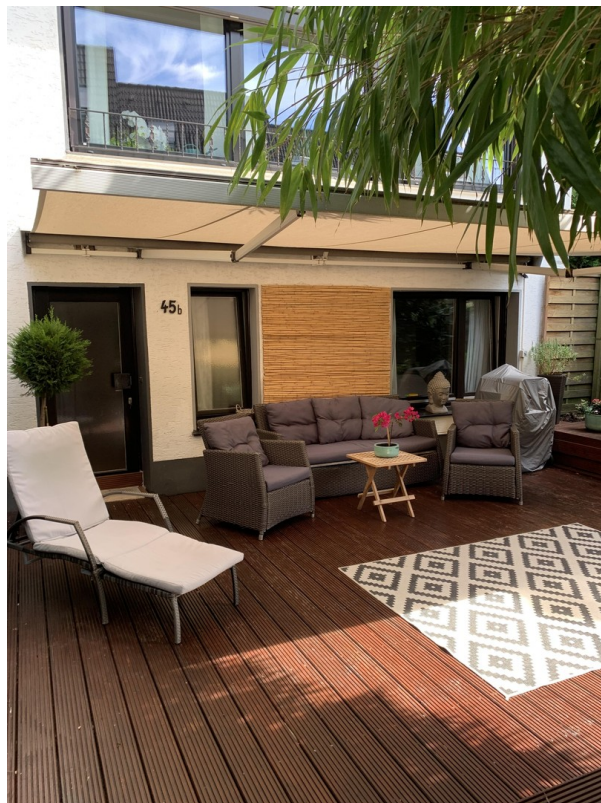
Terrasse hinterm Haus