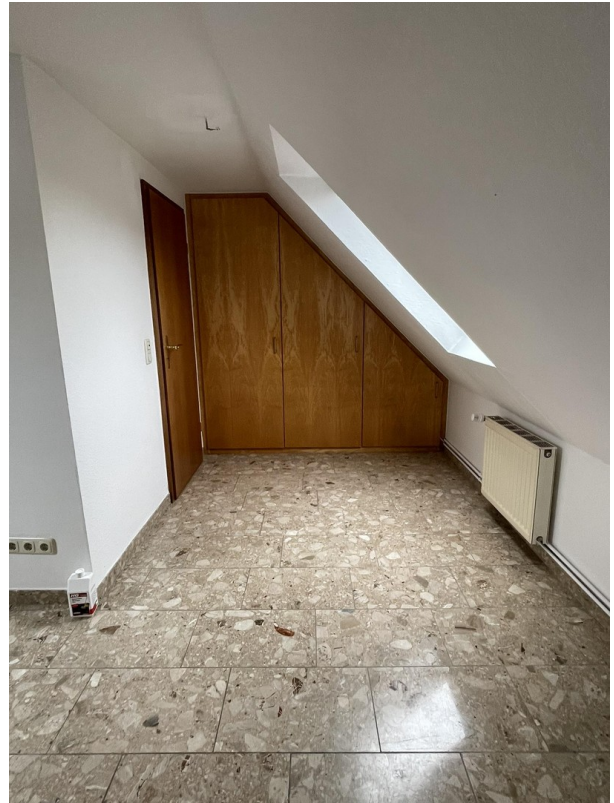
Studio mit Einbauschränk 1