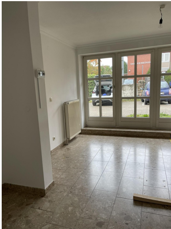
Wohnzimmer - Ausblick