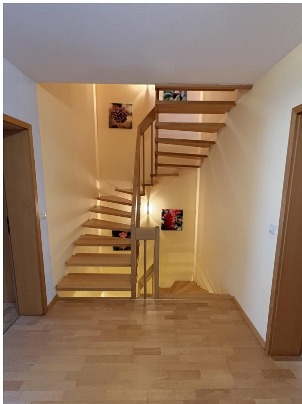
1. OG - Treppenhaus