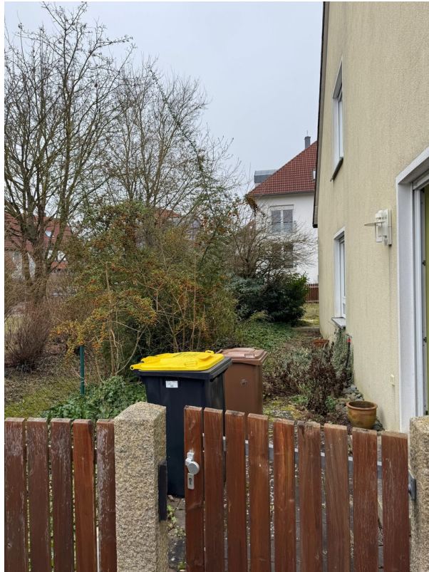
Außenansicht - Ostseite