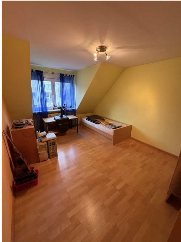
1. OG - Kind 1