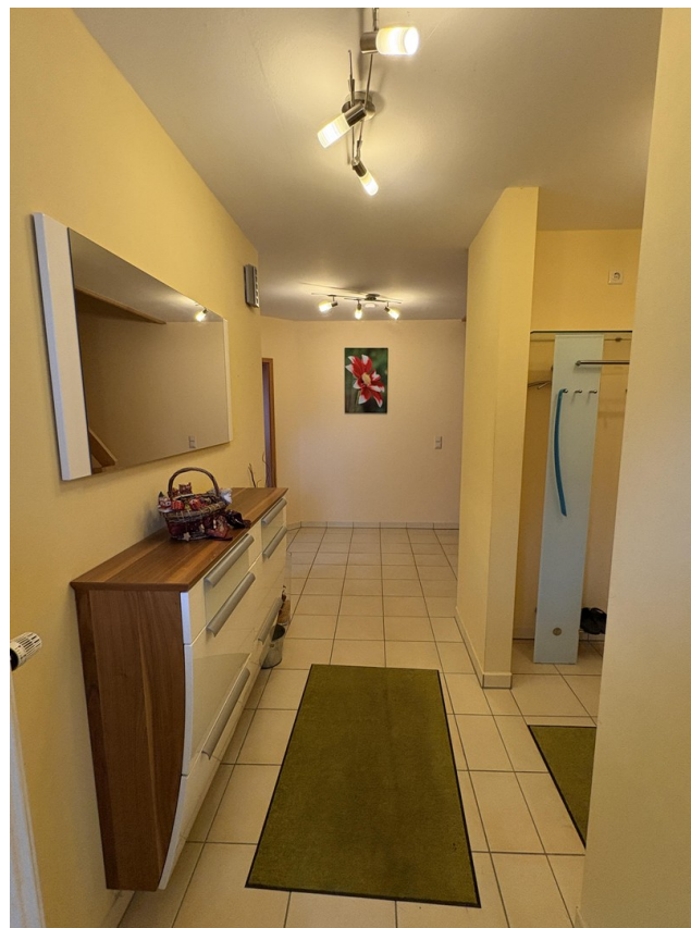
EG - Eingangsbereich