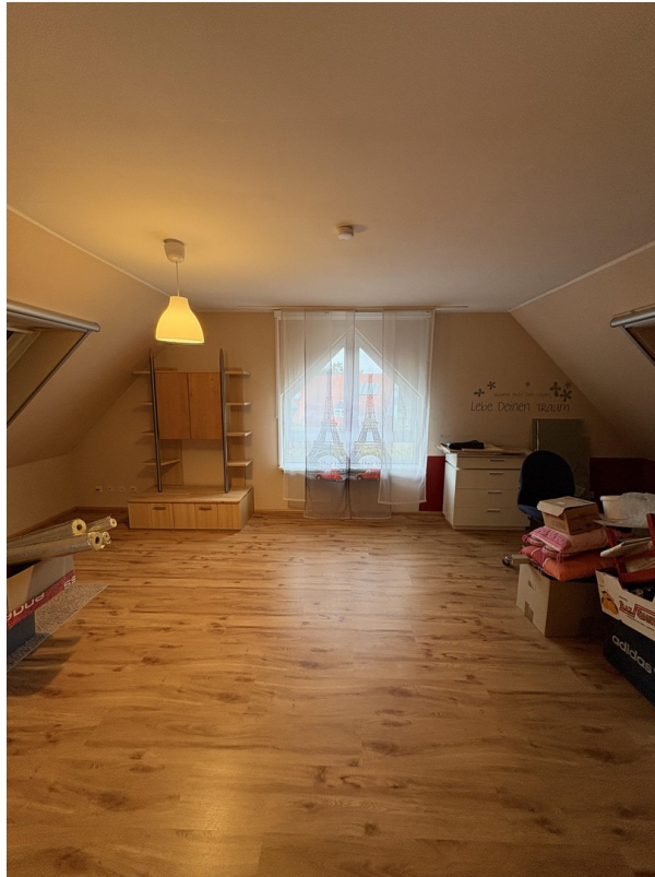
2. OG - Studio