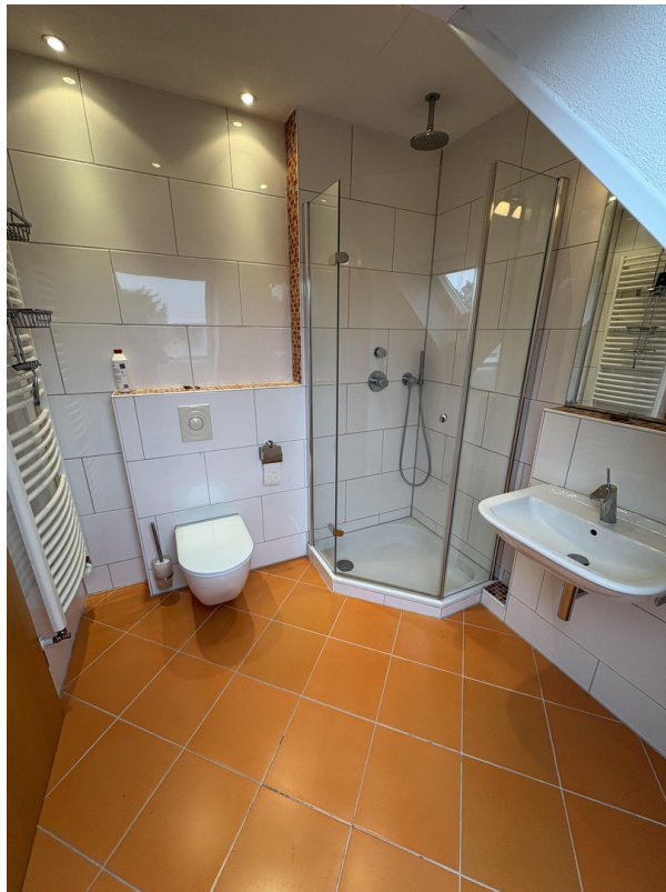
2. OG - Bad (Speicher 1)