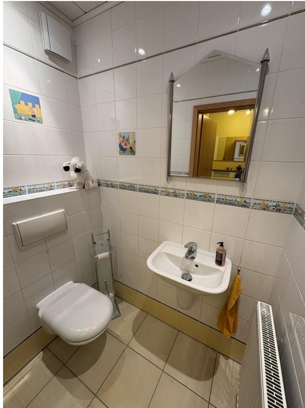
EG - Gäste-WC