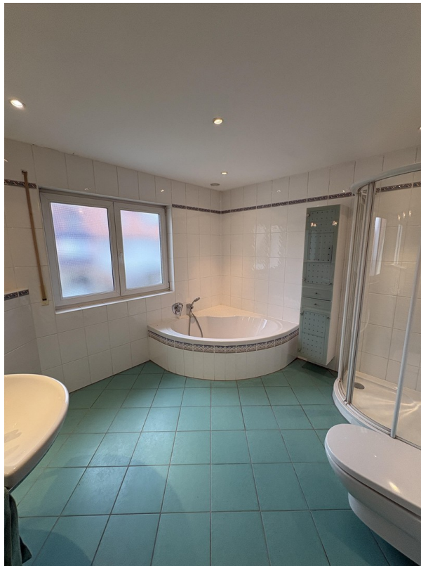
1. OG - Badezimmer