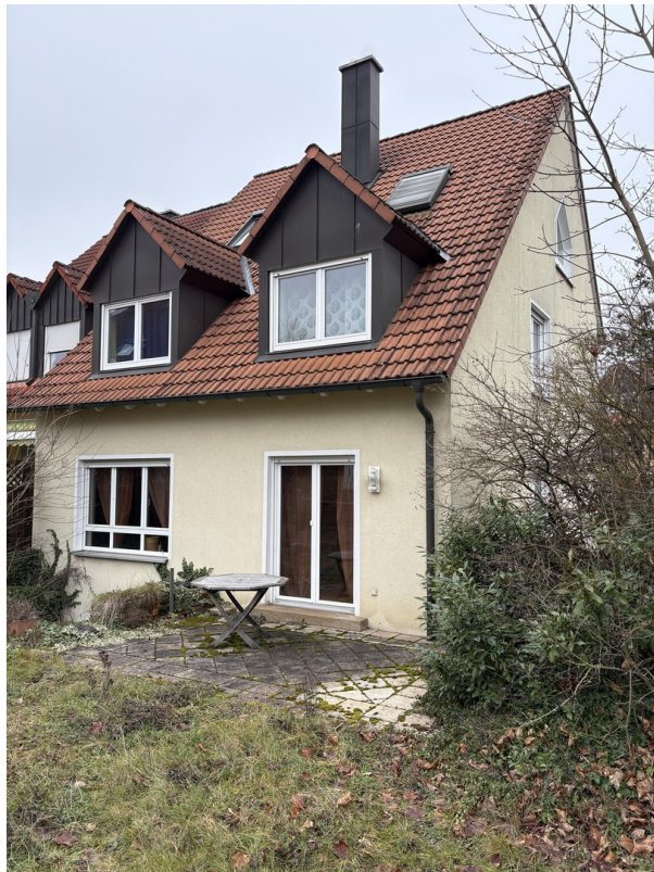
Außenansicht - Südseite