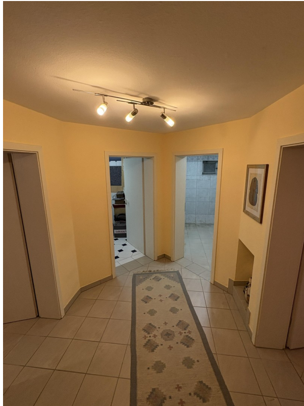
KG - Flur