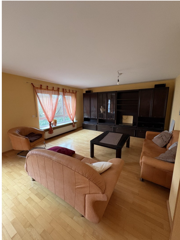
EG - Wohnzimmer