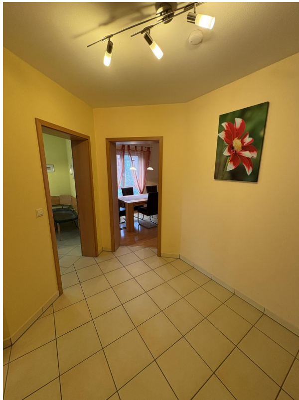
EG - Flur