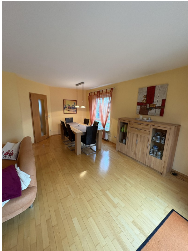
EG - Wohnzimmer (Essbereich)