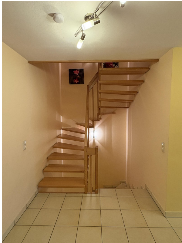
EG - Treppenhaus