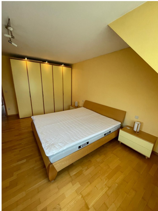
1. OG - Schlafzimmer (Eltern)