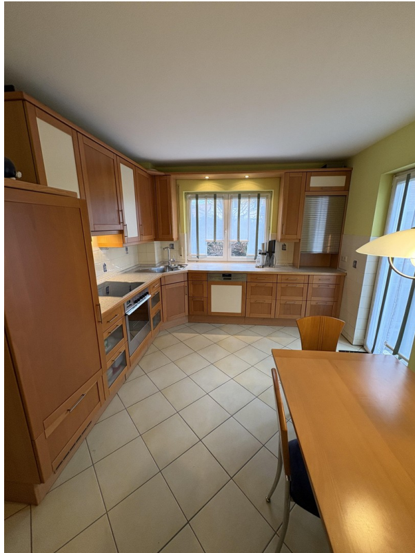
EG - Küche