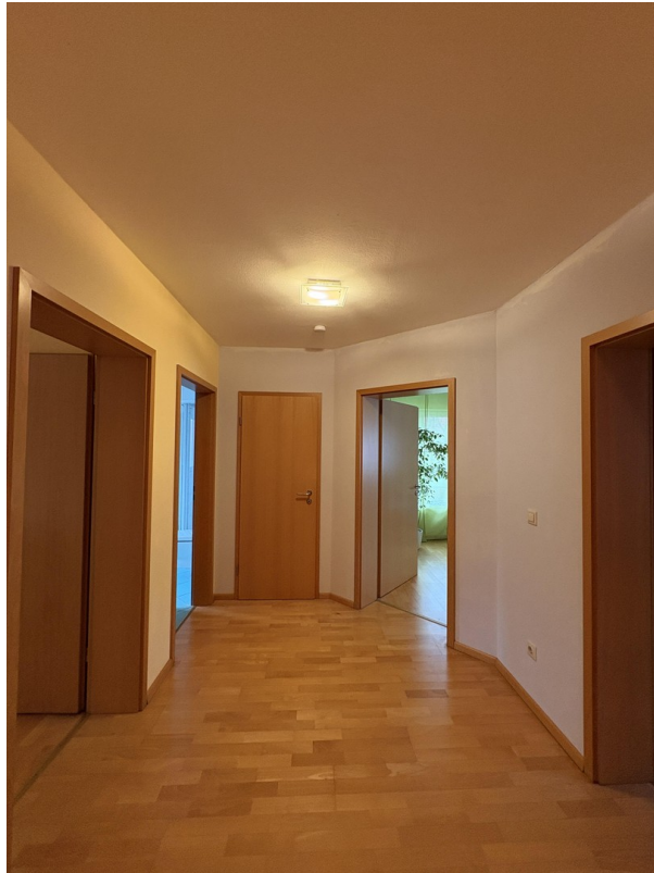
1. OG - Flur