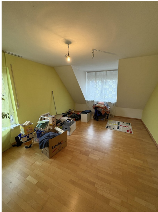
1. OG - Kind 2