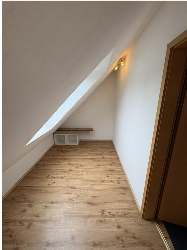
2. OG - Ankleide (Speicher 2)