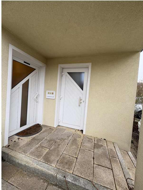
Außenansicht - Eingang