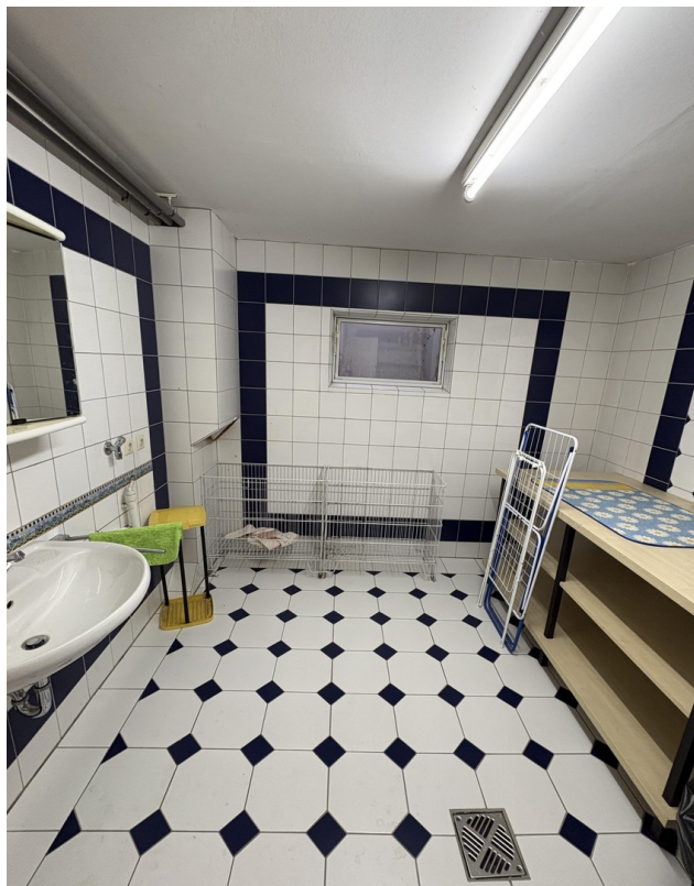
KG - Waschküche