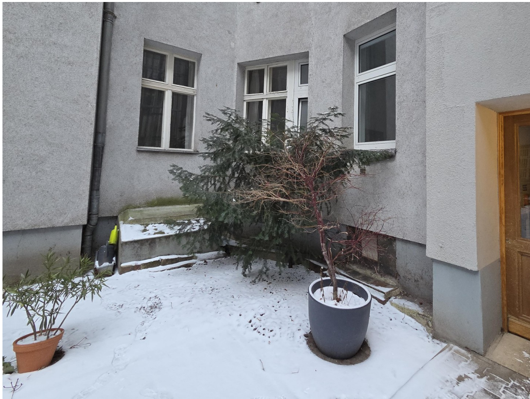
Hof / Gartenfläche