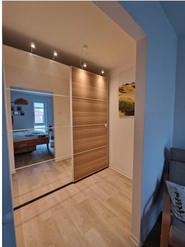
Ankleideraum am Schlafzimmer