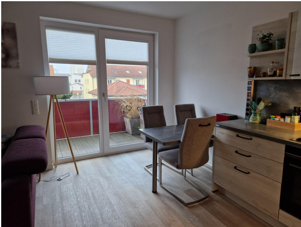
Wohnküche mit Einbauküche