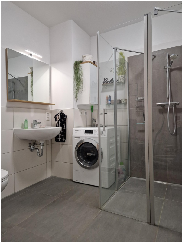
Bad (ohne Fenster)