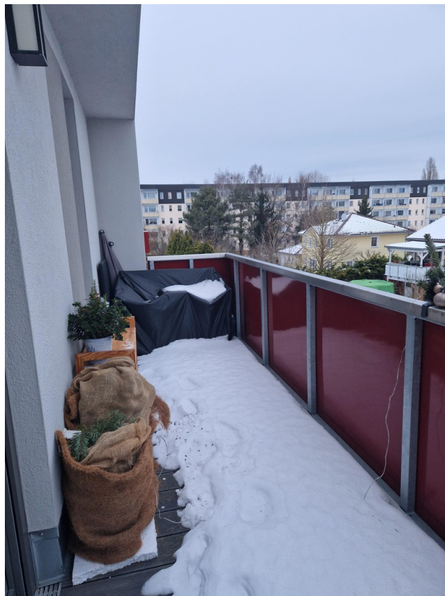
Balkon im Winter