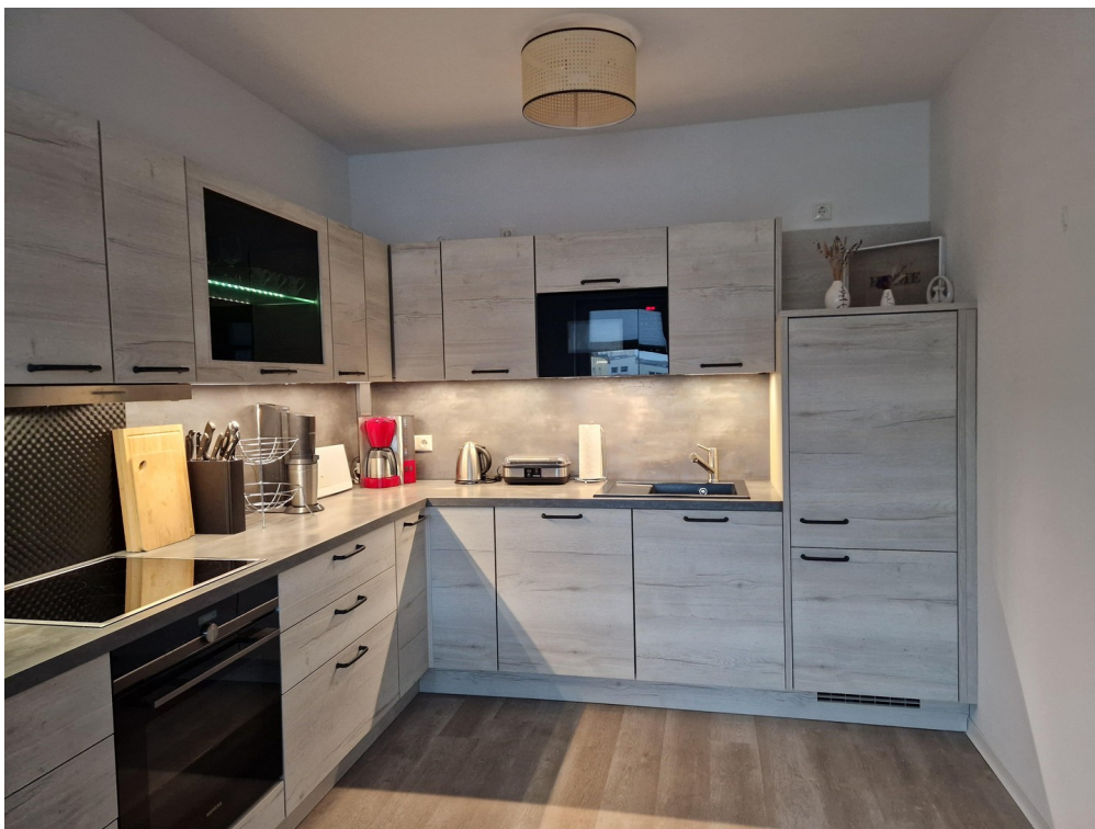
Wohnküche mit Einbauküche