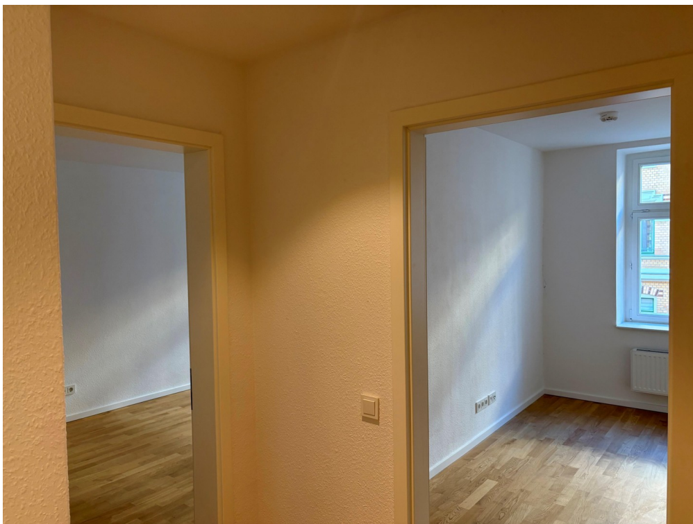
Flur Blick Schlafzimmer 1 & 2