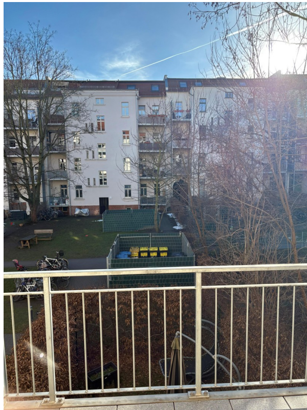
Blick in den Innenhof