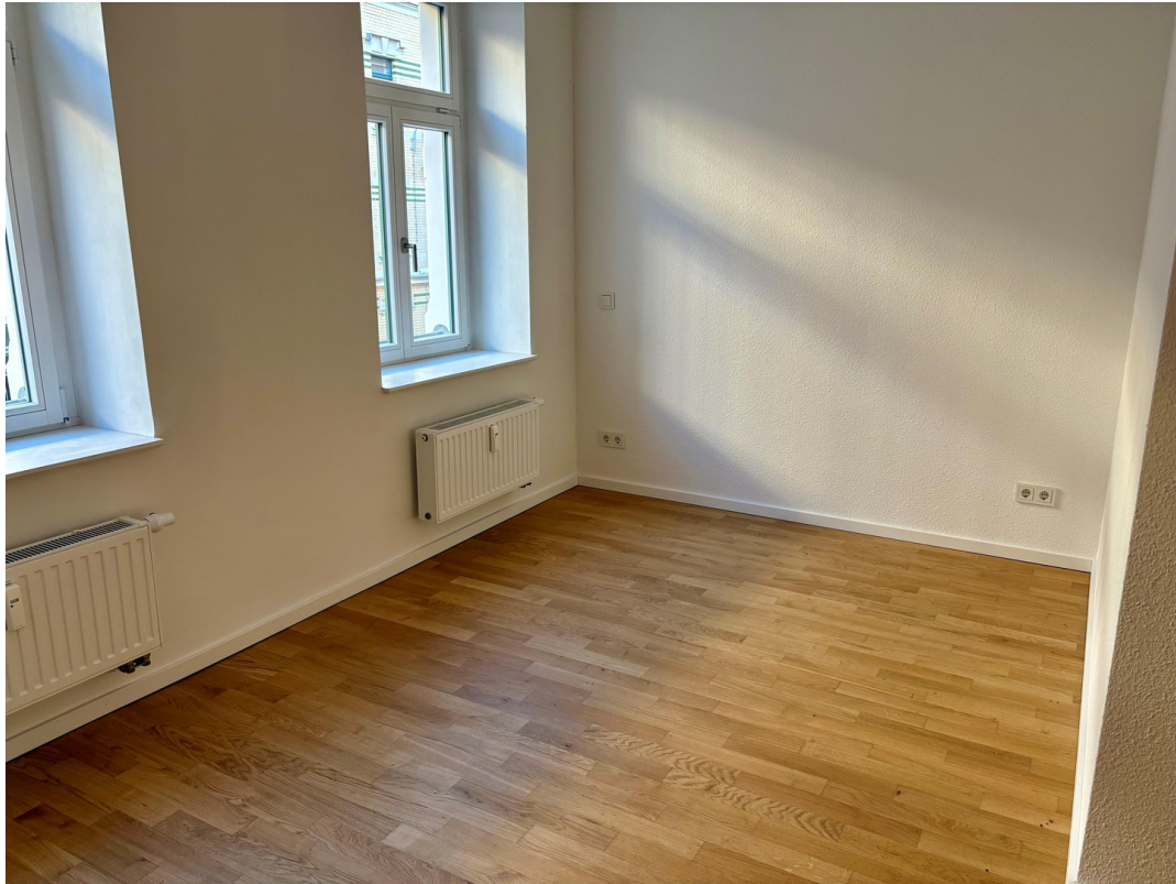
Schlafzimmer 2 / Kinderzimmer