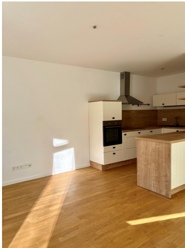
Wohn / Esszimmer Küche