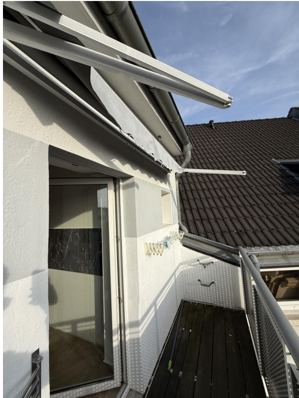
Balkon mit Markise