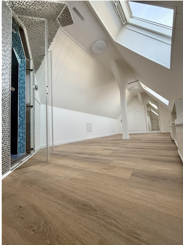
Hobbyraum und Dampfsauna