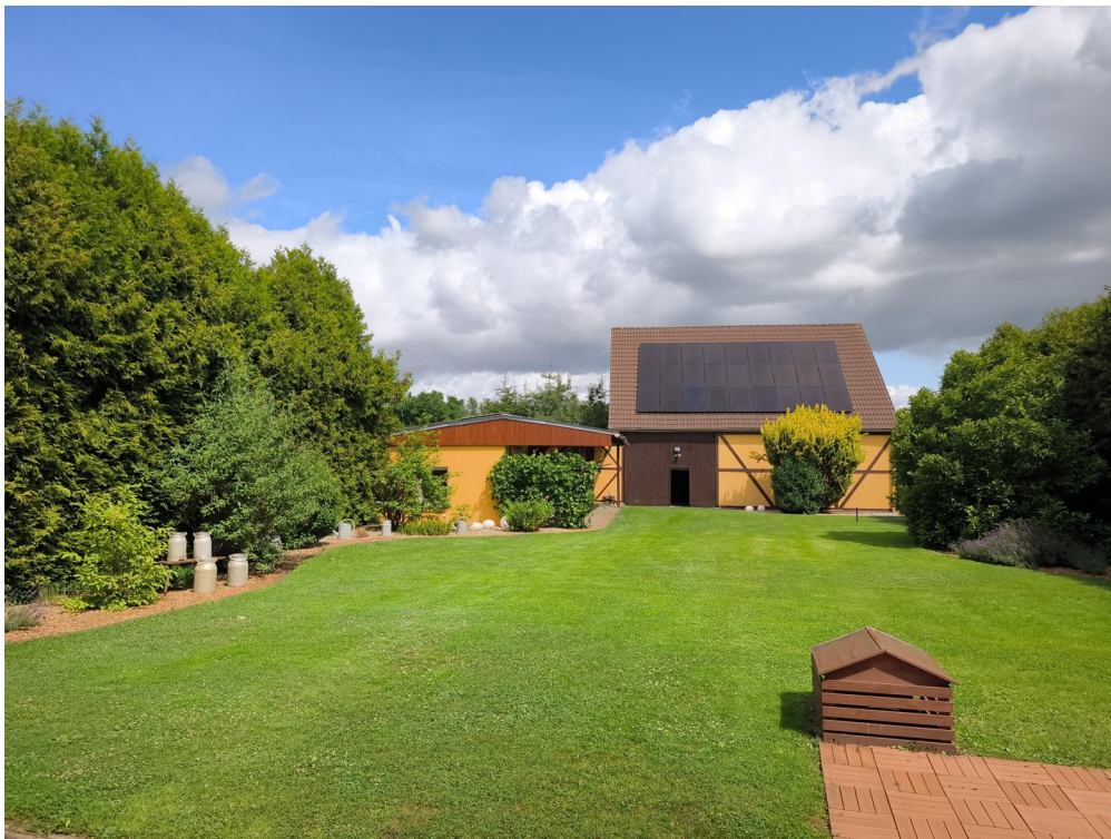
Hof und Scheune mit PV 10kWp