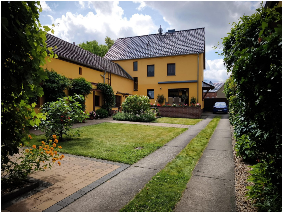
Wohnhaus - Hofansicht