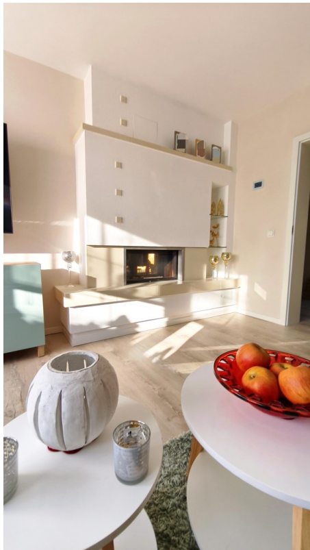
Kamin mit Fenster - EG