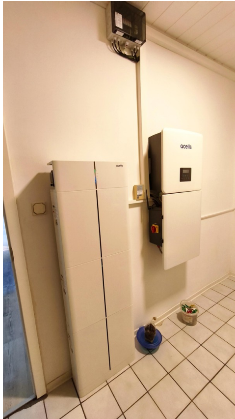
Batteriespeicher und PV