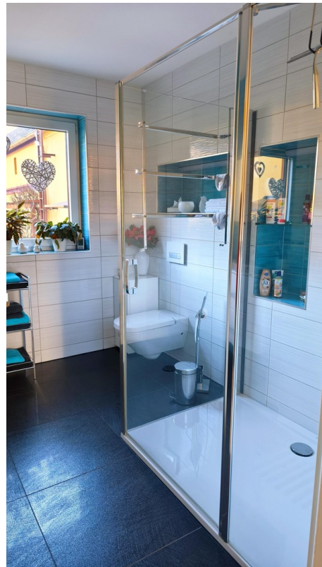
Bad mit großer Dusche