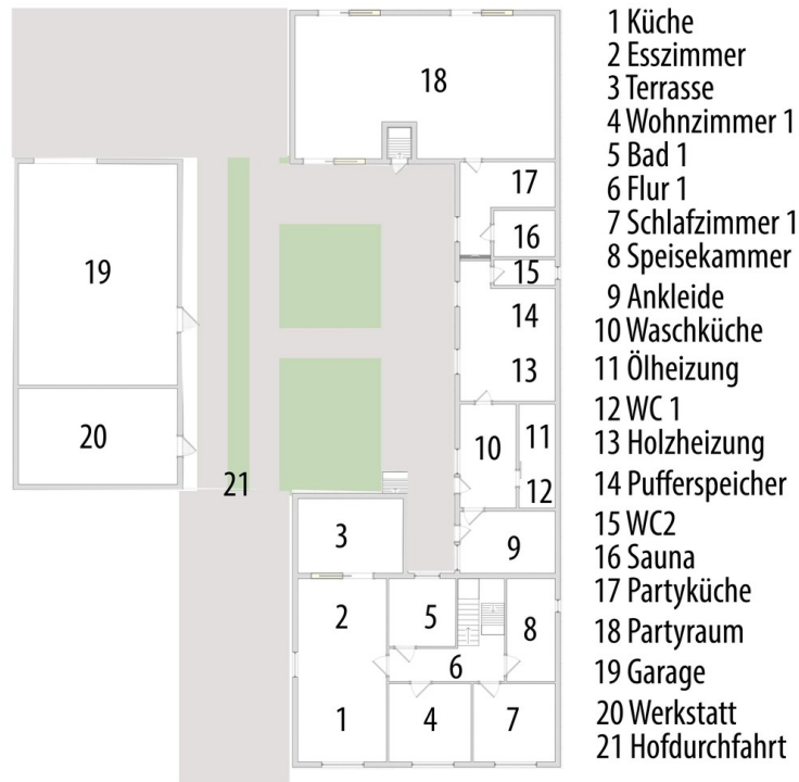
Grundriss EG mit Beschreibung