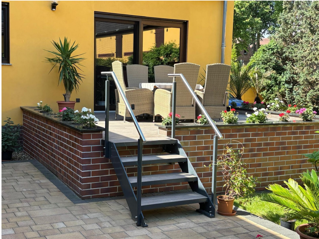
Terrasse am Essbereich