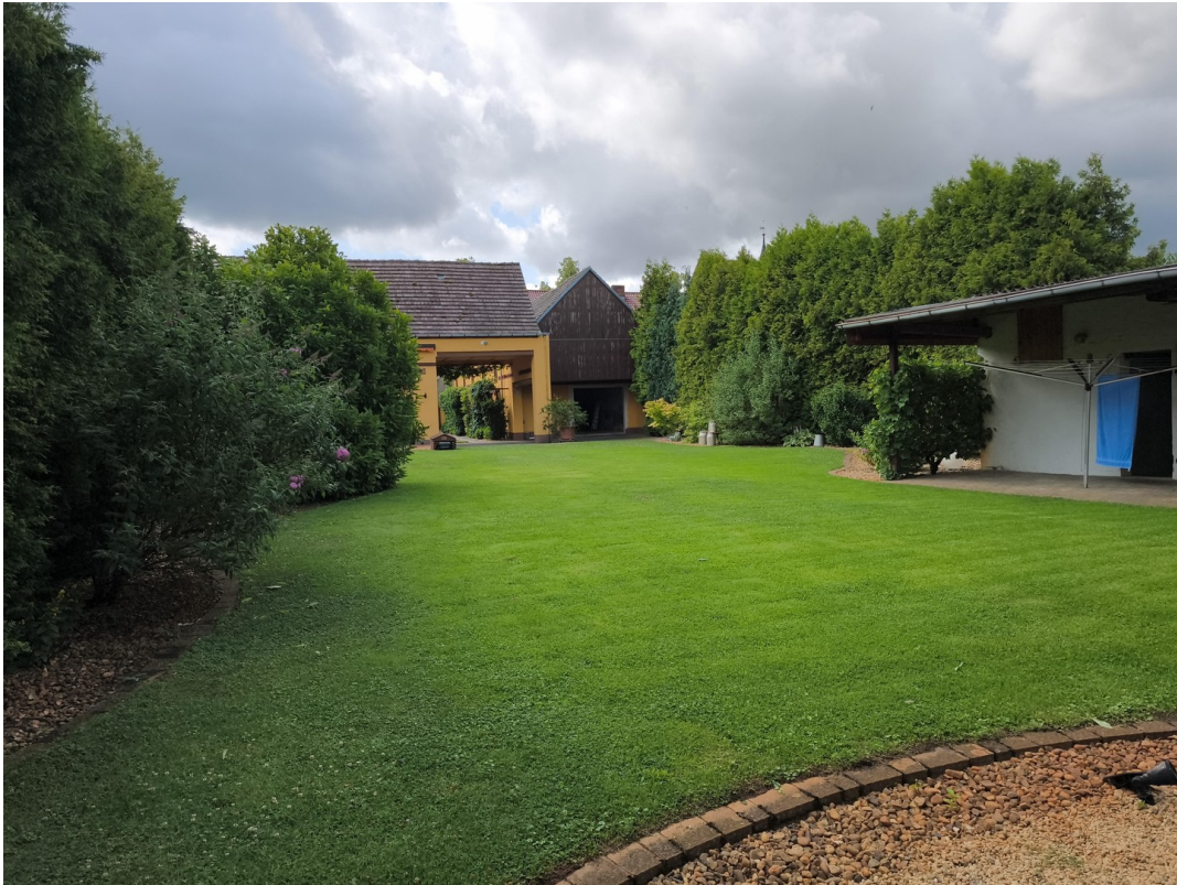
Ansicht von der Scheune