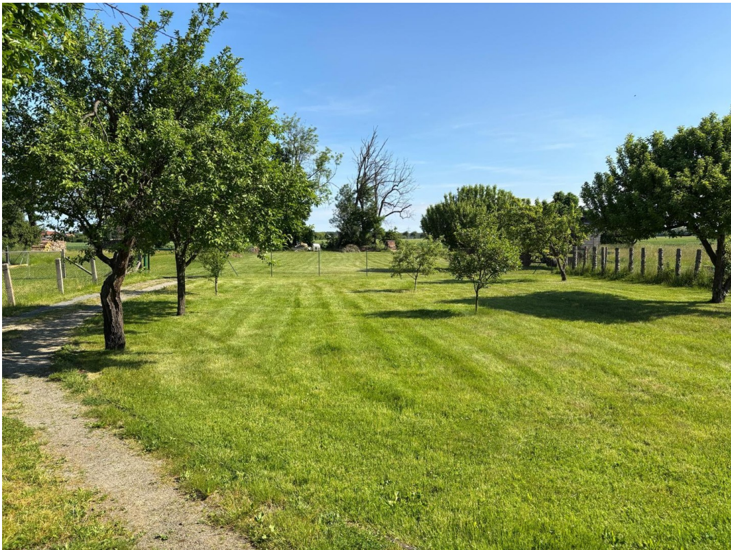
Nutzgarten und Brachwiese