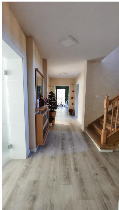
Heller Flur im EG