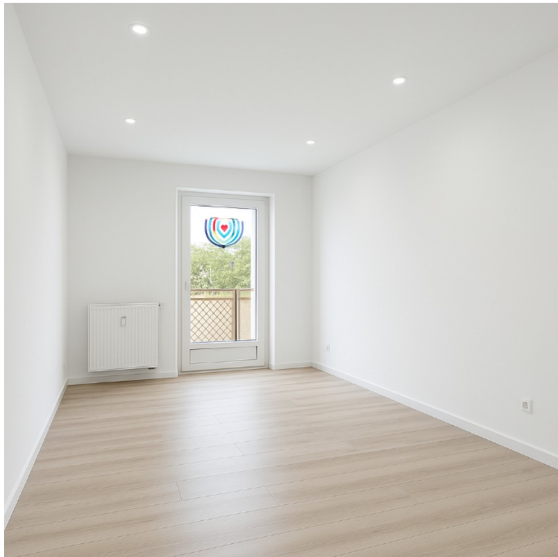
Zimmer 3 mit Balkonzugang