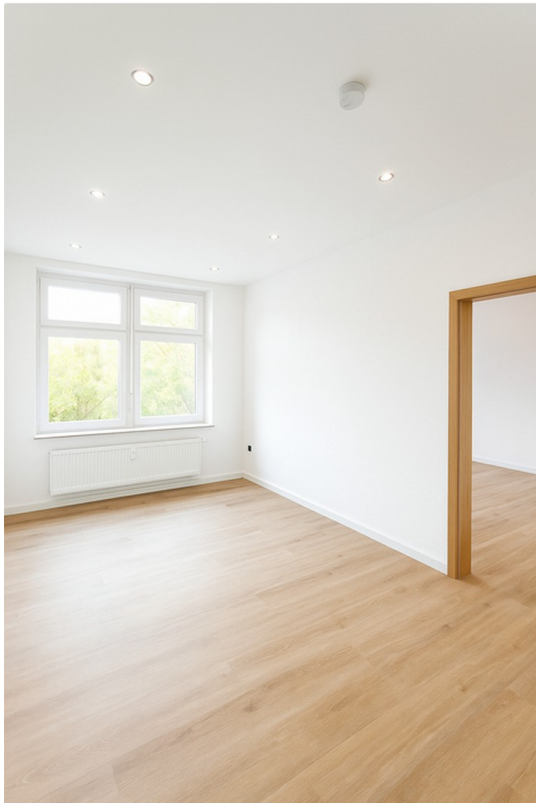
Zimmer 1 und 2