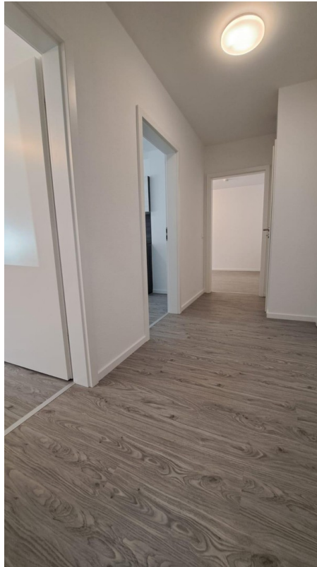
Flur Bild 2