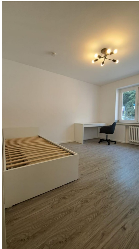
Wohnraum 1 möbliert Bild 3