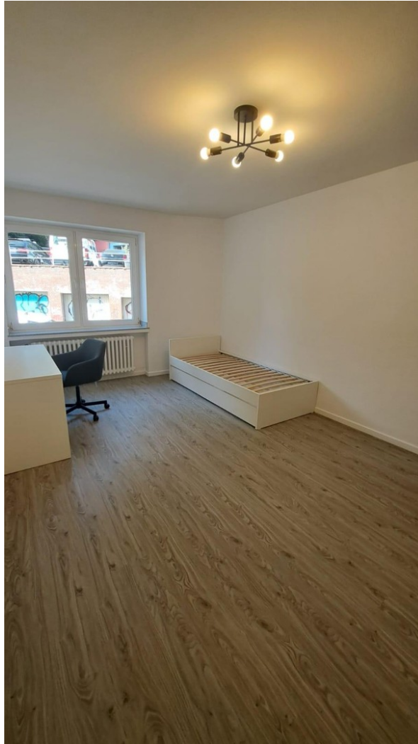
Wohnraum 2 möbliert Bild 1