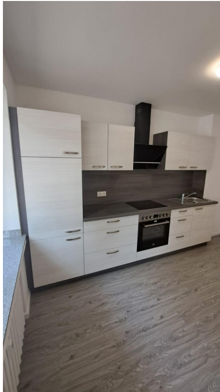
Einbauküche Bild 2