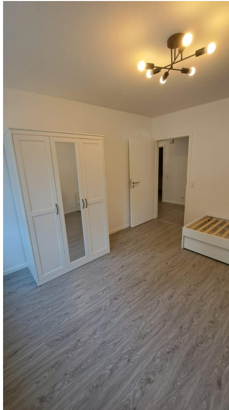
Wohnraum 1 möbliert Bild 2