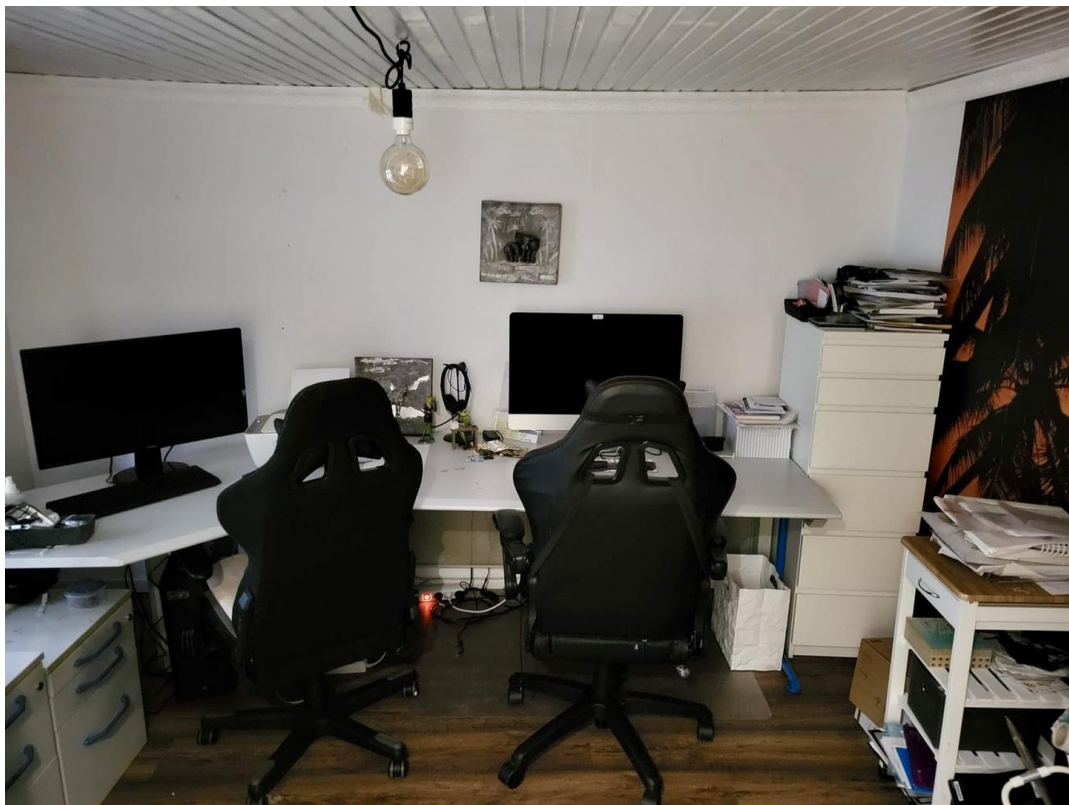
Souterrain Zimmer 1