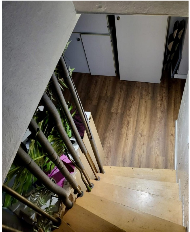
Treppe zum Souterrain