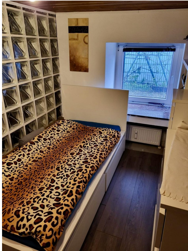
Souterrain Zimmer 2