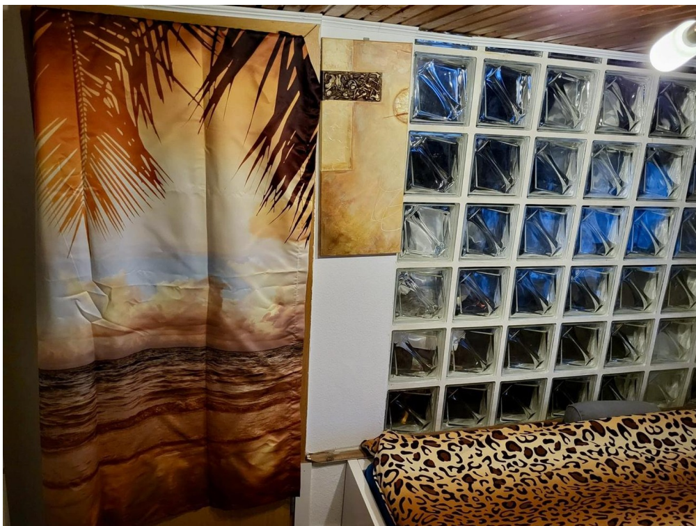
Souterrain Trennwand zum Abste