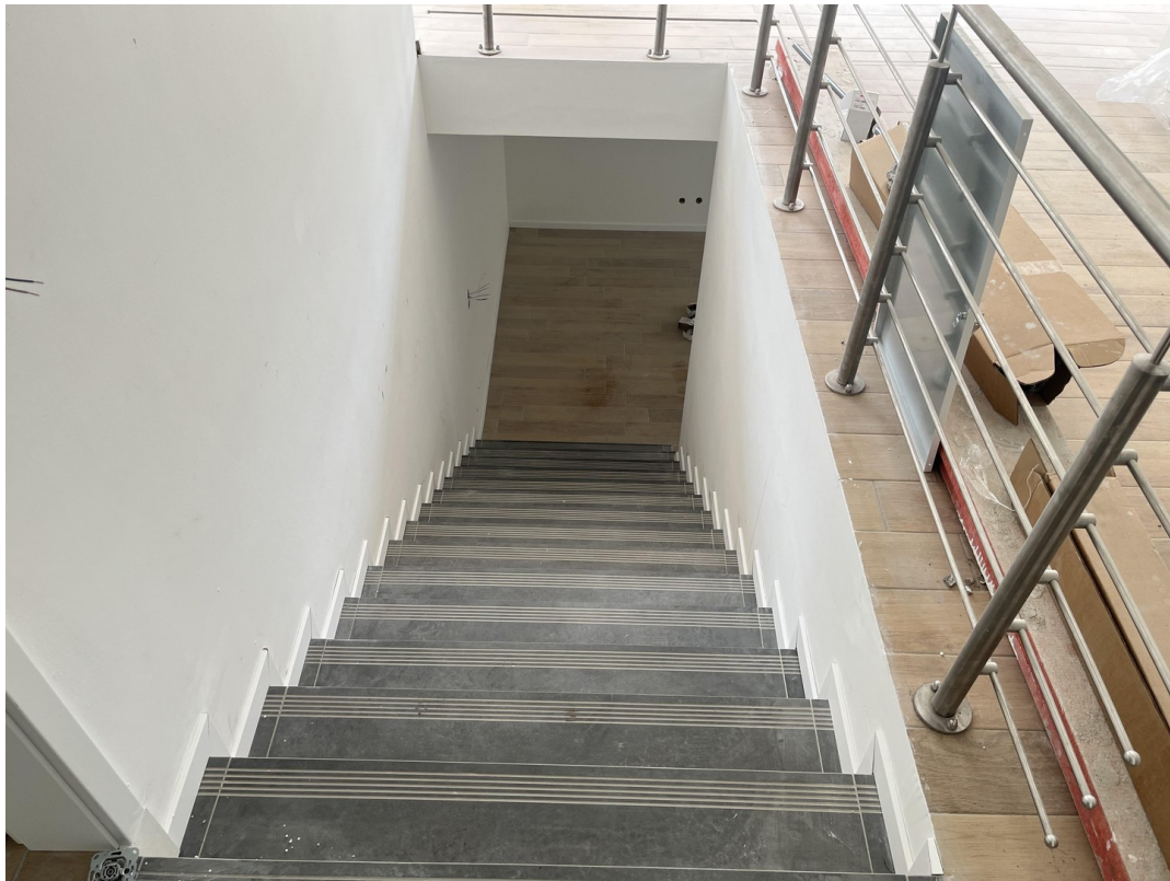
EG - Treppe zum Hobbyraum