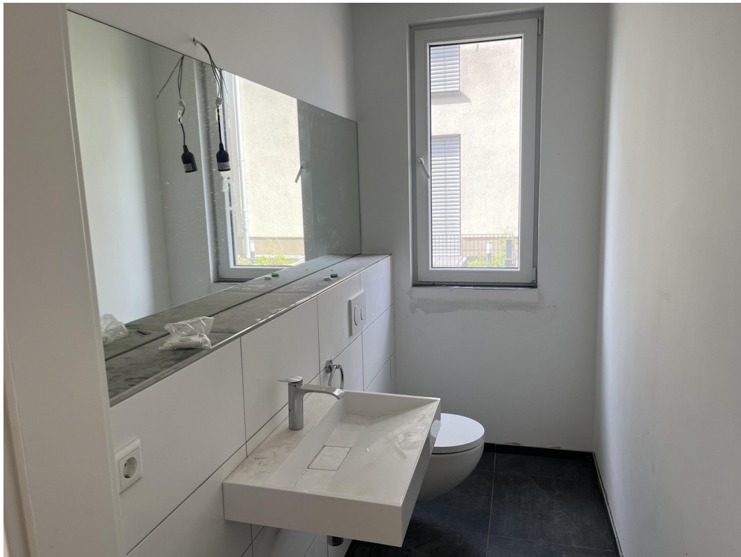
EG Gäste Bad