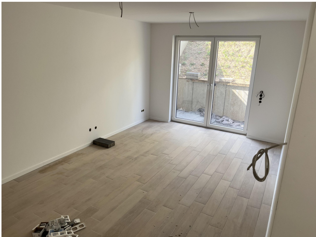
EG - Hobbyraum