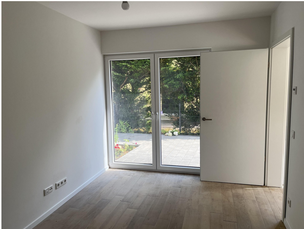
EG - Schlafzimmer 2