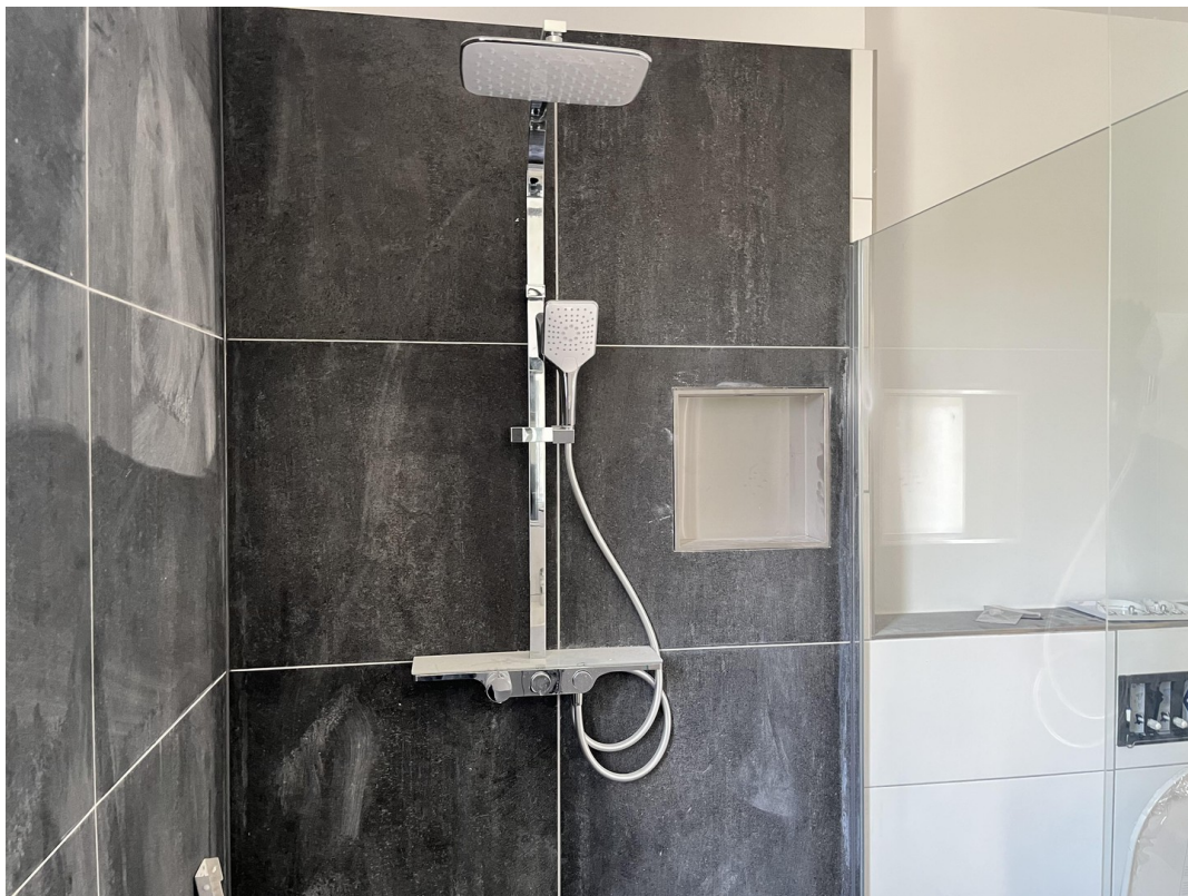
EG - Badezimmer