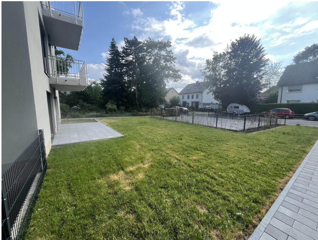
EG - Garten / Terrasse