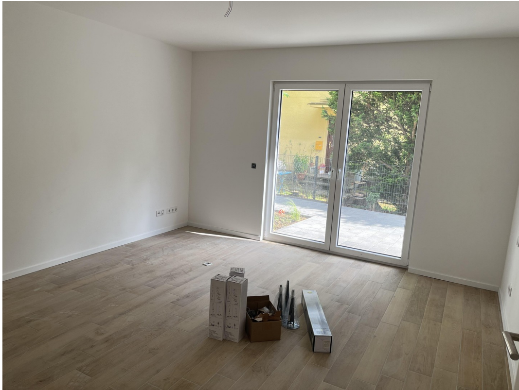
EG - Schlafzimmer 1