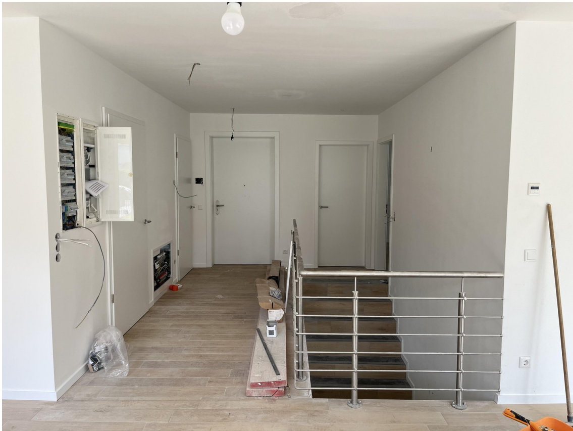
EG - Flur