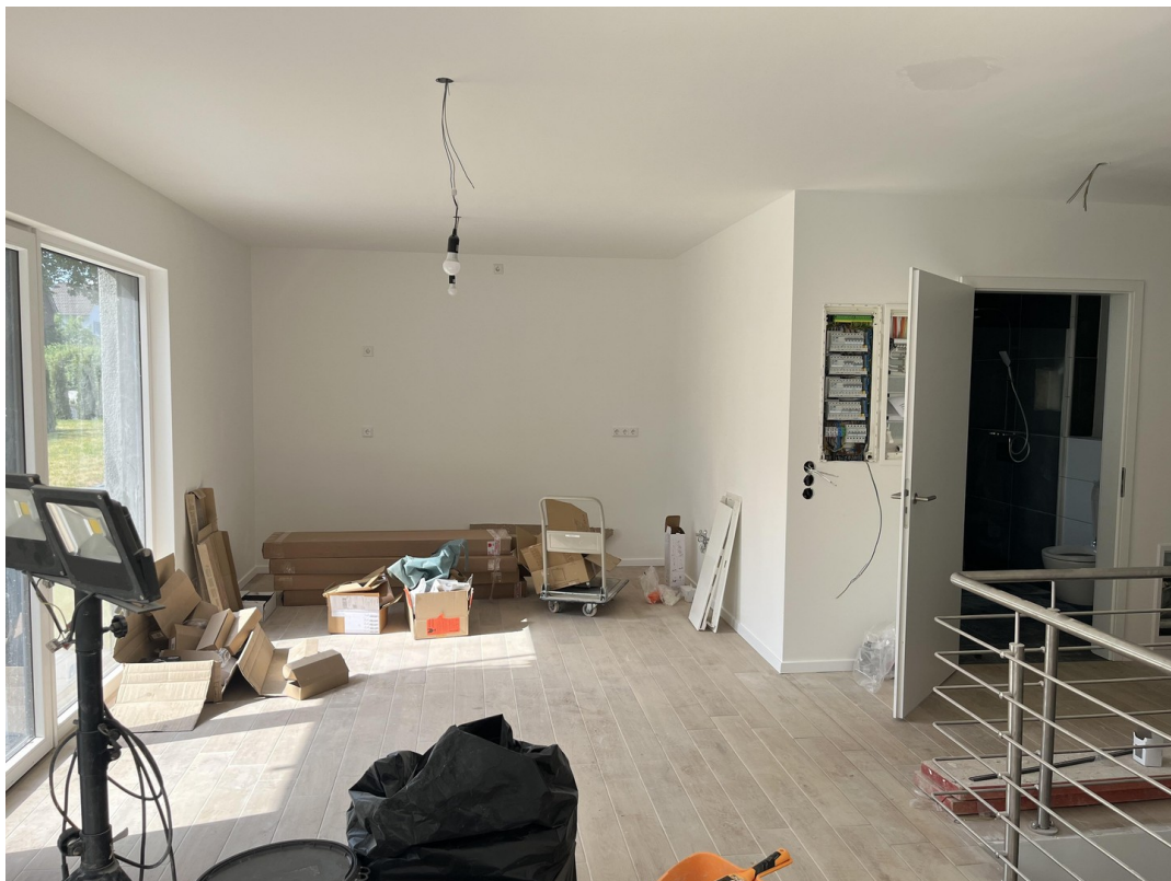
EG - Küche