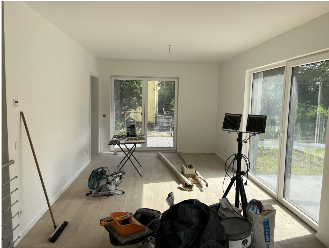
EG - Wohnzimmer