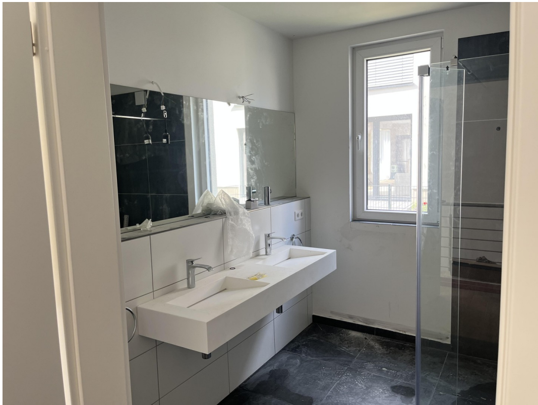
EG - Badezimmer