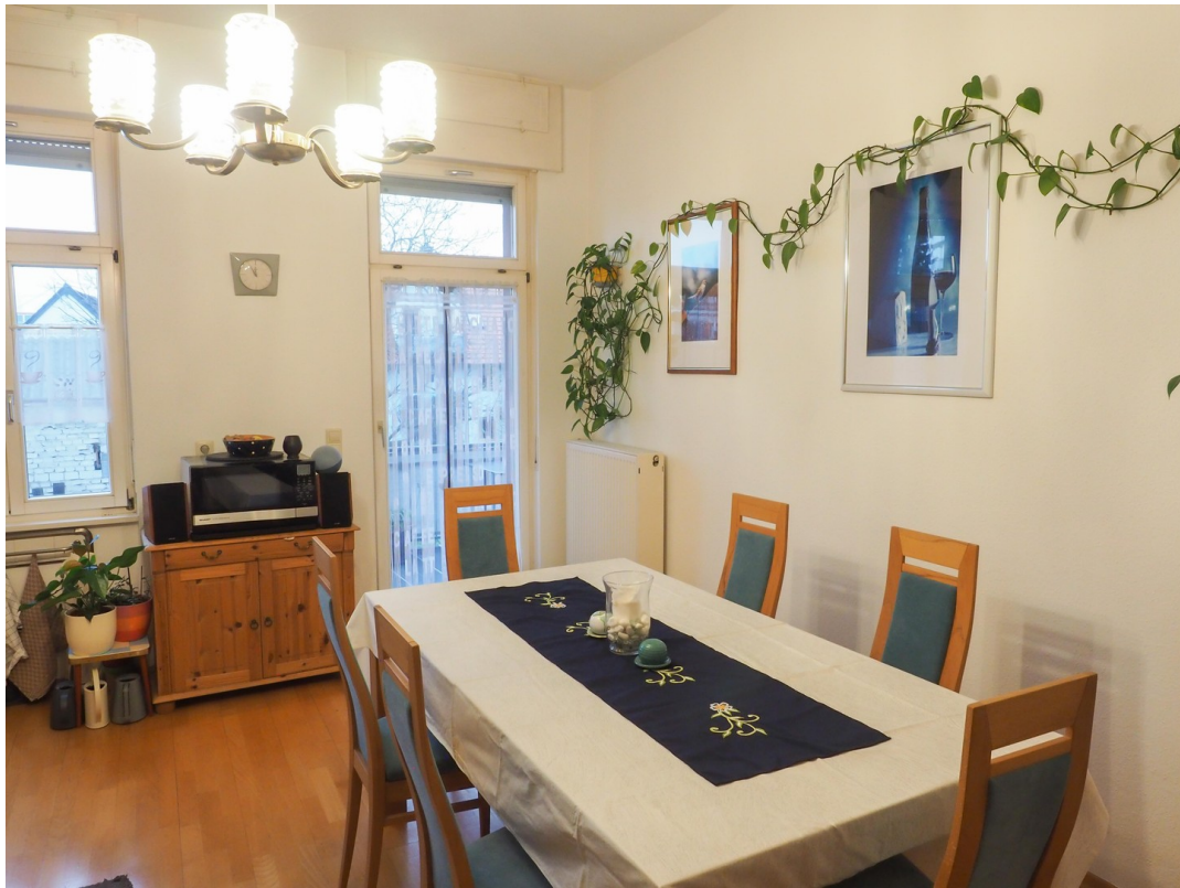
Küche Richtung Balkontür