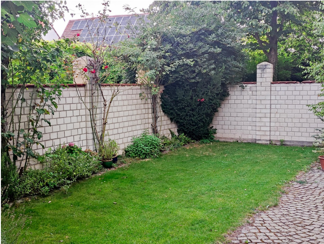
Hof mit Garten