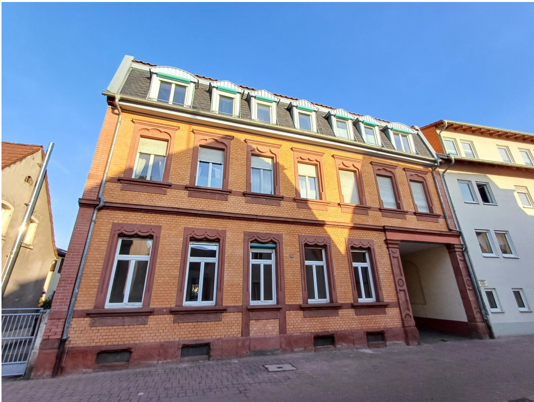
Hausansicht von der Straße